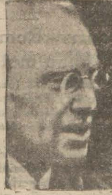
Hırvat lideri Veladmir Matchek

Doktor Matchek Hırvatistanın istiklâli için çalışmış olan meşhur Hırvat rühasıdır. Matchek hapishaneye girdikten sonra bile bu sevdaından vazgeçmemiş ve hattâ geçen sene Petit - Parisien gazetesinin bir muhabirine beyanatta Hırvat lideri Veladmir Matchek