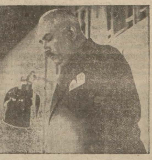
Bay Recep Peker dersini veriyor

İnkilâp kürsüsü ders-lerine dün de Üniversi-te konferans salonunda devam edilmiştir. Dün-kü ders C. H. F. genel yazıcısı Bay Recep Pe-ker tarafından verilmiş-tir. Dünkü ders yazıyor-uz: