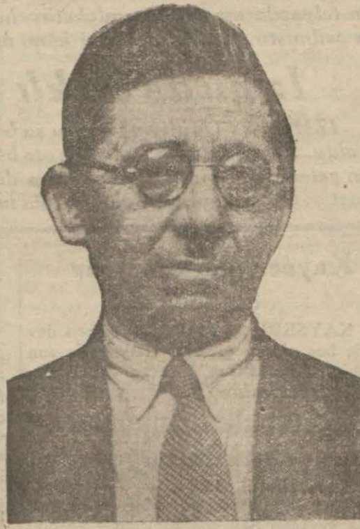
Maliye Bakanı Bay Fuat

Kabul edilen kanunlar ANKARA, 22 (A.A.) — Kurultay bugün Esat Savay (Bursa) ın başkan-lığında toplanarak gündeliğinde bul-unan kanunlar üzerinde görüşmüş ve o-naylamıştır. Bu görüşmelerde Türki-yede ikametgâhı olan b'r yabancıya vasiyet ve miras suretiyle geçen veya herhangi bedelsiz ve ivazsız bir tasaru-f ile kazanılan menkul ve gayri men-kul mallardan yurd dışında bulunan-lardan menkul ve intikal vergisi alın-mıyacağı hakkında tefisîr fıkrasını, bey-nelmîl alakomünikasyon mukavelesi ile telsiz telgraf ve telefon nizamna-mesinin, demir yolları ile beynelmîl eya ve yolcu nakliyatına ait olan kanun-ların tasdiklerine ait olan kanun lâyhahatı ile Ankarada yapılan emni-yet âbidesi heykelleri ve teferruatın -dan günrük resmi alınmaması hakkın-daki kanunu onaylamış ve buğday ku-rumu kanununun bazı maddelerinde yapılacak hükümete teklif edilmiş o-lan değişiklikleri tasvip eylemiştir. Buna nazaran değişen birinci madde: Nüfusu 10 bin ve daha yukarı kasa-(Devamı 2 inci sahifede)