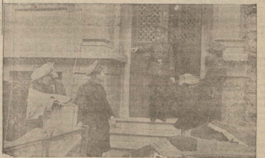
Gizli eroin fabrikası ve araba içinde tutulan eroin paketleri