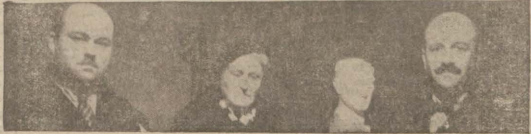
Vitrin müsabakasını idare eden jüri heyetinden bir kaç sima..

Cumhuriyet Halk Fırkası grubu Bay Cemil Uybaddın başkanlığında toplandı. 1 — Ruhani kıyafet kanununun dahil ve hariçteki tesirleri ve Bulgaristandan kaçıp Yunan ellerinden Türkiye'ye gelmek isteyen Türklerin Yunan topraklarında Bulgarlar tarafından takibata maruz kalmaları hakkında Manisa sayıları Bay Refik Incenin takri üzerine Hariciye (Devamı 2 inci sahifede)