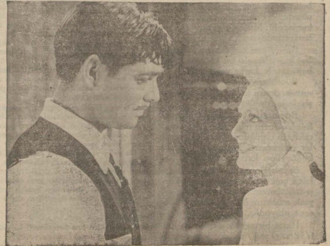
Jeanne Crawford'la Klark Gable Vakası rüyası filminde

Fotoğraflar güzel, dekorlar güzel, mükâlemeler güzel, ve bilhassa son rövyü sahneleri çok güzeldir. Bu film herkesin ve bilhassa dans sevenlerin zevkle seyrebilecekleri bir filmidir.