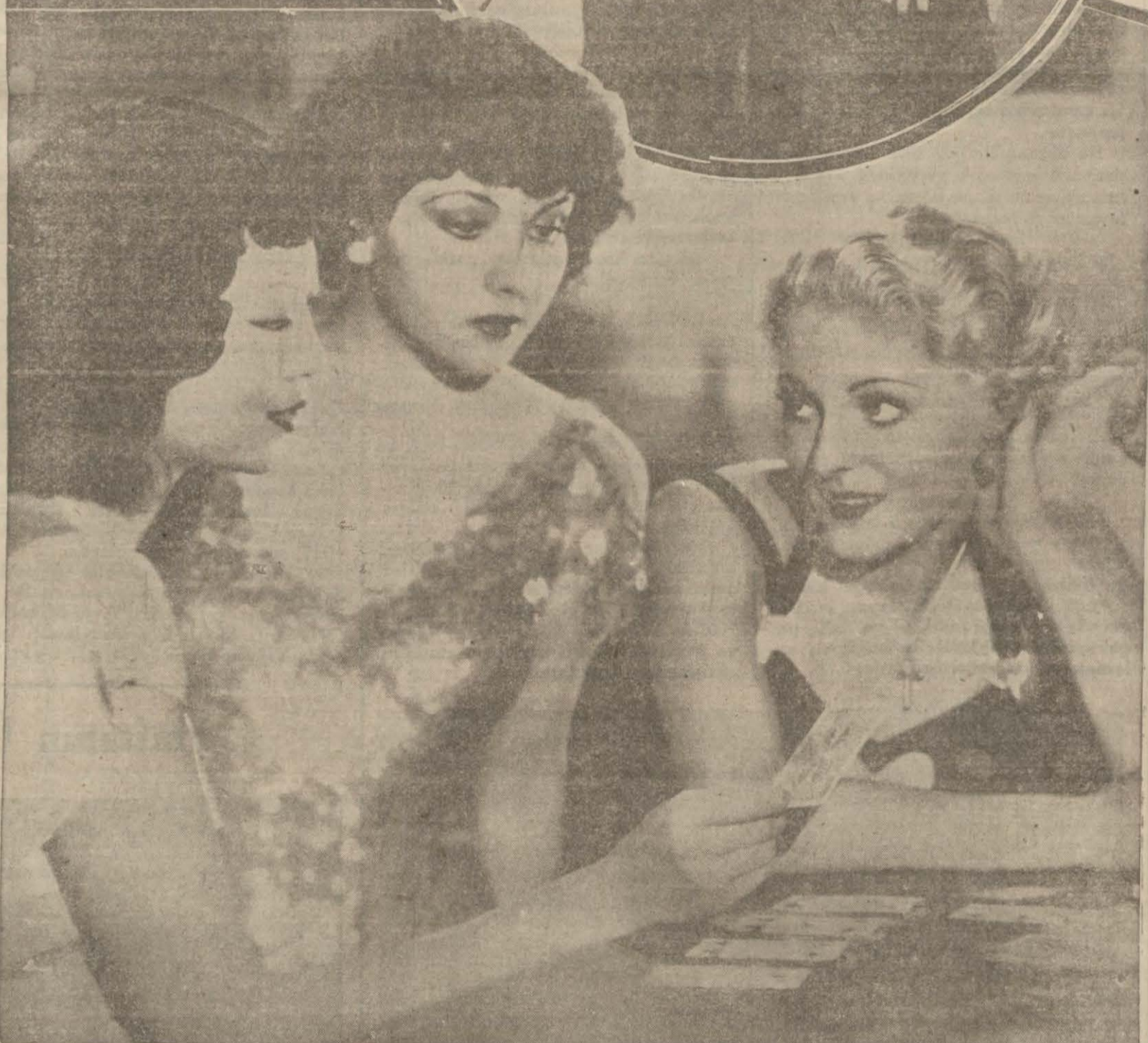
Yukarda Amerikanın sevimli artistlerinden Ginger Gogers, ortada Alice Field bu ihtiyar kabbede ve kabare arkadaşları