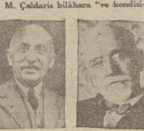
M. Çaldaris M. Venizelos

— M. Venizelos hükümete karşı daydığı muhalefet dolaysile yaptı-ğı beyanattın memleketle zarar vere-ceğini takdir etmiyor. Esasen d'ni bir mahiyeti olmayan papas kisvesi dolay-sile Türkiye dostluğunun feda edilmesini akıllı başında hiç bir insan düşünemez,,