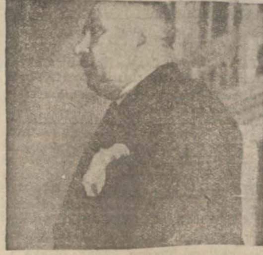
Bay Recep Peker

Yurttaşlar, tek insanın ve mukadder-ata birleşmiş insan yığınlarının, ulus-