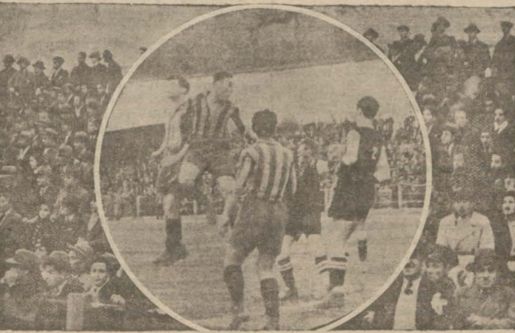
Dünkü maçtan bir en stantane ve kalabatık

Dünkü maçtan sonra Fener puvan vaziyetini düzeltmiş sayılabilir