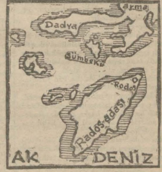
Rodos ve civarını gösterir harita

Akdenizin şark hav-zası emperialist siyasetler için me-zar olabilir