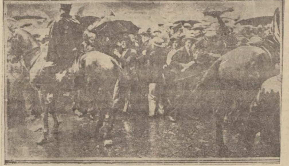
Amerikadaki grevler den bir manzara

Üç günde bir çok müsademeler oldu on kişi öldü kırk kişi yaralandı bir çok tevkifat yapıldı