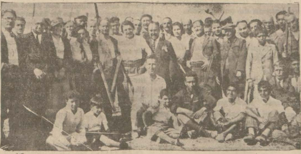
Dün Çekmece civarında bayram yapan İstanbul avcıları

İstanbul avcıları dün Çekmece civarında Çoban Çeşmesi mevkiinde 18 inci yıldönümü bayramlarını kutuladılar. Bayram münasebetile cemiyet ambarı, Çekmece ve Avcılar köyünde bulunan fakir çocuklardan 75 çocuğu da meccanen sünnet ettirdi. Avcılar bayramı çok kalabalık oldu ve eğlenceli geçti.