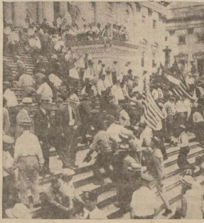
Amerikadaki grevlerden bir enstantane

Her iki fikrin de mübalâğat olduğu anlaşılmalıdır. Grevci amelenin nisbetini tayin etmek güçtür. Son dakikada, grevin cumartesi gece yarısında ilânı muhakkak görülmüyordu. Grevçiler, herhangi bir kıskartma hareketine karşı, intizamı ve in-