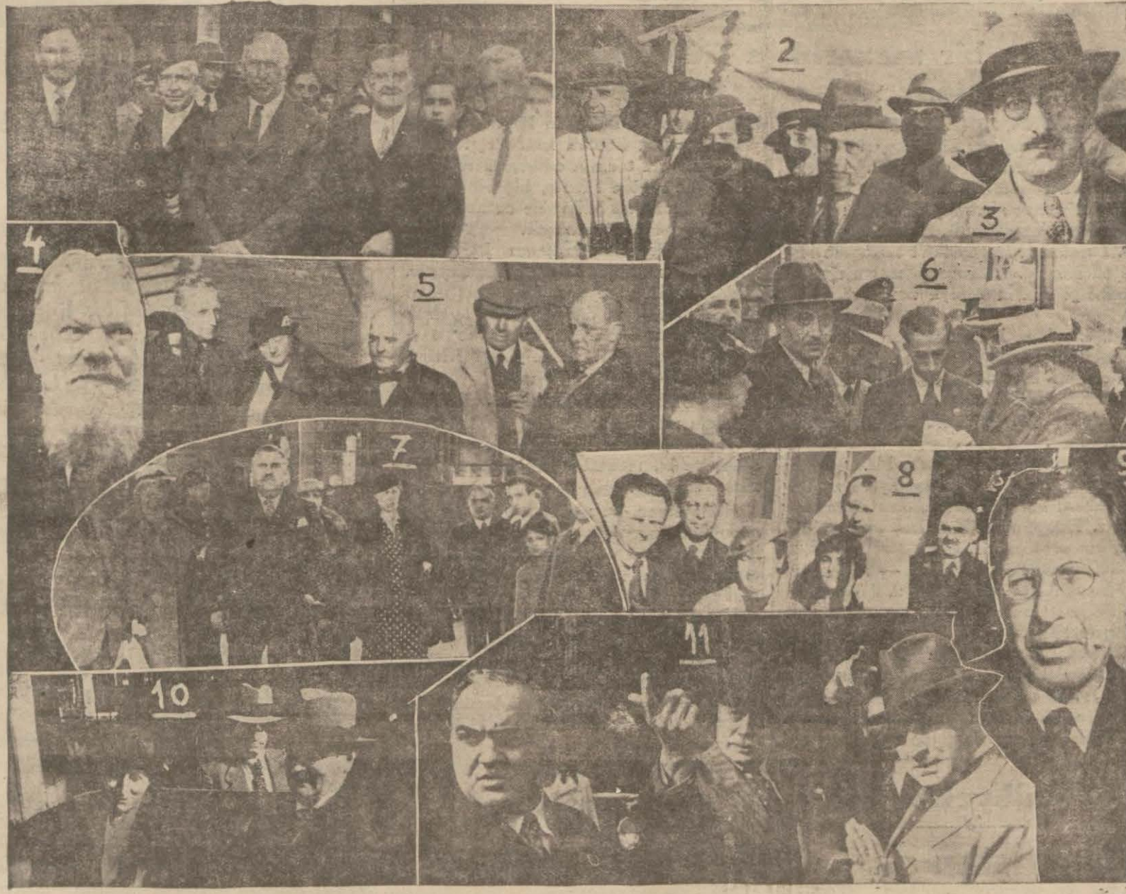
Parlâmentolar konferansına iştirâk için dün gelen murahhaslardan: (1) Amerikan heyeti, (2) İtalyan heyeti, (3) Bir Fransız murahhası, (4) Danimarka reisi, (5) Danimarka heyeti, (6) İspanya heyeti, (7) Belçika heyeti, (8) Polonya heyeti, (9) Polonya reisi, (10) İsveç heyeti, (11) Romanya heyeti.