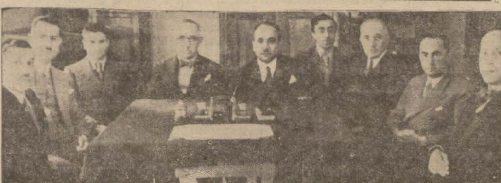
Gümüş ve nikel para şekillerini dünkü toplantısından seçen jüri heyeti

dün Cenevreden avdet etti. M. Maksimos matbuat mümessillerine beyanatta bulunarak Türkiye'nin, Cemiyeti Akvam konseyine girmesinden duyduğu büyük sevincini anlattı ve bu hâdisenin dost Türkiye'ye ve mümtaz mümessili Tevfik Rüştü beye bahsettiği şereften sitayişle (Devamı 6 mcr sahifede)