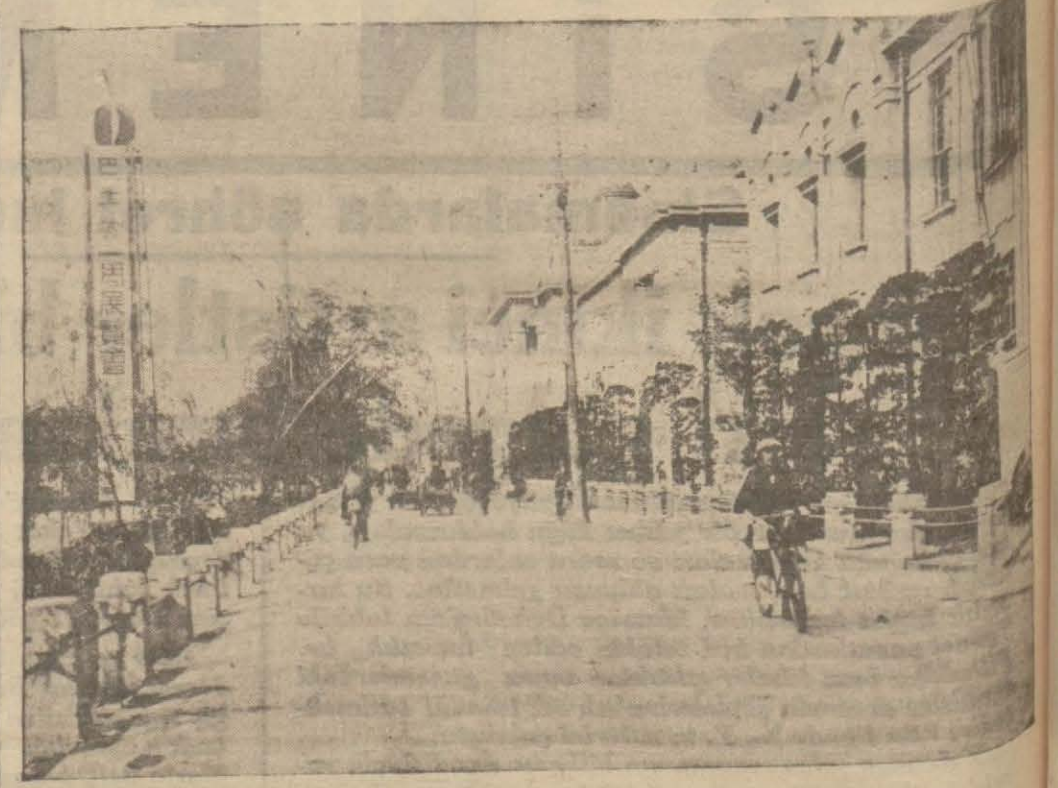
Bir tayfun neticesinde harap olan sokaktan bir manzara