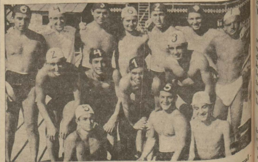
Dün Modada icra edilen İstanbul sutopu şampiyonasına yalnız Galatasaray ile Beykoz takımları iştirak etmiştir. Ve neticede Galatasaray takımı bire karşı 10 sayı ile kazanmıştır.

Tayfun Osaka köyünün tamamında kaybolmuştur.