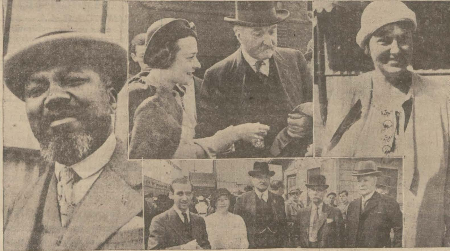
Fransız murahhaslarından bir zenci meb'us-İrlanda heyeti reisi,İsviçre hey'eti kâtibi umumisi,İrlanda hey'eti

Parlâmentolar konferansı ruznamesinde mevcut olan meselelerin en mühimmi İşsizlik ve gençliğin çalıştırılması meseleleridir