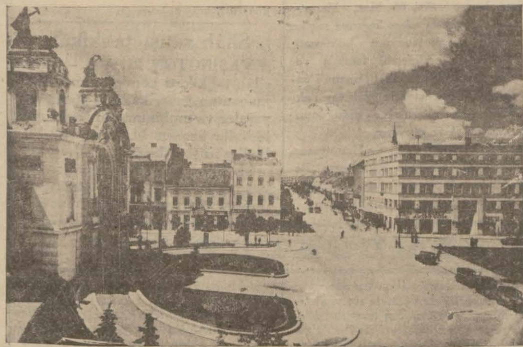
Romanyanın eline harpten sonra geçen Cluj (Yazısı 6 ncı sahifemizde)

Yıkılan mektepler Ozaka mnta- (Devamı 6 ncı sahifede)