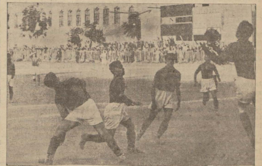
Dünkü maçtan birer enstantane

1934 Şilt şampiyonu, 1932 şampiyonu namzedinden yalnız bir gol yedi