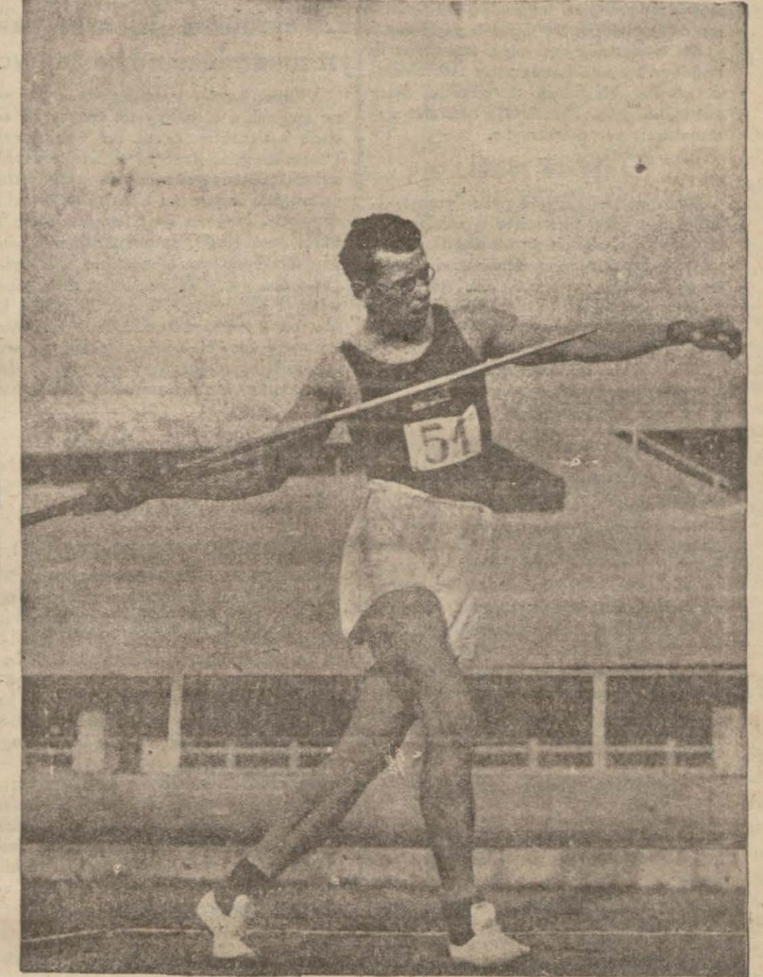
Ciritte Avrupa şampiyonu ve dünya rekortmeni Fenlândiyalı Yarovinen