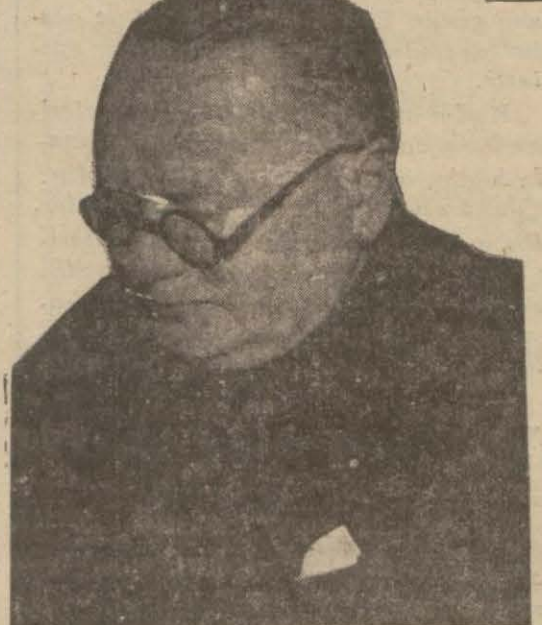
Milletler Cemiyetinde mühim bir nutuk söyleyen M. Litvinof

M. Litvinof Milletler Cemiyetinden çıkarken halk tarafından alkışlandı RUSYANIN İSTEDİKLERİ