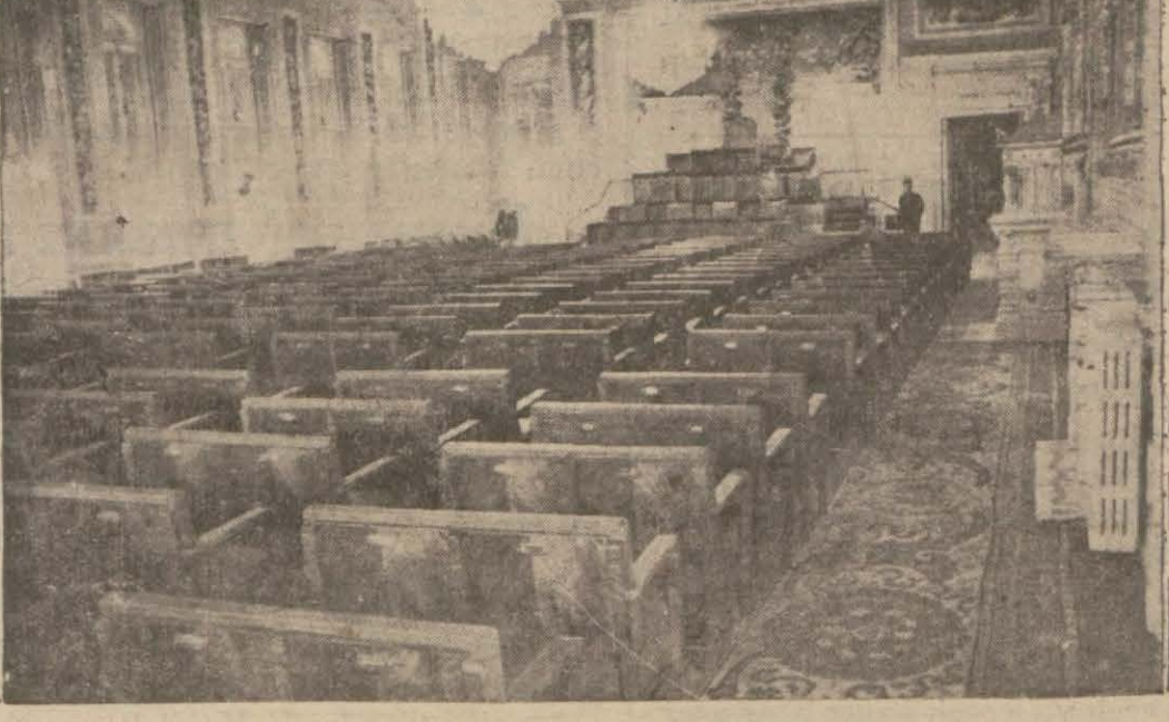
Başvekil İsmet Paşa Hazretleri Yıldızda parlâmentolar konferansının toplanacağı köşkün önünde. Aşağıda konferansın toplanacağı salon

Beynelmîl parlâmentolar konferansının toplanacağı Yıldız serayı yapılan tadilat ve yeni tefrışattan sonra çok güzel ve modern bir şekil almıştır. Konferansa iştirak edecek olan murahhaslar yollara çıkmışlardır. Cumartesi günü de Büyük Millet Meclisi parlâmentolar gurupuna mensup âza Yıldızda bir iğtima yapacaklardır. (Devamı 6 ncı sahifede)