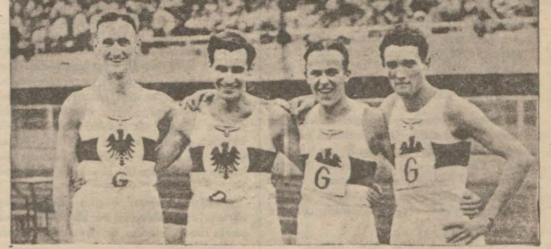
Avrupa şampiyonluğu alan Almanya bayrak takımı

Turnuva 23 Eylül pazar günü başlayacaktır. Kayıt müddeti 21 Eylül cuma günü saat 12 ye kadardır. Maçlar Taksim bahçesi dahilinde kulübün yeni inşa ettirdiği kortlarda oynanacaktır.