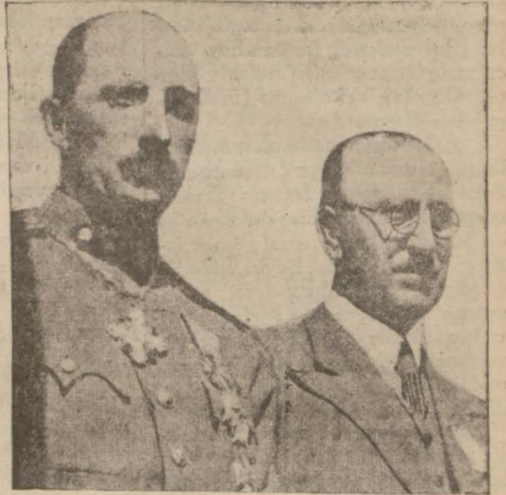
Bulgar kralı Boris ile Bulgar Başvekilî M. Georgieff merasim esnasında.

"Şıpka ve civarında iki yüz bin Bulgar ve Rus yatıyor. Merasim idare eden Bulgar Kralı açış nutkunda, şimdiki Bulgar ordusu nüvesinin Şıpkada doğduğunu söylemiştir. Bir buçuk milyon levası hü-