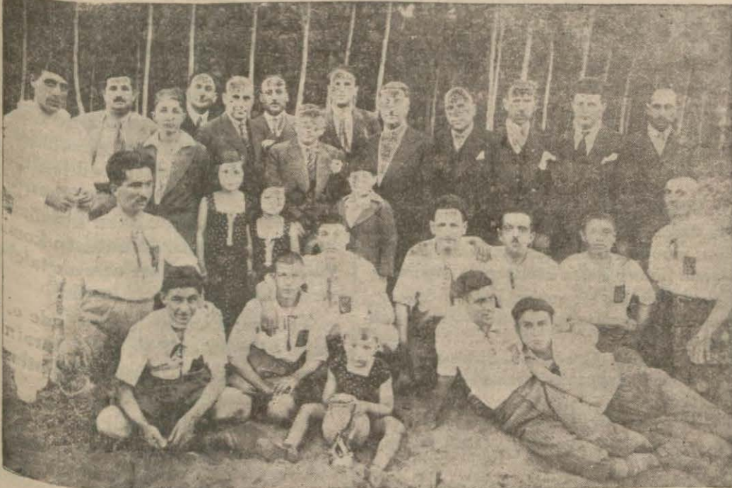
Gümüşhane Halkevinin çalışkan uzovaları

GÜMÜŞHANE, (Milliyet) — 933 şubatında tesis edilen Gümüşhane Halkevinin sakfı altında toplanan gençlik her sahada kayde değer bir varlık göstermektedir.