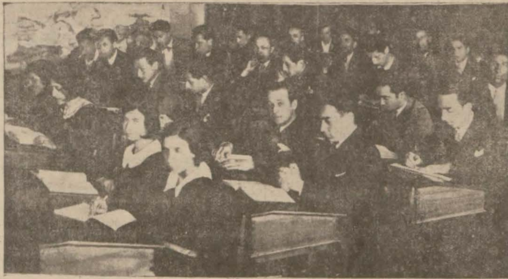
Geçen devrede yapılan imtihanlardan bir intiba

Bugünden itibaren Lise ve Ortaokullarda ikmale kalanların imtihanları başlıyor