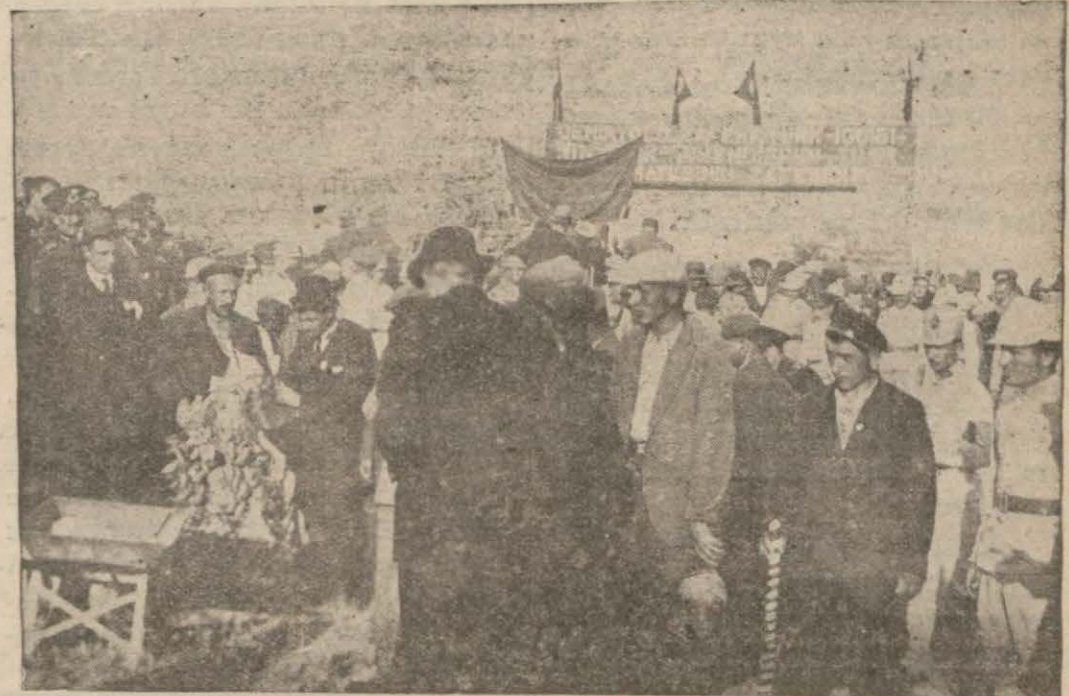
Afyon — Antalya demiryollarının temel atma merasimine dair muhabirimizin gönderdiği resimlerden.

Afyon — Antalya hattının temel atma merasimi hakkında evvelce tafsilât evrimistik. Dün muhabirimiz bu merasime ait resimler gönderildi. Aynı zamanda 30 ağustos bayramı kutlulama merasimi yapılmıştır. Merasim şark ve cenup istikametlerinden şehre ilerleyen ilk ordu kıtalarını temsilen yapılan hareketlerle başlamış, atılan toprak ve kıtaat tarafından kullanılan manevra fişeklerinin tirakaları arasında on iki sene evvelki cehennemî gün canlandırılmıştır. Saat on yediye hattın temel atma merasimi başlamış, nutuklar söylenmiş, kurbanlar kesilmiştir. Bu münasebetle 84 şehit yavrusu da baştan aşağı giydirilmiş ve sünnet ettirilmiştir.