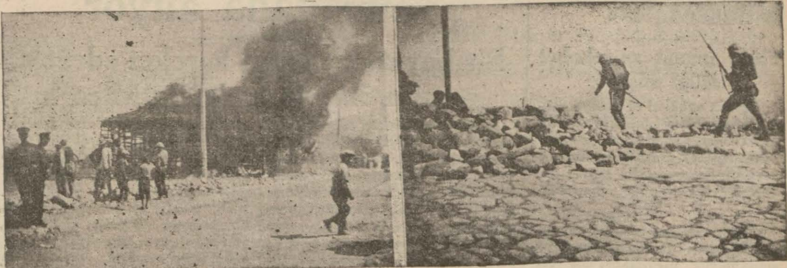
Afyon muharebesini temsilen çıkarılan bir yangın ve hücum müfrezelerinin bir akını

Afyon — Antalya hattının temel atma merasimi hakkında evvelce tafsilât evrimistik. Dün muhabirimiz bu merasime ait resimler gönderildi. Aynı zamanda 30 ağustos bayramı kutlulama merasimi yapılmıştır. Merasim şark ve cenup istikametlerinden şehre ilerleyen ilk ordu kıtalarını temsilen yapılan hareketlerle başlamış, atılan toprak ve kıtaat tarafından kullanılan manevra fişeklerinin tirakaları arasında on iki sene evvelki cehennemî gün canlandırılmıştır. Saat on yediye hattın temel atma merasimi başlamış, nutuklar söylenmiş, kurbanlar kesilmiştir. Bu münasebetle 84 şehit yavrusu da baştan aşağı giydirilmiş ve sünnet ettirilmiştir.