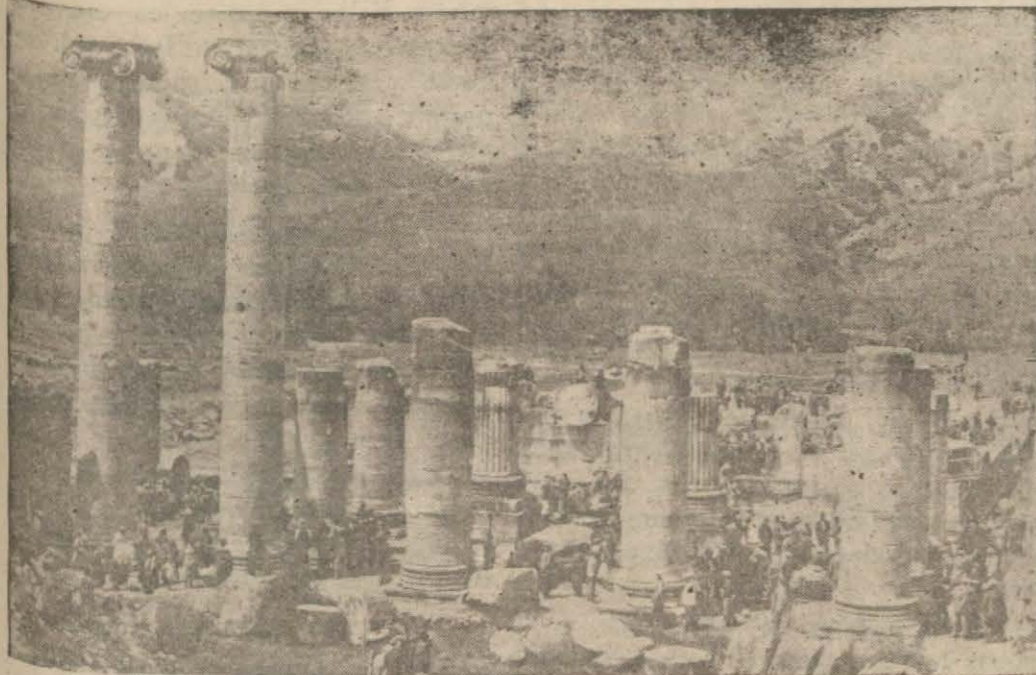
Salihlide Sart harabeleri

SALİHLİ, (Milliyet) — Bu yazınla dünyanın en eski Türk şehrinin olan Sart sitesinin harabelerini anlatmağa çalışacağım.