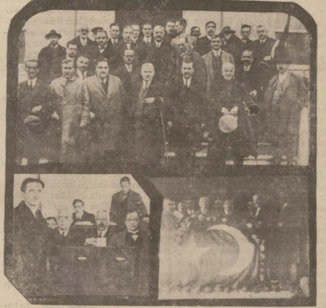
Eski belediye intihabâtından bir kaç intiba

Bu münasebetle her yerde tezahürat yapılacak şehir donatılacak, İntihap encümenleri bugün teşekkül etmiş bulunacak ve faaliyete geçecek