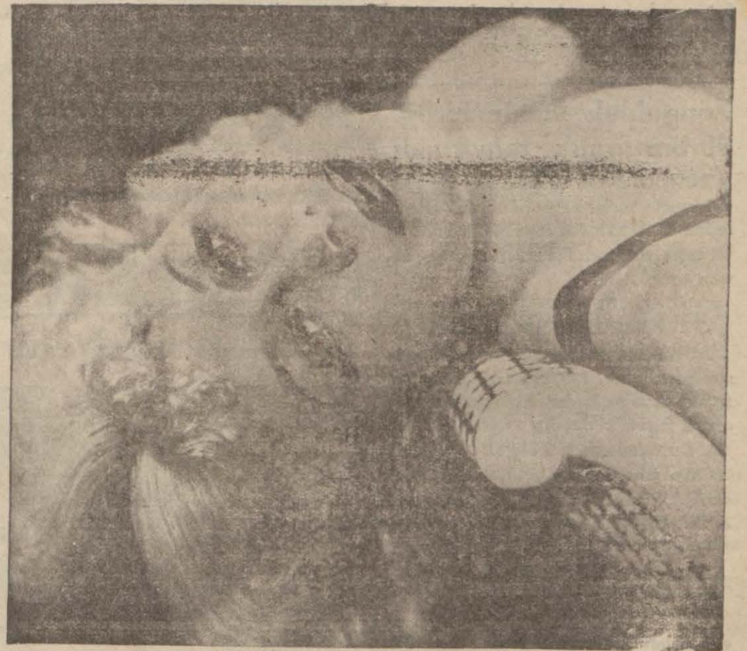
Hollywood'da en ziyade beğenilen ve ismi en güzel artist diye çıkan Ginger Rogers

si muhakkak bu beş kategorinin birisine dahildir. Aldığım mektupların yüzde sekseni Fransanın cenubundan gelir. Yarısında cevap için pul vardır. Yarısında da yoktur. Yaşlı hanımlardan ve erkeklerden aldığım mektupların adedi mahduttur. Bazan hediyeler gönderirler. Cigara tabakası, kravat, kitap gibi... Şimdiye kadar aldığım mektuplar arasında en mühim mektuplar benim ölen çocuklarıma çok benzediğini söyleyen annele-rinkidir; en garip mektup 27 sahifelik şiir; en tuhaf mektup ihtiyar bir kadının yardım teklifi; en saçma mektup Bouboule 1. rolü için tebrikler; meraklarını fazla ile-tiren mektuplar "Hanımlar gölünde,, Simone Simon'la çevirdiğim samanlık sahnesine ait fısıltı talepleri.