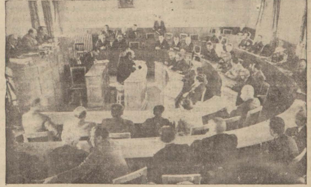
Şehir meclisinin dünkü fevkalâde toplantısında

Kongre bilfiil 26 temmuzda Safiye Hüseyin H toplandı. Ve bir hafta sürdü. Kongrede otuz muhtelif memleketin azası vardı. Cenubi Afrikadan, Japonyadan da gelmişlerdi. Kongrede muhtelif memleketlerde içki (Devamı 6 ncı sahifede)