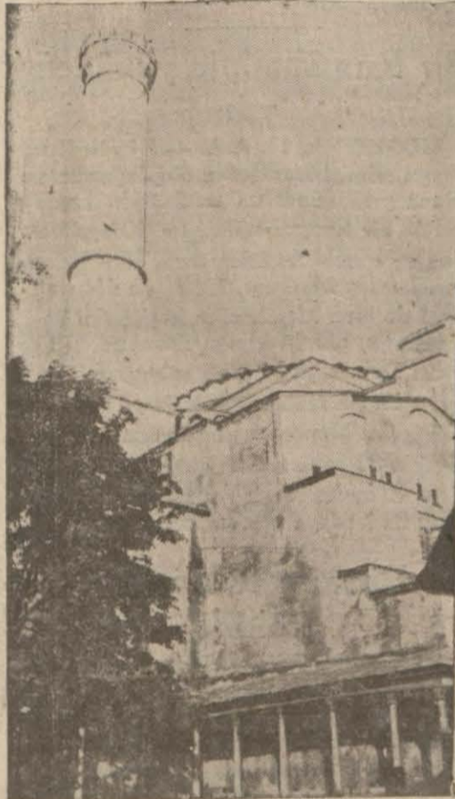
Ayasofyanın tamir edilecek kısmı

Binanın bir heyet nezaretinde tamirine başlanıyor