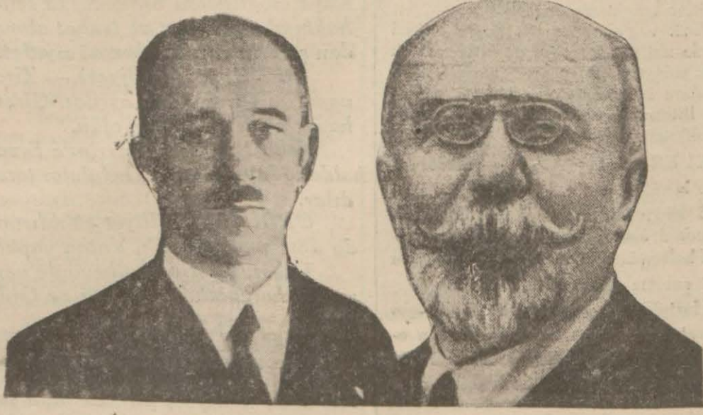
M. Benes M. Barthou Cenevre konseyinde

Bunun, halkın kendi kendini idaresine prensibine doğru ehemmiyetli bir adım teşkil ettiği aşikârdır. İnkılap fırkası gün geçtikçe ve inkılap merhalelerini muvaffakiyetle katettikçe demokrasinin ve cumhuriyetin ruh ve mânasını