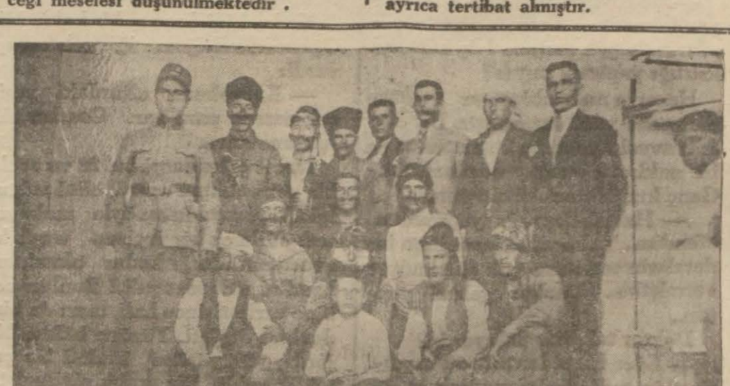
(H. Atilla Çavuş) un eseri başlıklı yazıda bahsedilen piyesi temsil eden lerle piyesten bir sahne.

Mahkeme hükümleri, mevcut dosya - lara ve komisyonun şimdiki kadar ver - miş olduğu prensip kararları ile itilâ - fnamele şikâma istinat edeceğinden, komisyon kapanırken mevcut dosya - ların nereye ve ne suretle teslim edile - ceği meselesi düşünülmeştir.