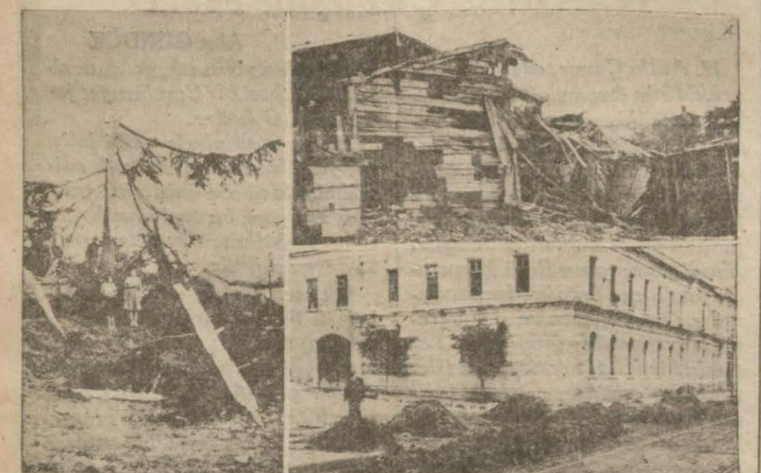
simlerimiz Beşiktaşta yağmurdan yıkılan evi, yıldırımdan parçalan Çam ağacını ve sokakları dolduran kumları gösteriyor

NEVYORK, 11 (A.A.) — Eski reiscumhur Hoover, "Saturday Evening post", gazetesinde yazdığı bir makalede hükümeti geniş bir propaganda sistemi vasıtasile matbuat hüriyyetinin kaldırılmasına doğru gitmekle ittihâm etmektedir.