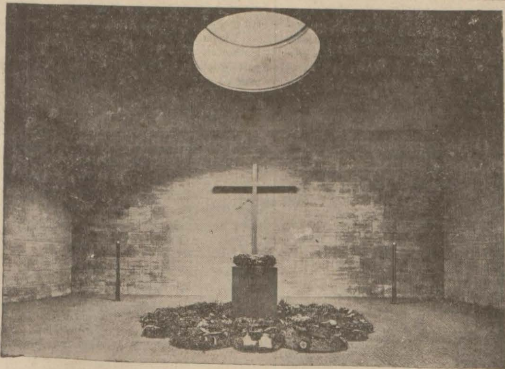
Berlinde Meçhul asker âbidesi

teşkil eden seçimlerde halka doğru, halkın reyine doğru, kendi esasını teşkil eden mesnede doğru yürümektedir.