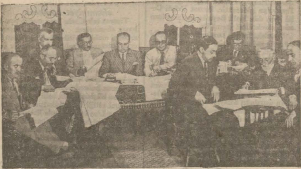
Beşiktaş intihap encümeni kaymakamlık dairesinde çalışıyor

164 halk hatibinin nutuk vermesi için tebligat yapıldı