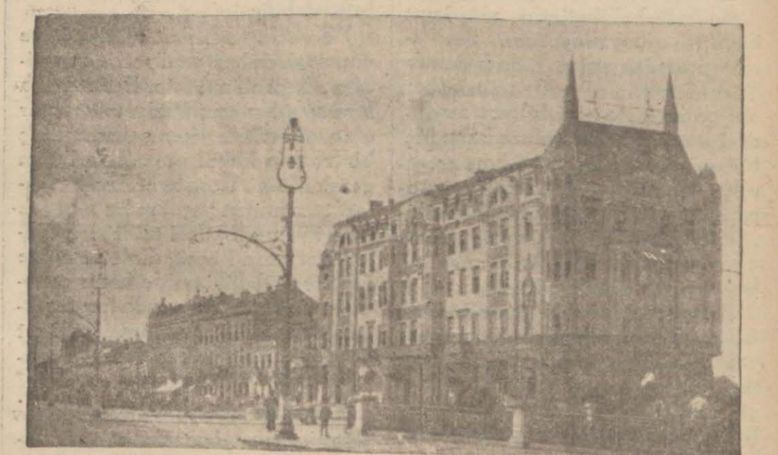
Yugoslavyanın Merkezi İdar esi Belgrattan bir görünüş

Bulgaristan'da içine alacak büyük bir Yugoslavya fikrini ileri sürenler vardır