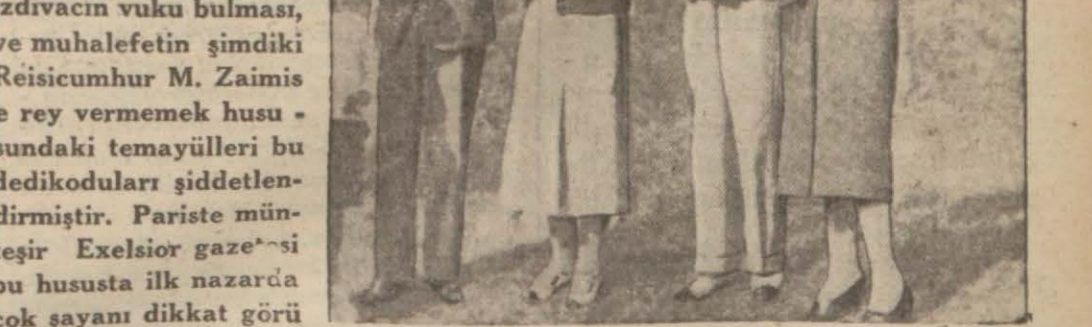
İngiliz Kralının oğlu Prens Georges'la nişanlı Prens Marina dostlarıyla beraber (Prens ve Prensese sağdadırlar)

Sabık Yunan ailei kraliyesine mensup olan Prens Marina ile İngiltere Kralının oğlu Prens Georges'un nişanlanması birçok siyasi dedikodulara sebebiyet vermiştir. Yunanistan -da yapılacak olan yeni Cumhuriyeti intihabının arifesinde böyle bir izdivacın vuku bulunması, ve muhalefetin şimdiki Reîsicumhur M. Zaimis'e rey vermemek hususundaki temayülleri bu dedikoduları şiddetlendirmiştir. Pariste müntezir Exelsior gazetesini bu hususta ilk nazarda çok şayanı dikkat görülen bir havadis neşretmiştir. Bu havadis nazaran muhalefet ve libe -raller lideri M. Venizelosun Londra seyahati bu şayanı dikkat nişanlanma merasimi ile alakalıdır. Fransız gazetesi aynı zamanda bu nişanlanma merasiminin ve M. Venizelosun, Londra seyahatinin, Yunanistanda tekrar kraliyetin iade edilmesini isteyen bazı kimselerin hareketleriyle münasebattar olduğunu kaydetmektedir. Bu takdirde Yunan tahtına Yunan hânedanına mensup birisi değil, fakat belki Prens Marina ile izdivac edecek olan İngiliz Prens George geçirilecektir. Atinada müntezir Messager d'Athenes gazetesi gayet emin membalardan aldığı malumata istinat ederek bu hususta çok şayanı larpazı taktip etmektedir. Filhakika Yunan mahafilinde söylendiğine nazaran bu nişanlanmanın hiç bir siyasi mânası yoktur. Belki sırf kalbi bir temayülün mahsulüdür.