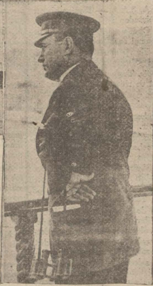
İtalyan filosu bir manevra esnasında ve M. Mussolini deniz manevralarında

İkinci filo limandan açılarak talimlere başlandıktan sonra birinci filo da açılmıştır. Gurup halinde yapılan talim-