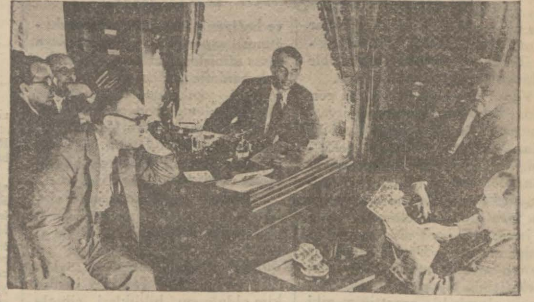
Kurtulay merkez bürosu Sovyet âlimlerinin de iştirakinde dün toplantısında...