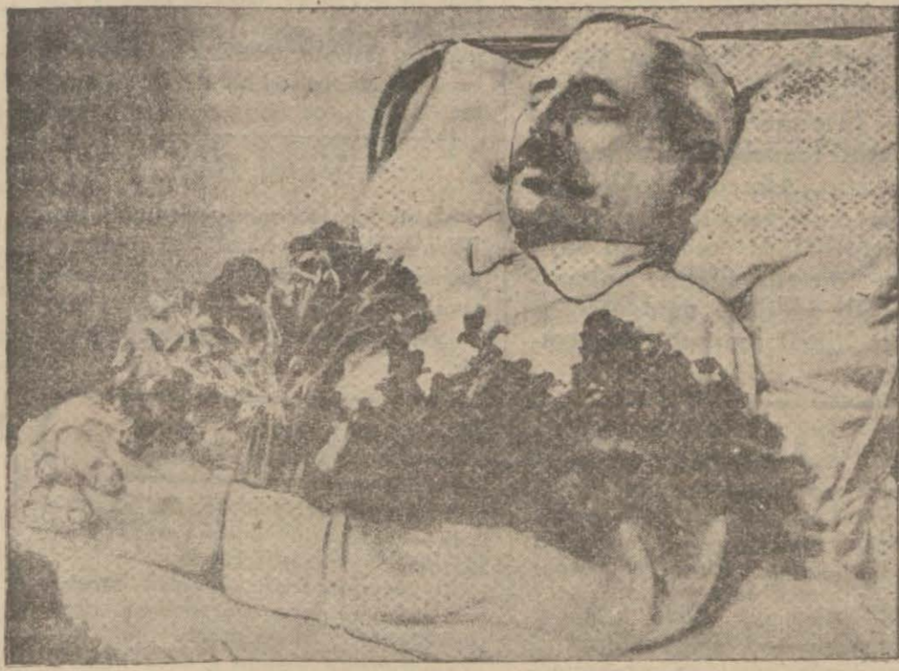
Mareşal Hindenburg ölüm döşğinde...

BERLİN, 7 (A.A.) — Alman istihbarat bürosu bildiriyor: Bir mülakat esnasında M. Hitler demiştir ki: — Umumî silâhlanma ve beynelmül gerginlikler hakkında diyebilirim ki, yeni bir harp, Almanyaya müteakıf bulundukça katien olmayacaktır. Millî sosyalist hareketi suna kanidir ki, harp hiç bir kimseye fayda temin etmez ve neticesi ancak harabî olabilir. Almanyanın bugünkü meseleleri harp ile halledilemez. Meşru müdafaa hali müstesna olmak üzere biz asla muharebe etmeyeceğiz. İngiliz hava kuvvetlerinin artması bizi hiç bir surette kızdırmaz. Çünkü İngiltereye hücum etmek fikrinde değiliz. Almanyanın müdafaa tetbirleri şu düşünceden mülhem olmalıdır: (Avrupada çok kuvvetli düşmanlar la çevrilmiş bulunuyoruz. Bunlar günün birinde bizden kabul edemeyeceğimiz bazı şeyler isteyebilirler. Harp tehlikesini çıkaran silâhlar değil, fakat silâhlardaki müsavatsızlıktır. Bu müsavatsızlık çok kuvvetli olan devletlerde zayıfların kabul edemeyecek-