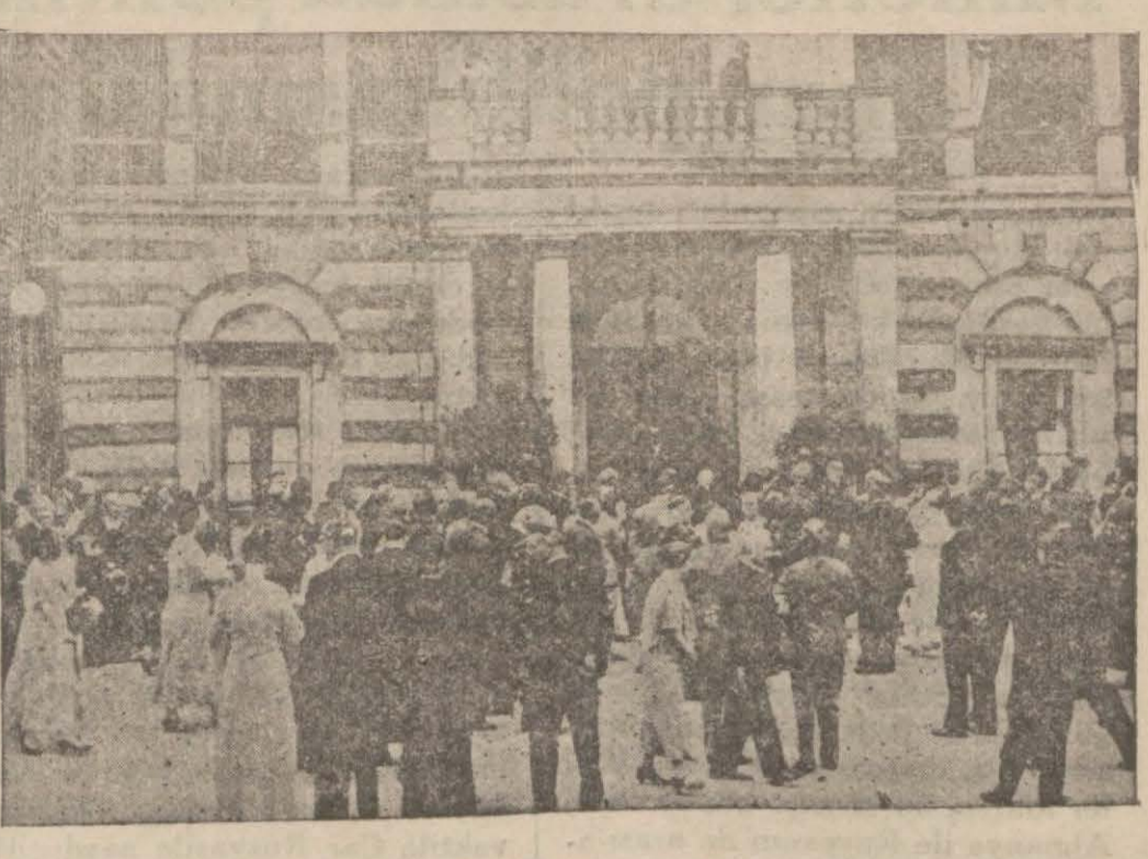
Bayreuth'taki radyo ile nakledilen Wagner opera temsillerinin verildiği Ope- ra binası antresi . . .