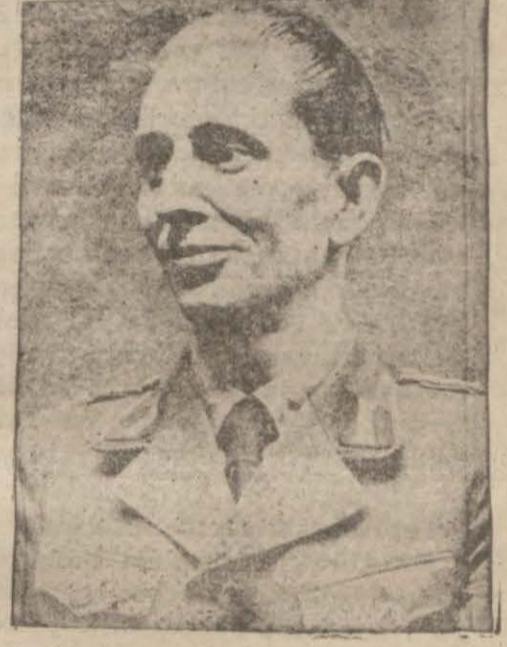
Alman radyo sergisini büyük bir muvaffakiyetle tanzim eden Reich gön- derici postaları reisi Eugen Hadamowsky

İnsaat hususunda da ehemmiyetli te- beddülât olacak ve ilk olarak şhirdye kadar kısmen hatırımda olmayan Thour- rie'de 60 kilovatlık bir mürsilenin inşa- ma (Brest civarında) başlanmak üzere- dir."