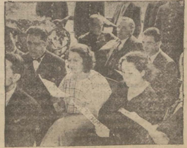
Kurultay marşı hazırlanıyor...