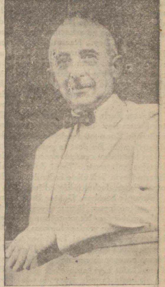
İsmet Paşa Hazretleri

Başvekil Paşa Hz. ve İktisat Vekili Bey bu küşat ve temel at-