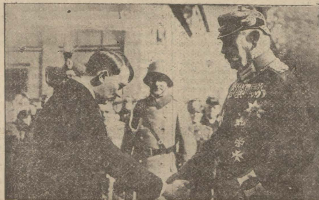
Bugün Reiscumhurluğu ahtesine alan M.Hitler Mareşalin elini sıkarken

— Manifatura, tuhafiyeye emsali mağazalarda çalışan işçilerin mesai saatleri sabahın 7 veya sekizinde başlamakta ve akşam 20-21, hattâ 23 e kadar devam etmek te idi. Yani mağazalarda çalışan işçilerin mesai saati diğer sahalar (Devamı 6 mci sahifede)