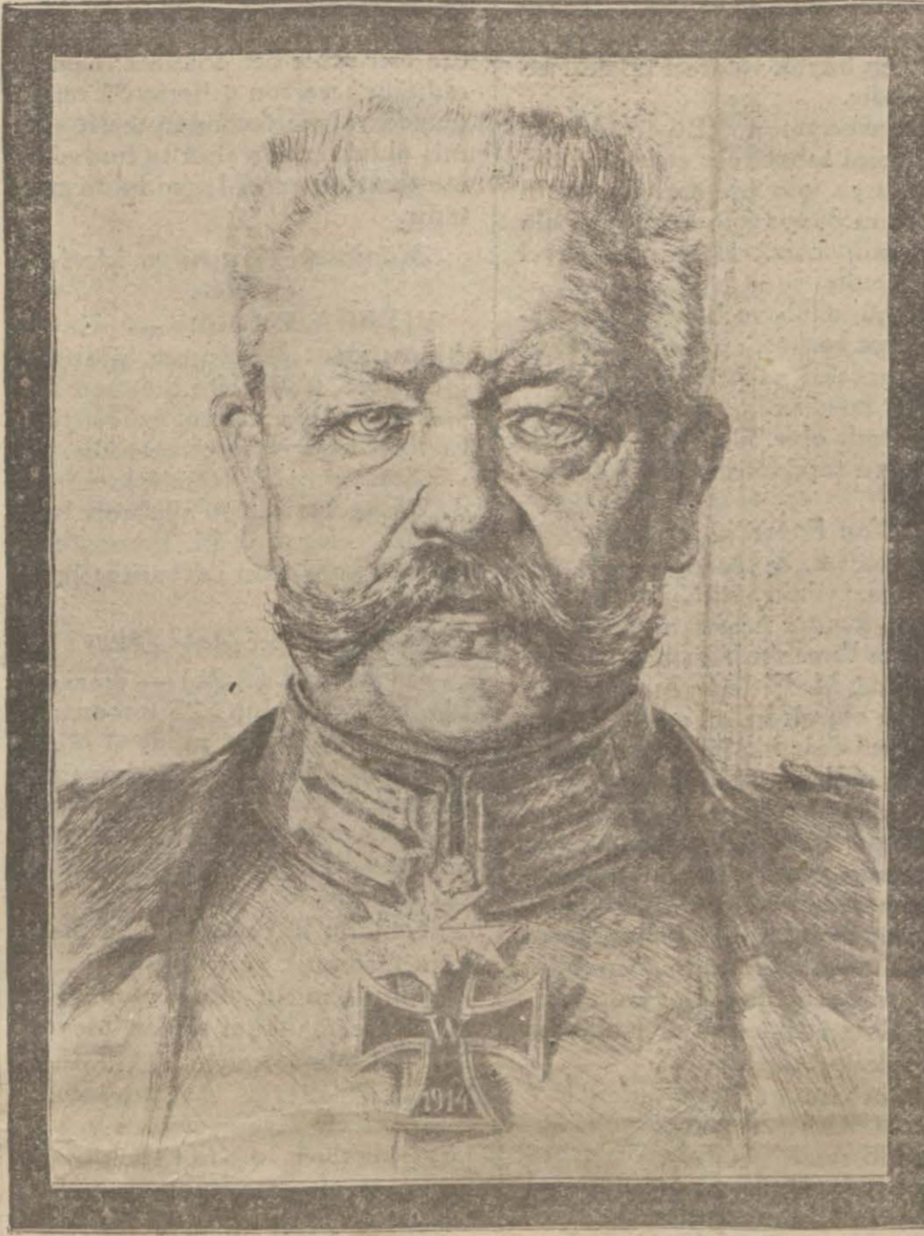
Mareşal Von Hindenburg

BERLIN, 2.A.A.— Reiscumhur Hindenburg, kendine gelmeden (Devamı 6 mci sahifede)