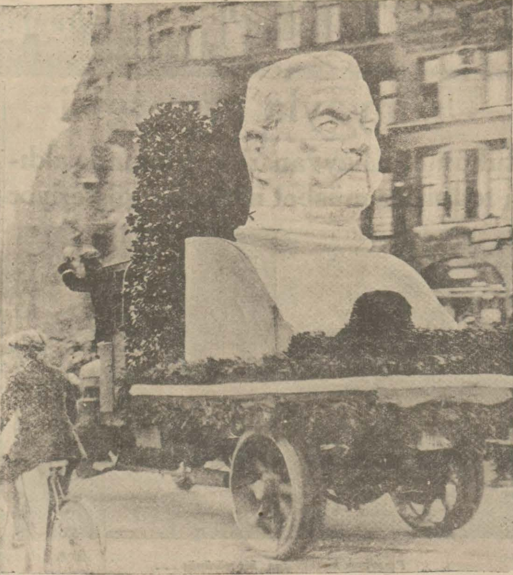
Reisicumhur intihabâtı esnasında Mareşalin Berlin sokaklarına dolaştırılan büyük bir heykeli