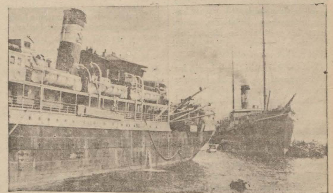
Erzurum ve Cumhuriyet vapurlarının kazadan sonraki vaziyetleri

Bu vesile ile zabıtlar ilk defa olarak yüksek ve sırmalı üniformalarını giymişler ve kılıçlarını takmışlardır. Bu provada Harbiye (Devamı 6 ncı sahifede)