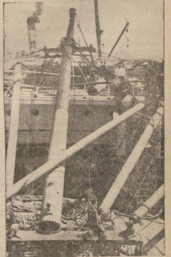
Erzurum vapurunun yıkılan direkleri (Devamı 6 ncı sahifede)

Cumhuriyet vapurunun öndeki baston direği, Erzurum vapurunun arka grandı direğini tutan iplere takılmış ve gemi rıhtıma doğru abanınca ipler kopmuştur. Bu suretle, iplere bağlı