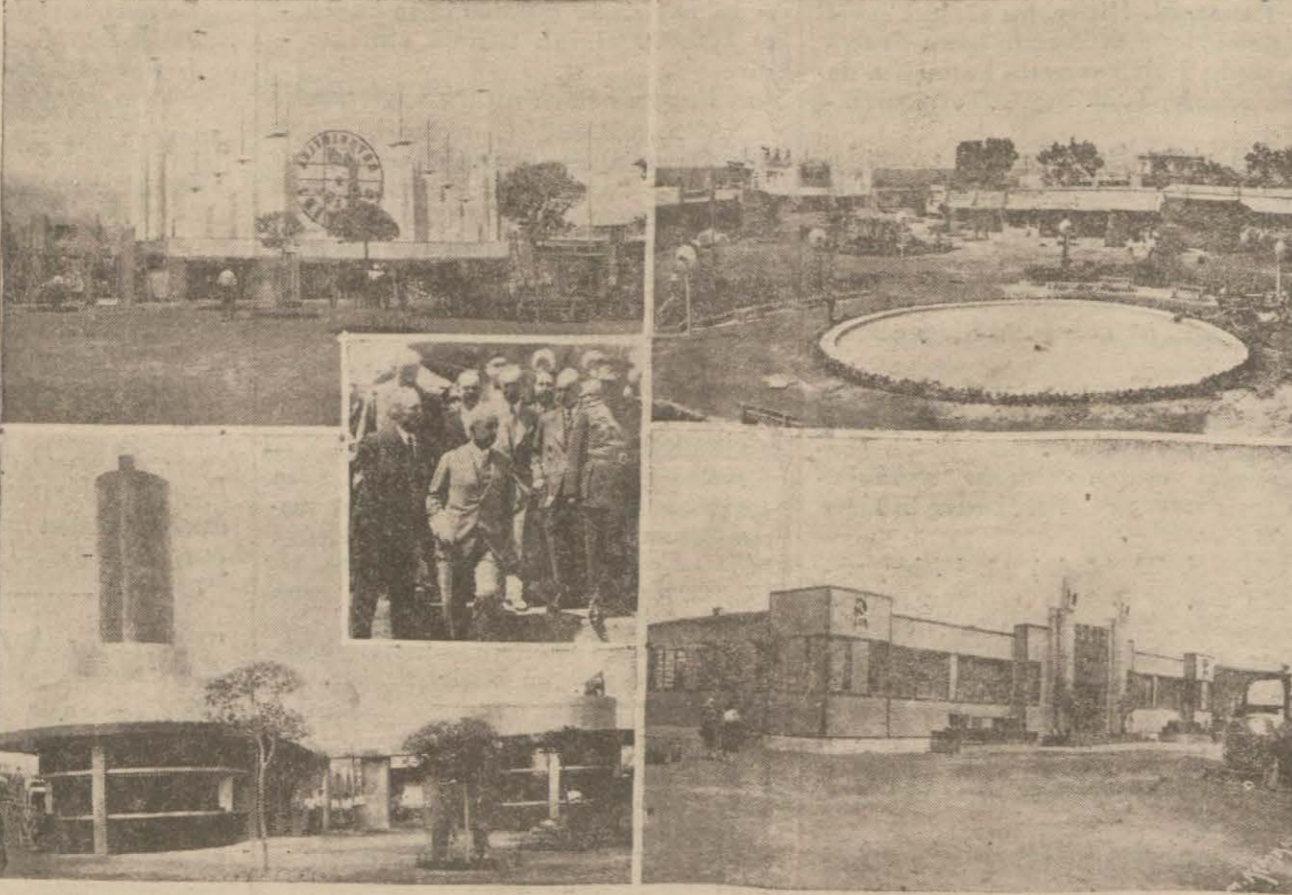
İzmir panayırının methali, umumî manzarası — Başvekil Hz. nin sergiyi teşrifleri — İş Bankası ve Sovyet sanayi pavyonları.

Türkiyenin en mamur yerlerinden bir numunesi olacaktır. Bunun ehemmiyetini takdir buyuran büyük Gazi bu ovanın sağlık ovası haline getirilmesini irade