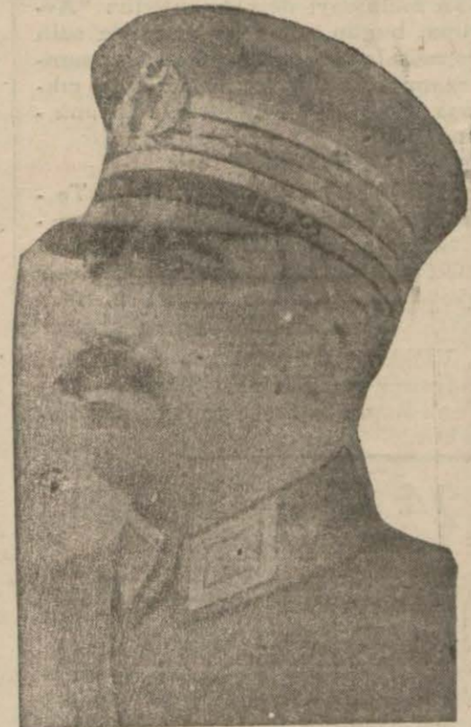
Büyük Erkânı Harbiye Reisimiz Müşir Fevzi Paşa Hazretleri

Program mucibince Harp akademisinden, deniz harp mektebinden ihtiyat zabit mektebi ile askerî liselerden birer kişi bir nutuk söyleyecekler ve en son ferik Cevat Paşa bir hitabe irat (Devamı 5 inci sahifede)