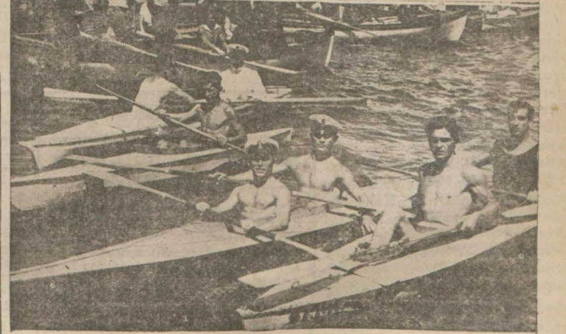
Düncü deniz yarışlarına iştî râk eden hanımlar ve kürehan yarışlarından bir intiba

Adaları güzelleştirme cemiyeti tarafından Heybeliada plâjında tertip edilen deniz bayramı çok