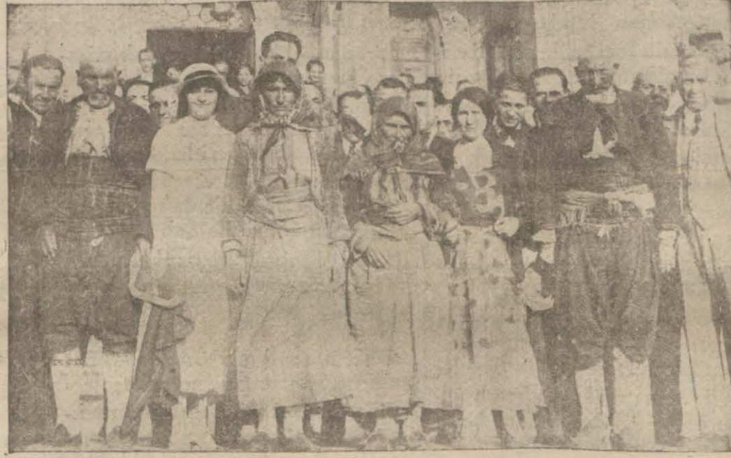
Birinci Kurultaya çağrılan köylüler

Kurultay, Dolmabahçe sarayında (Devami 6 ncı sahifede)