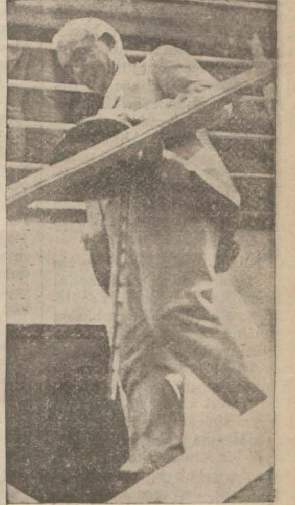
İsmet Paşa Hazretleri bir seyyahatleri esnasında

Geceyi vapurda geçiren Başvekil (Devami 6 ncı sahifede)