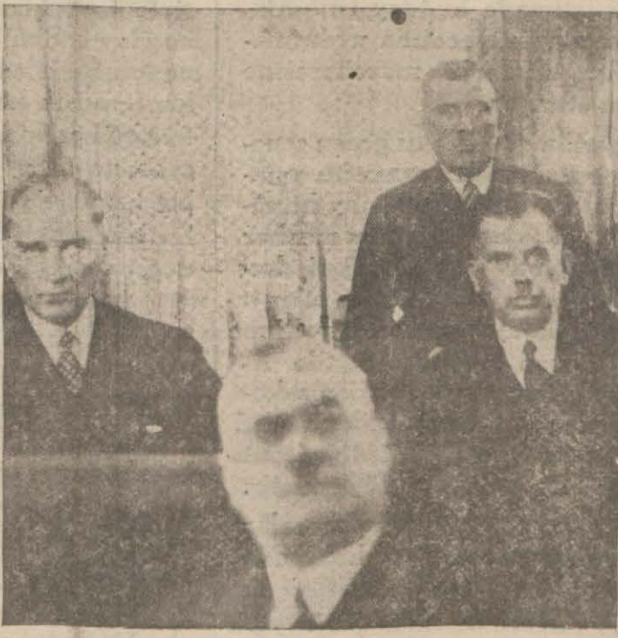
Birinci dil kurultayında Gazi Hazretleri müzakerati takip buyuruyorlar.