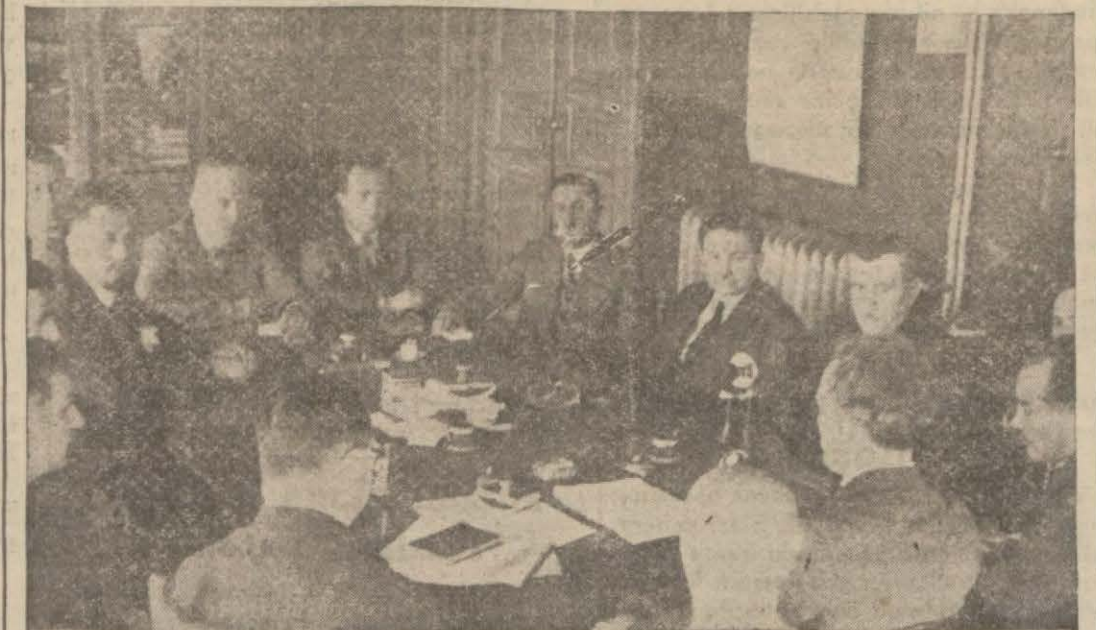
Dün belediyede kaymakamların yaptıkları umumî içtimada..

Pavilyonun açılmasından sonra Başvekil Hazretleri geceyi yatta geçirecekler ve yat salı günü sabah saat altıda İzmit limanına müteveccihen hareket edecektir. Saat onda burada da yine Başvekil Hazretleri tarafından kâğıt fabrikasının temel atma resmi yapılacaktır. İzmitte kurulacak olan kâğıt fabrikası Sümer bank tarafından inşa edilecek ve memleketin kâğıt ihtiyacının mühim bir kısmını karşıla-