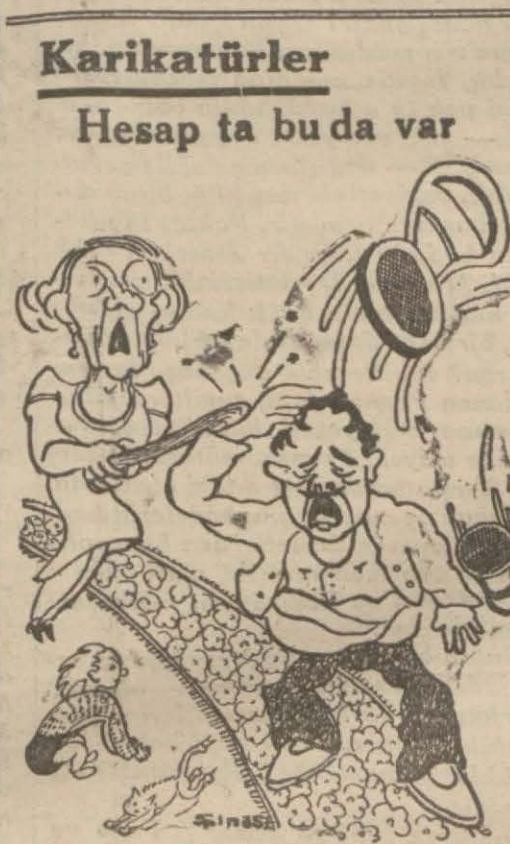
Saat 19,15 te hanım: — Sen misin eve erken dönen.