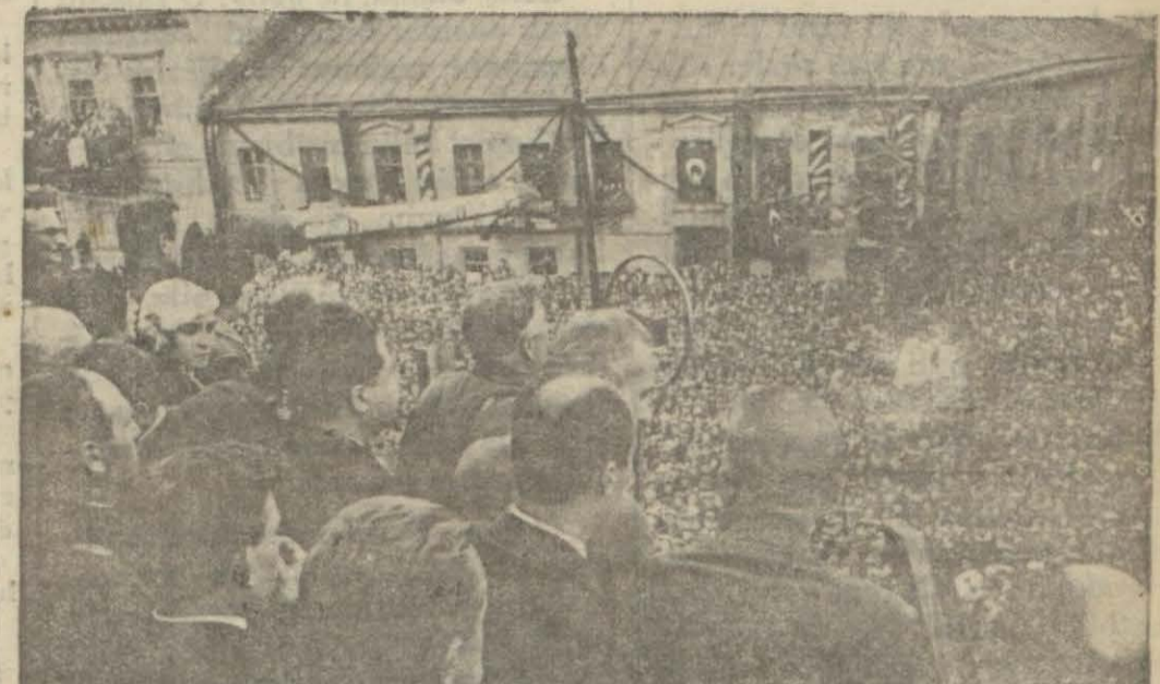
M. Vorşilof halka hitaben nutuk irat ederken.