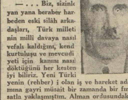
(Devamı 6 ncı sahifede)

Berlinr Boersenzetung yazıyor: Cumhuriyetin onuncu yıldönümü münasebetile Berlinde yapılan bir kabul resmind' Bayvekil muavini Vor Papen söylediği nutukta ezcümle dedi ki — . . . Biz, sizinle yan yana beraber harbeden eski silâh arkadaşları, Türk milleti nin milli davaya nasıl vefakladığını, kend kurtuluşu ve mevcudiyeti için kanını nasıl döktüğünü her kesten iyi biliriz. Yeni Türkiye (rehber) i olan iş ve hareket adama gayri müsait bir zamanda bir fırsatla yaklaşmışım. Alman ordusundaki (Devamı 6 ncı sahifede)