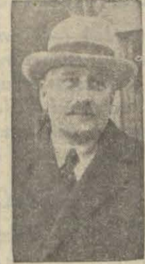
Maarif Vekili Hikmet Bey

ANKARA, 13 (Telefonla) — Üniversitede yapılan tesisat ve teşkilât dolayısıyla sarfına lüzum görülen 1 milyon 426,744 lira için maliyenin kefaletle Maarif Vekâletince bu miktarda bir istikraz aktine veya hesabıca küşadına mezuniyeti mutazammın bir lâihya Meclise gelmiştir.