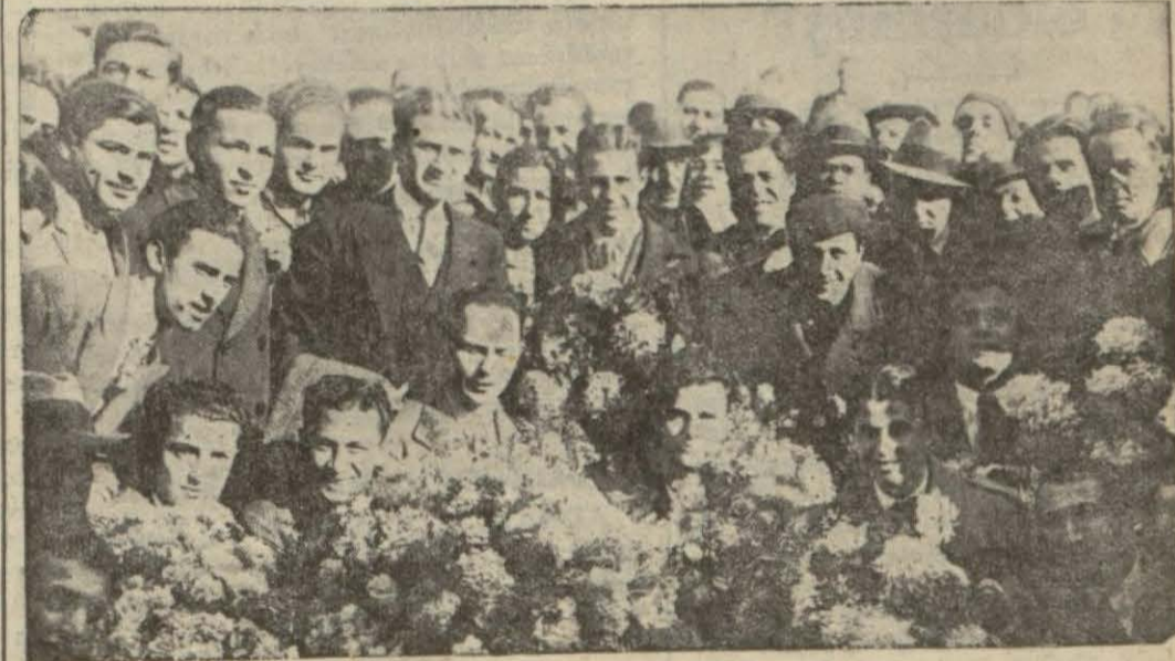
Fenerbahçe takımı İstanbulda karşılanıyor