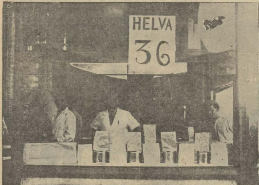
36 kuruşa helva ve bir helvacı dükkânı

50 kuruş bir okka şeker, 35 kuruş tahin sonra da 36 kuruşa bir okka helva!