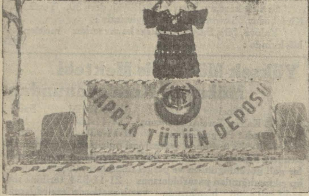
Sergiden bir köşe

İZMİT, (Milliyet) — Bayramda U-lugazi mektebindeki yerli mallar sergisini geziyorum. Sergide mahşeri bir kalabalık var. Genç ihtiyar, köylü, şehirliler insan birbirlerine kaynaşmış gibi. Halkevimizin tertip ettiği bu rağbetli sergide yürümek mümkün değil. İtişe kalkışa, tikim tikim insan selini yararak kendini küçük bir odada ve fakat dünyanın en büyük varlığıyla karşılaşıya buldum. Gazi Köşesi... Gazinin yaptığı eşsiz ve benzersiz inkişafın safhaları burada ne canlı ve manalı gösterilmişti. Bu, seyrine doyum olmaz köseyi hayran hayran, seyrettikten sonra diğer köşeleri geziyorum. Yerli kumaşlar, coraplar, mendiller, bezler, şekerler, keresteler, traverseler, gazozlar, şekerler müh telif hububat, tütün ve saire gözleri-