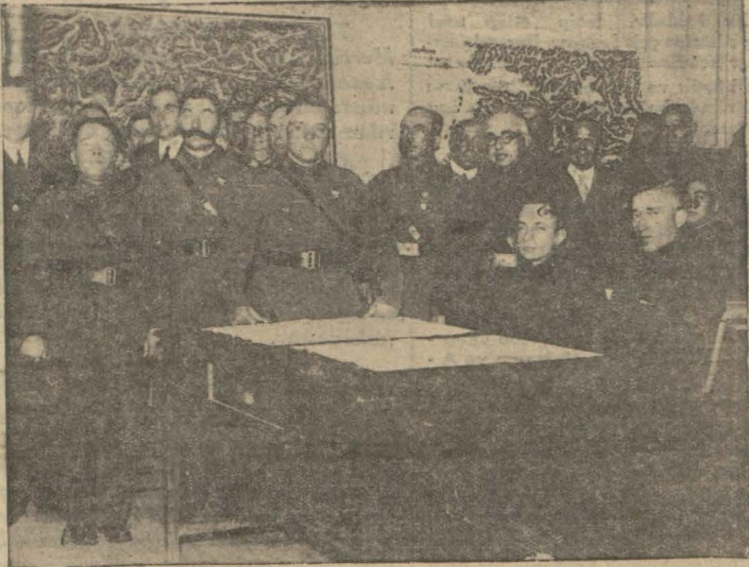
Misafirler erkânı harbiye akademisinde dershanede ..

Başvekilimizin misafirler hakkında tahassüsleri Heyet dün de bir çok ziyaretler de bulundu. İzmirli M. Vorosilof'u fahrî hemşeriliğe intihap ettiler