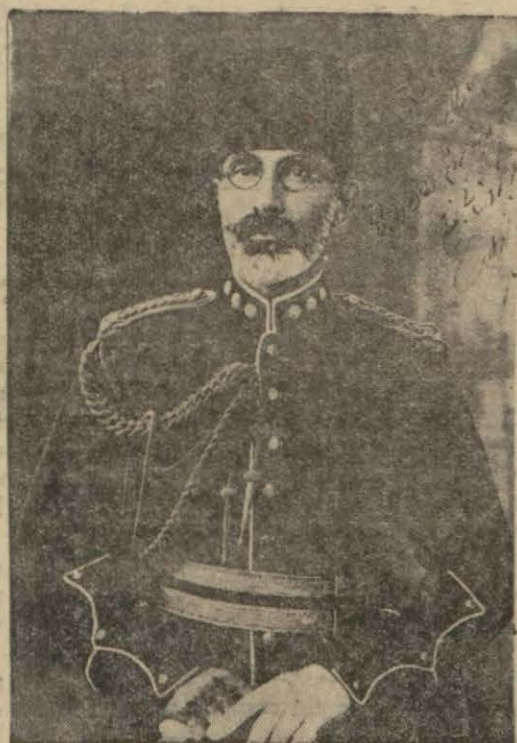
Nadir Şah Hz. leri

BOMBAY, 9 (A.A.) — Reuter ajansından: Bombaydaki Afgan konsolosluğuna