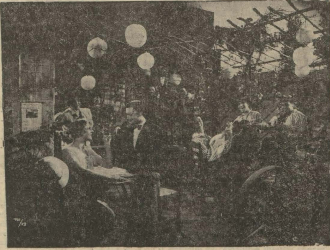
(Dünyayı dolaşan şarkı)

Oynayan: Maruf tenör Joseph Schmidt. Bu film doğrudan doğruya bir musiki filmidir. Meşhur tenör Schmidt tarafından baş rolü almış olan bu filmin en kuvvetli tarafı şüphesiz ses ve şarkıdır. Filmin mevzuu, bir fakir musiki -sinasın, tesadüfen girdiği radyo ista-