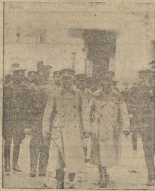
Misafirlerimiz erkânı harbiye akademisinden çıkıyorlar