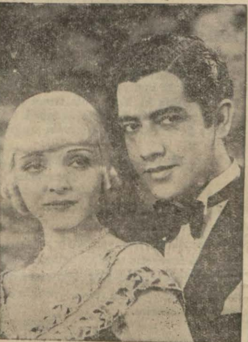
(Roma Ateşleri İçinde) filminin baş aktişi Claudette Colbert

duğunu bu filmde gösteriyor. Albert Préjean da ondan aşağı kalmamakta ve sahneleri büyük bir sühulet ve hiç