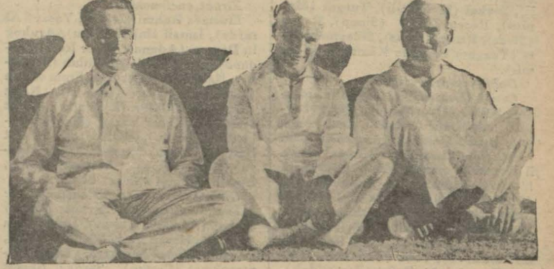
Soldan sağa doğru: Harold Lloyd, Şarlo, Duğlas Fairbanks