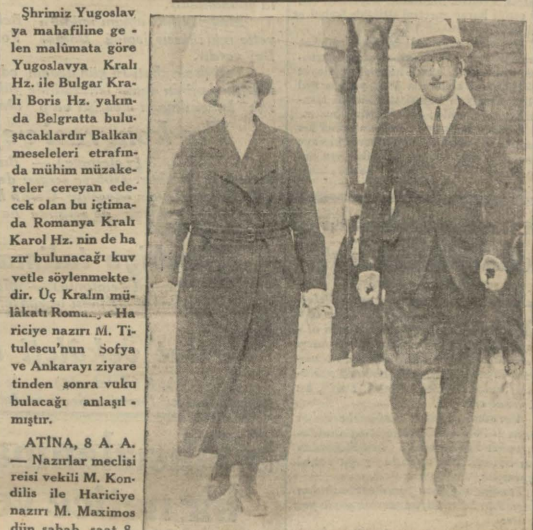
Kral ve Kraliçe Hazretleri'nin İstanbul'da alınan resimlerinden

M. Titulescu'nun Ankara ve Sofya ziyaretlerinden sonra bu toplanmanın yapılacağı bildiriliyor Atina ajansının mühim bir tebliği