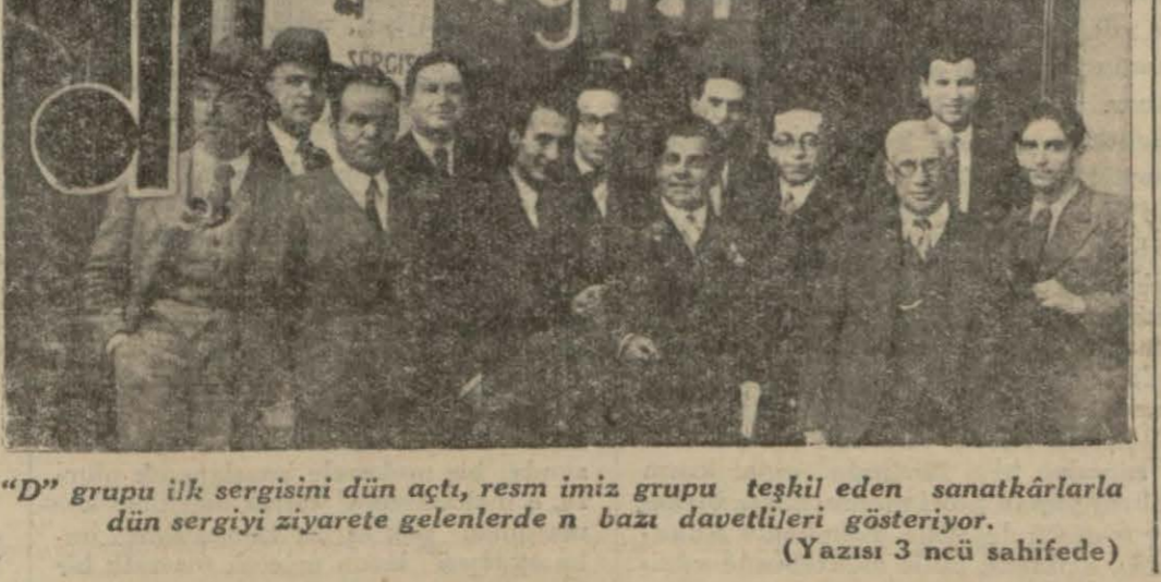
"D" grubu ilk sergisini dün açtı, resim imiz grubu teşkil eden sanatkarlarla dün sergiyi ziyarete gelenlerde n bazı davetlileri gösteriyor. (Yazısı 3 ncü sahifede)