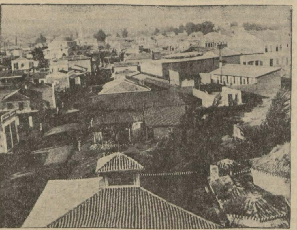
Turgutludan bir manzara

ret etmiş ve verdikleri paraların yerinde sarfedilmek suretile mü-kâfatlarını Cümhuriyet bayramında temiz sularına kavuşmak suretile görecektir. Gerek suyun ve gerek memleketi nura garkedecek olan ve tesatı yeniden yapılmakta olan elektrik tenviratının da resmîküşadı önümüzdeki büyük bayramımızda icra edilecektir. Cümhuriyet bayramının gayet parlak olması için komita reisi halk hükümetinin halkçı kaymakamı Feyyaz Beyefendi hummalı bir surette çalışmaktadır. 20000 bayrak ve 1000 fenere ihtiyacı olan şehrimizin bunların mübayaasında zarar görmemesi ve bu gibi müesseselerin ihtikar yapması için halkın menfaatini düşü-