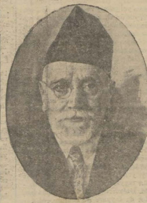
M. Venizelos'un en yeni bir resmi

— Yedi senelik bir ikametden sonra (Devamı 6 ıncı sahifede)