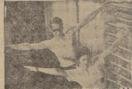
Gençleri. (409) 7697

Programı ilâve olarak perşembe günü 6,30 matinesile gece 9,30 daki seansta İstanbulda bulunan maruf sinema yıldızı (Lil Dagover) görünmüs ve halk tarafından alkışlanmıştır.