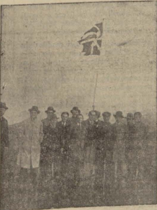
Gazete muhabirleri Rus kruvazörünün gövertesinde

Vali Bey bu akşam misafir kumandan ve zabıtlere bir ziyafet veriyor