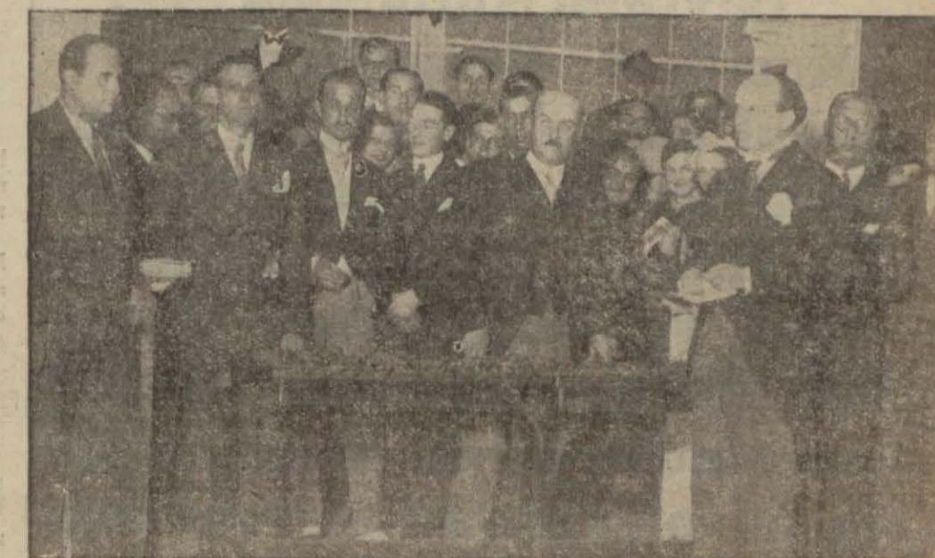
Dün Galatasaray klübünün yirmi zinci yıldönümü münasebetile Tokatliyanda bir çay ziyafeti verdi ldi ve madalyalar tevzi edildi.