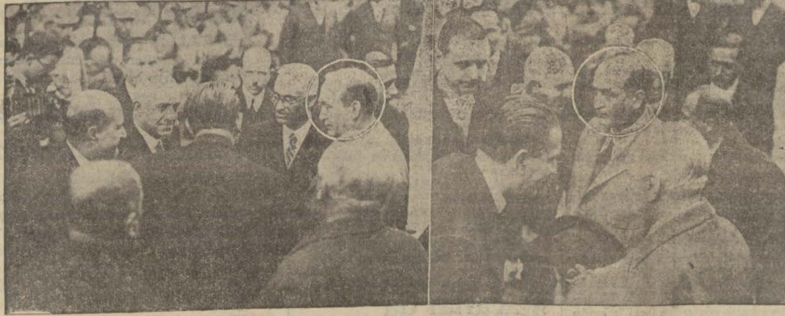
Macar Başvekilini ve nazırları dün sabah şehrimizde istikbal edilirken