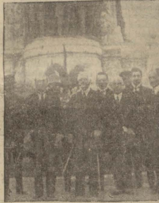
Macar Başvekilini abideye çelenk koyduktan sonra. Yanında Hariciye nazırı