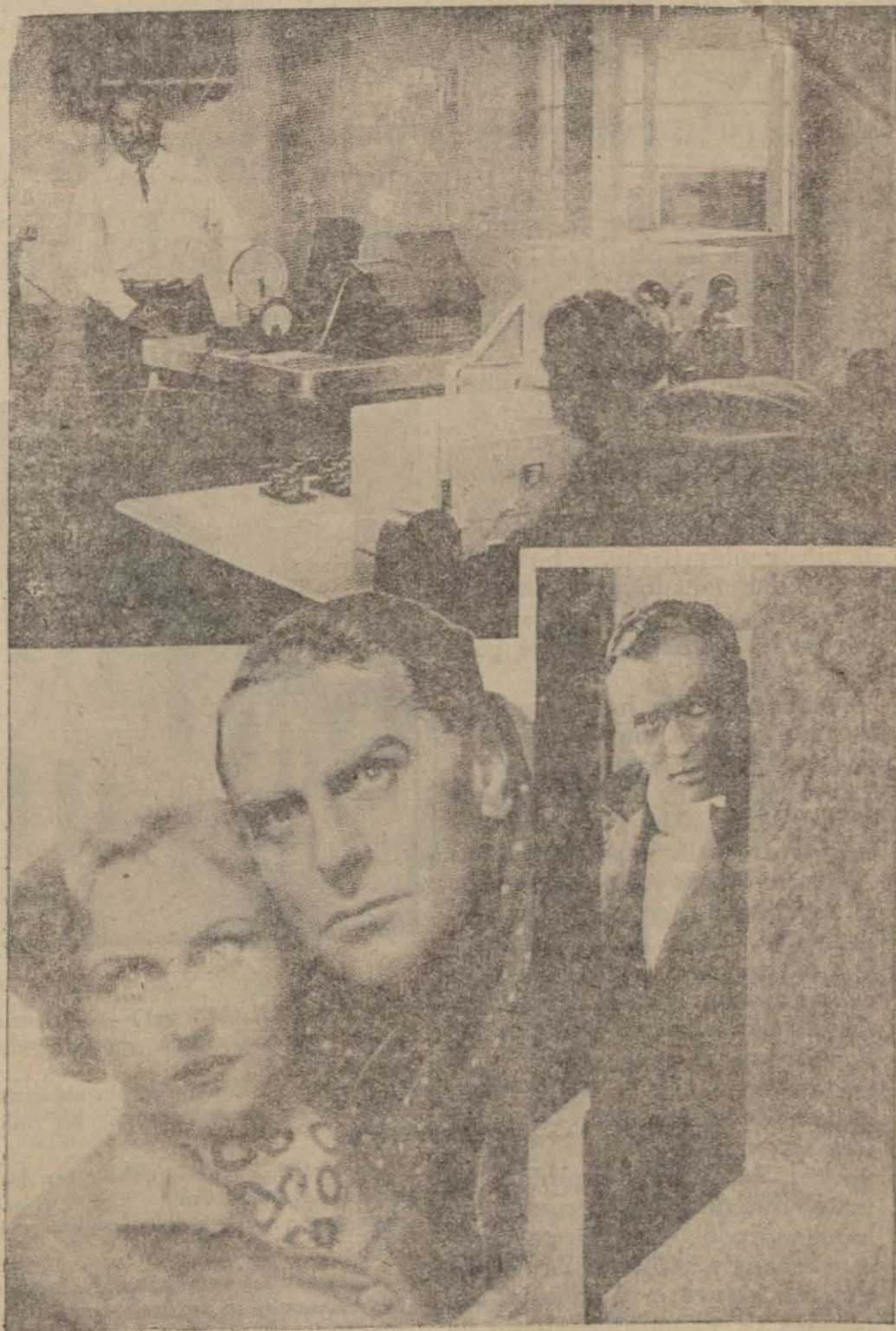
Çelikada filmind en birkaç sahne

gelecek bir terakki devrine ait olması da filme ayrıca bir kıymet vermektir. Bu muktazi bir mak. biraz gariptir. Bir