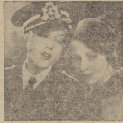
Baby filminde Anny Ondra

Komisyondaki nümunesiyale evsaf ve eşkalinde olmak üzere 250 adet Karyola 18-11-933 cumartesi günü saat 15 te aleni münakasa ile alınacaktır. Nümunesini göreceklarin her gün ve taliplerin belli saatinde teminatları ile Merkez Satılma Komisyonuna gelmeleri. (457) (5712)