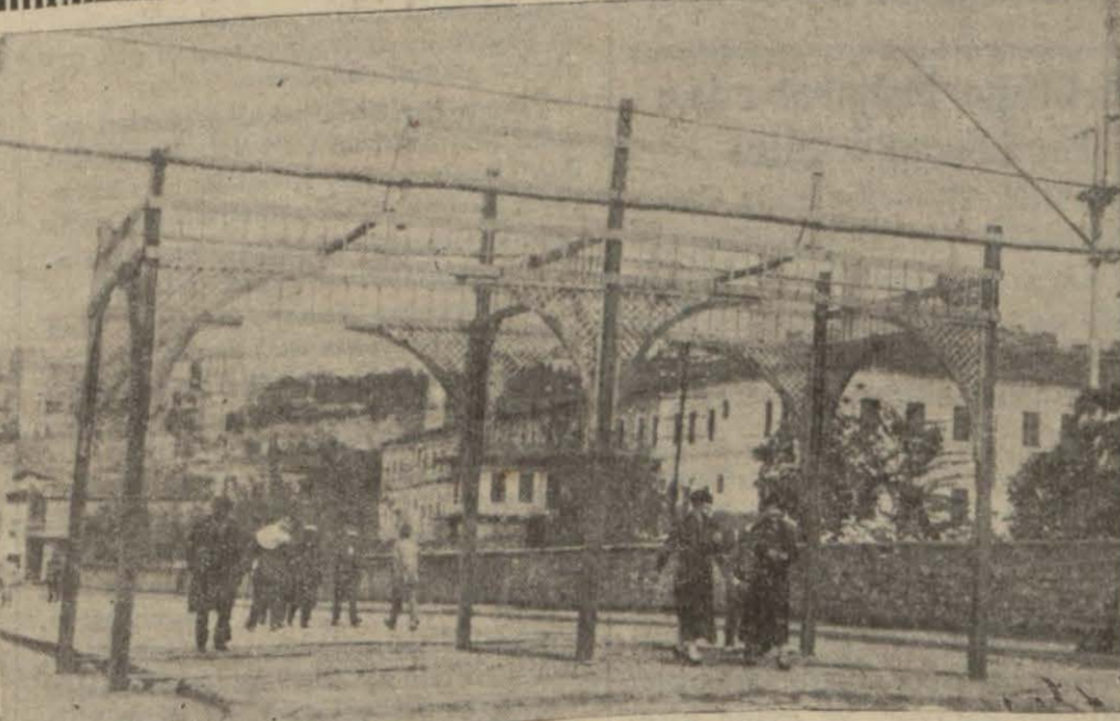
Kasımpaşada halk tarafından iki zarif ve büyük tak kuruluyor. Resmimiz bunlardan biri ni gösteriyor...