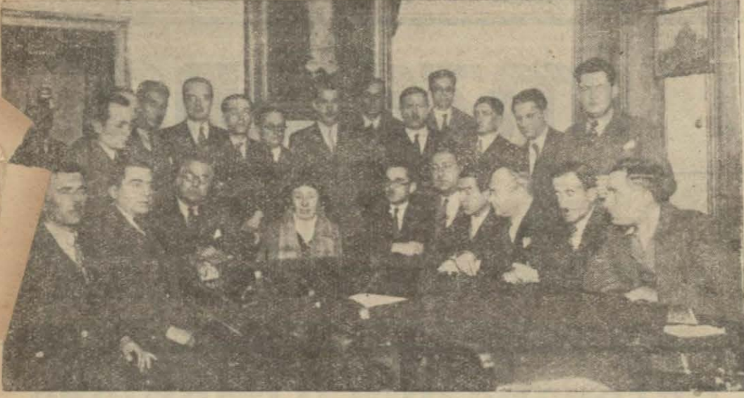
Matbuat Cemiyeti dün kongresini ve yeni intihabını yaptı. Resmimiz kongreye iştirak edenlerden bir grupu gösteriyor.

Yeni idare heyetine kimler seçildi ve neler görüşüldü?