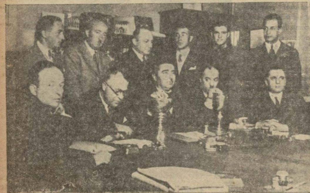
Türkiye futbol şampiyonluğu grup birincilikleri final müsabakaları vaziyetleri dün kur'a ile tesbit edildi. Resmimiz bu içtima gösteriyor. Yazısı spor sülûtlarımızdadır.

M. Titulescu tarafından Varşovadaki Sovyet sefirine verilmiş ve Romanya ile yapılmış olan muahedenin tasdik edilmiş nüshası bugün Moskova'ya ve aynı zamanda artık Polonya - Sovyet Rusya ve Romanya arasında katiyetle tabik girmiş olan ademi tecavüz misakının musaddak nüshaları beraber vasil olmuştur.