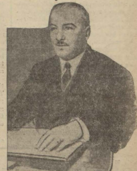
Alman hariciye nazırı Von Neurath