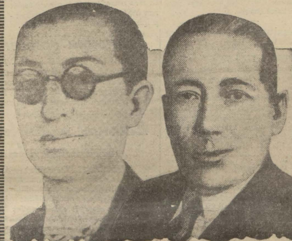
Hariciye Vekili Tevfik Rüştü Bey ve M. Titulescu

Dün Ankarada imza edilen Türk - Romen dostluk muahedesinin metni