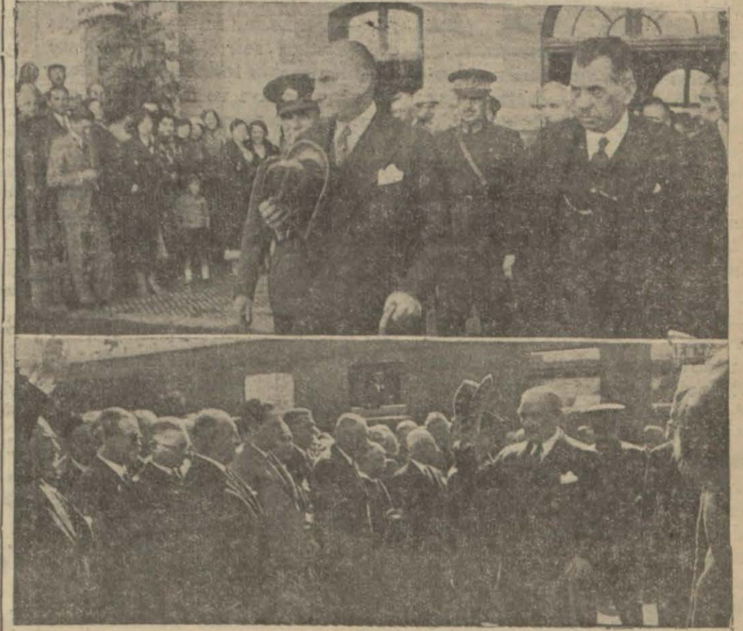
Gazi Hazretlerinin Ankara'ya avdetleri günü hususi fotoğraf muhabirimiz tarafından tesbit ettiği iki intiba...

Cumhuriyetinin onuncu yıldönümünü gününde çıkacak olan fevkalâde sayımız için ilân vermek isteyenlerin şimdiden müracaat emellerini ve geç gelecek ilânların o sayıya giremeyeceğini ilân ve müşterilerimizin dikkatine arz ederiz.