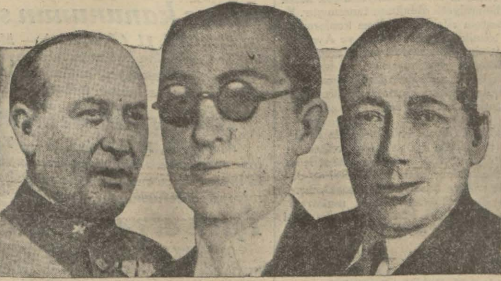
M. Gömbös, Tevfik Rüşti Bey, M. Titulescu