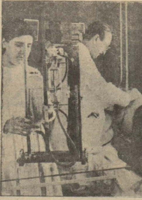
Dispanserde bir hastanın çiğerlerine hava verilirken