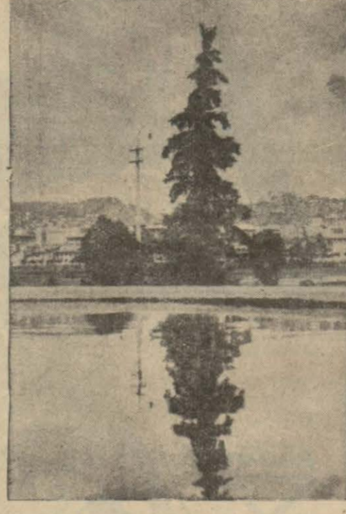
manzaralar haline gelmesi zamanı çok uzak değildir.

ANKARA: 7 (Milliyet) — Fotoğrafını gönderdiğim manzara Devlet Demiryolları idaresi binasının önündeki havuz ve oradan şehrin bir kısmının görünüşüdür. Ankaramızda bugün böyle güzel manzaralı köşecikler binlere baliğ olmaktadır. Bu gün şehrin muhtelif mevkilerinde müteferrik olarak bulunan bu manzaraların nihayet birbirine bitmesi ve yekpare, muazzam güzel