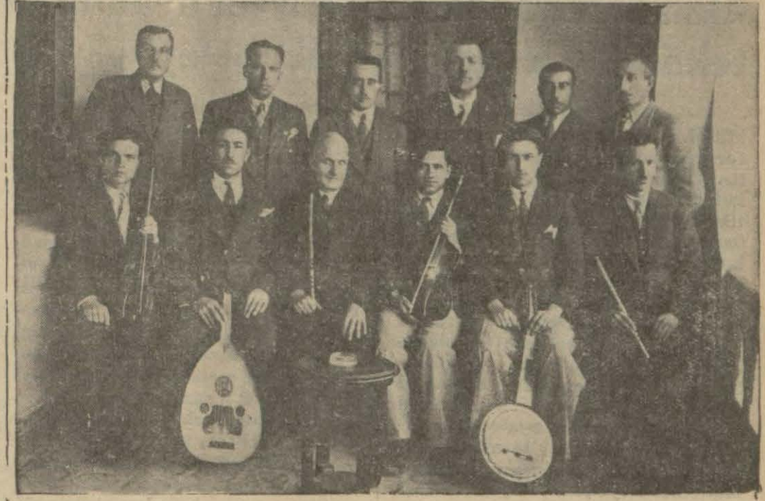
Afyonkarahisarda Halkevi çalışıyor.

AFYON, (Milliyet) — Afyon Halk Evi şuurulu ve verimli bir plân dahilinde sessize çalışmaktadır. Zengin ve muntazam bir kütüphanesi vardır. Günün her saat ve dakikasını muhakkak büyük salonda bir çok gençleri mütalea ile meşgul görürsünüz. Fransızca ve usulmuhasebe ve yeni ölçüler üzerinde açtığı kurslardan bir çok vatandaş istifade etmişlerdir. Afyon gençliği boş vakitlerinde hal-