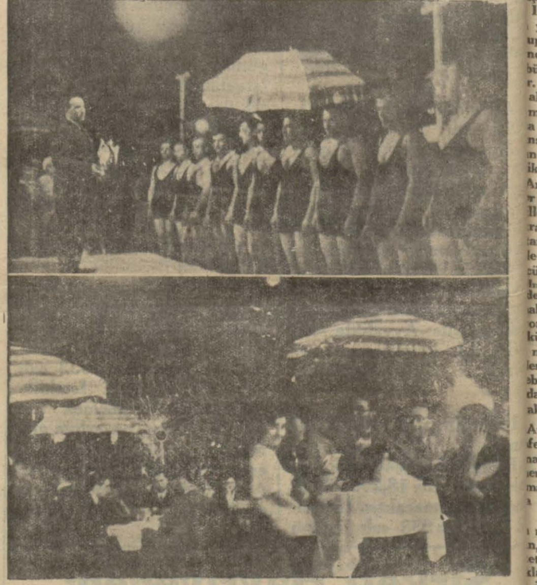
Ankara'da gardenparti esnasında fotoğraf mahabirimizin muvaffakıyla tesbit ettiği gece resimleri

Bundan sonra danslar başlandı. Dans müsabakasında hakem heyeti kararile Garden Partiyi iştirak eden kalabalık arasında ihtilâf çıktı ve hazirun hakem heyetinin kararına itiraz etti.