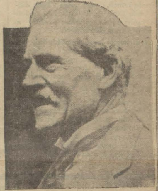
Mösyö Mac Donald'ın konferansın gidişine matezat bir resmi istediler. Bu da deniz nakliyatı va-

Londra cihan iktisat konferansı da üç gündür Briand'ın bahsettiği büyük buhranlardan birini geçiriyor. Gerçi komisyonlar mesailerine devam ediyor. Buğday komisyonu, cihan buğday istihsalını tahdit etmeğe çalışıyor. Şarap komisyonu fazla şarap istihsalını indirmek çarelerini arıyor. Yunanlılar buğday deniz nakliyatı komisyonunda vapurların azaltılması için dik-kate sayan bir teklifte bulundular: Muayyen bir yaşa gelmiş olan ticaret gemilerinin imhasını