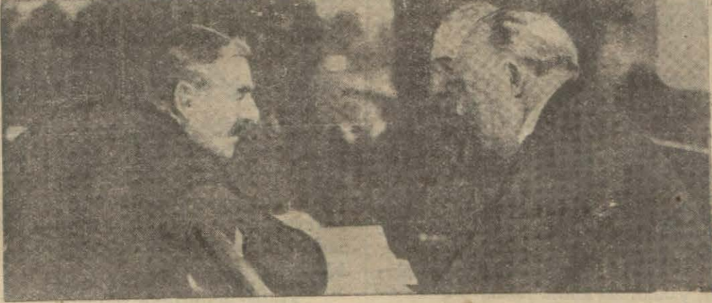
Mr. Chamberlain Kanada Başvekili ile görüşürken

mez. Fakat umulabilir. Konferansın sıhhatli karar vereceğinden emin olduğumu yazmak su-