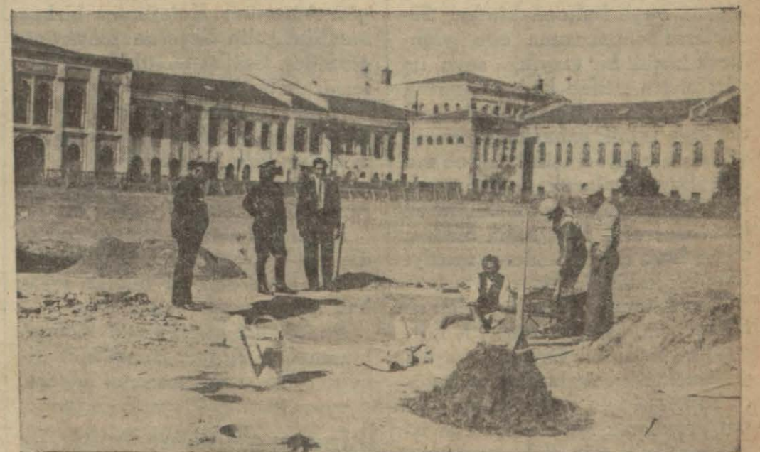
Bulgar suvari zabıtları ile suvari za bitlerimiz arasında cuma günü yapılacak manili at müsabakaları için Taksim stadyomu hazırlanıyor.

diğini yazdığımız M. Bradley dün sabah Turing ve Otomobil Klübü (Devamı 5 inci sahifede)