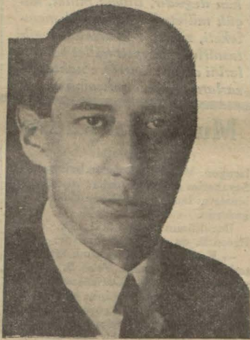
Lehistan Hariciye Nazırı M. Beck

PARIS, 4 A.A. — Oeuvre gazetesi, Türkiye Hariciye Vekili Tefrik Rüşti Beyin Paris'i ziyaretinden hemen sonra misakı herkesten evvel Türkiye'nin imzalamış olmasına dikkati çekmekte, Baltık denizinden Karadenize kadar uzayıp giden şarkı Avrupa'nın sulh ve süküne kavuşturulması içinde Fransız hariciye nezaretinin iştirak payını ehemmiyetle kaydetmektedir.