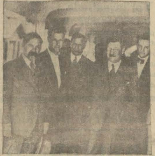
Moskovadan dönen heyet sefirimizle beraber

«Rusya'da, memleketimize gelen sanayi heyeti ve diğer refakatimize verilen mühendislerle birlikte bir çok fabrikaları gezdik. Uzun boylu tetkikat yaptık. Rusya'da heyetimize karşı gösterilen büyük misafirperverlikten dolayı derin surette mütehasşis bulunuyoruz. Kayseri'de yapılacak fabrikamız ana-