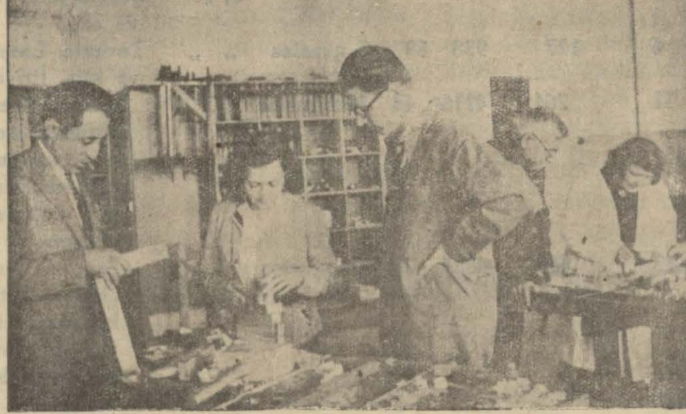
Gazi Terbiye Enstitüsünde fen bilgisi ve biyoloji kursuna iştirak eden ve kursta tahta işlerin de çalışan muallimler.