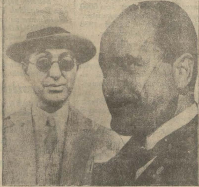
M. Mussolini ve Tefrik Rüşti B.

Görüşmenin hiç olmazsa kısmen, Sovyet Rusya, küçük itilaf ve Türkiye ademi tecavüz misakı hakkında yapıldığı zannediliyor. Dörtler misakı imzalandıktan sonra hemen gitmiş olduğu Moskova'dan dönen Sovyet sefirinin, Tefrik Rüşti Beyden birkaç saat evvel M. Musolini tarafından (Devamı 5 inci sahifede)