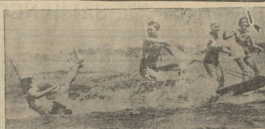
Deniz sporu bizde hâlâ başlamadı. Halbuki Avrupada bakın na- sıl eğleniyorlar.

Bu sene Türkiye birincilikleri Cüm- huriyet'in 10 uncu yıl dönümü olmas- ıyla Ankarada yapılacaktır. Yalnız yekken birincilikleri İzmir- de yapılacaktır.