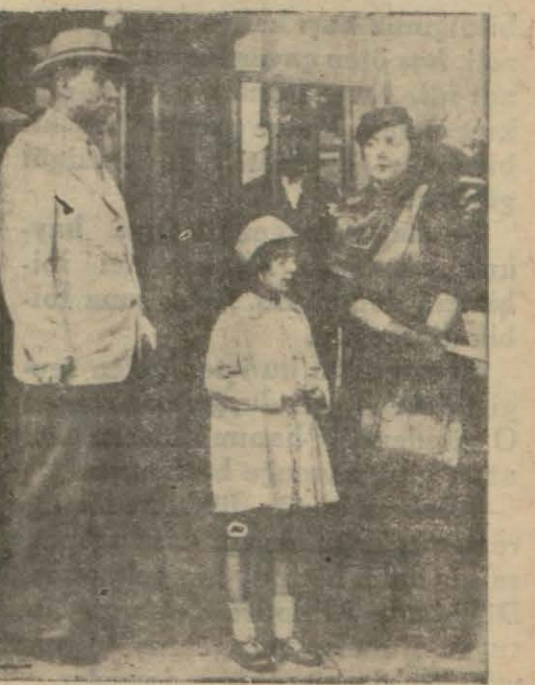
Berlin Seyfirimizin dün ailesi birlikte aldığımız resmi

Almanyada Yahudilerin dövüldüğü doğru değildir, fakat taziyek edilmiş ve işlerinden çıkarılmış Yahudiler bulunabilmektedir.