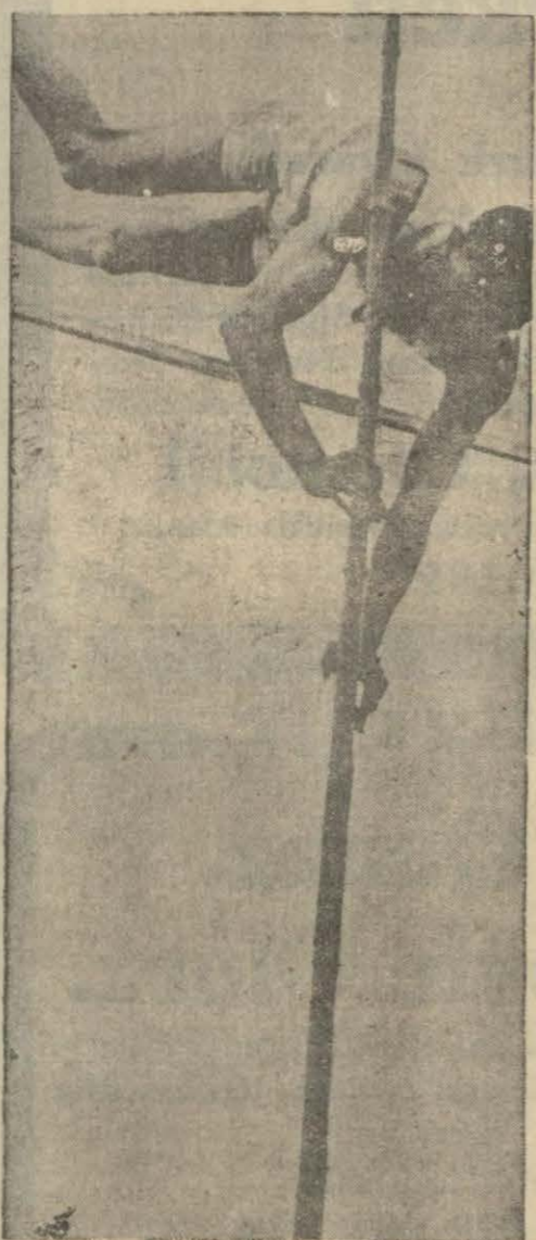
Atletizmin en zor kısımlarından bir- i de sırtla atlama müsabakasıdır. Burada Fransız şampiyonunun bir atlayışı gözüküyor.