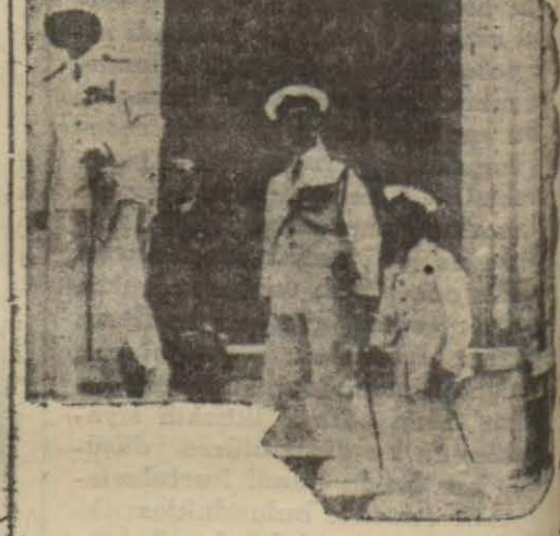
Gemi süvarisi valiyi ziyarete gelirken

Aris, bundan beş sene evvel Fransanın Saint - Nazaire tezgâhlarında yapılmış güzel bir gemidir. 1895 ton bağındır, silâhları zabıt namzetlerini yetiştirmeğe yarayacak bir surette tertip edilmiştir. Gemi yeniköy olup bir muavin motorü vardır. Aris'in mürettebatı zabıt, zabıt namzedi, talebe tayyareci ve bahriye efradı olmak üzere 300 kişidir. Aris şimdiye kadar bir kaç seyahat