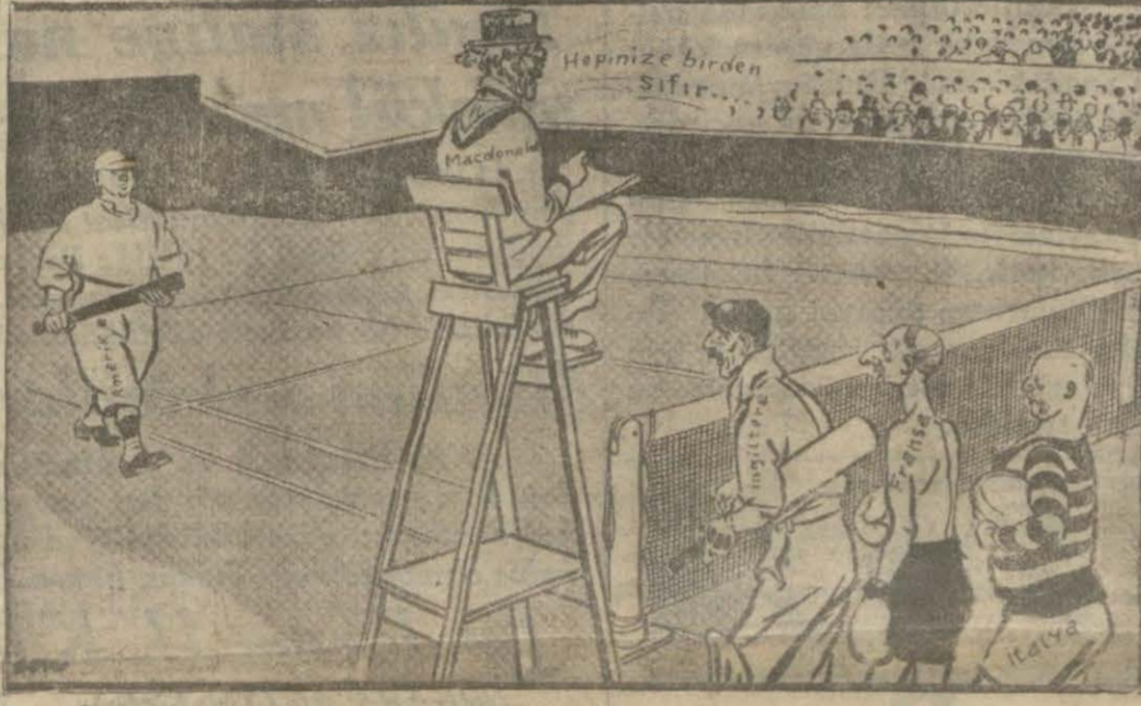
Bir ecnebi gazetesinin Londra konferansını görüş ve ifadesi: Sifira sifir elde var sifir.

Dün bir karar verilemedi. Riyaset divanı bugün de toplanacaktır