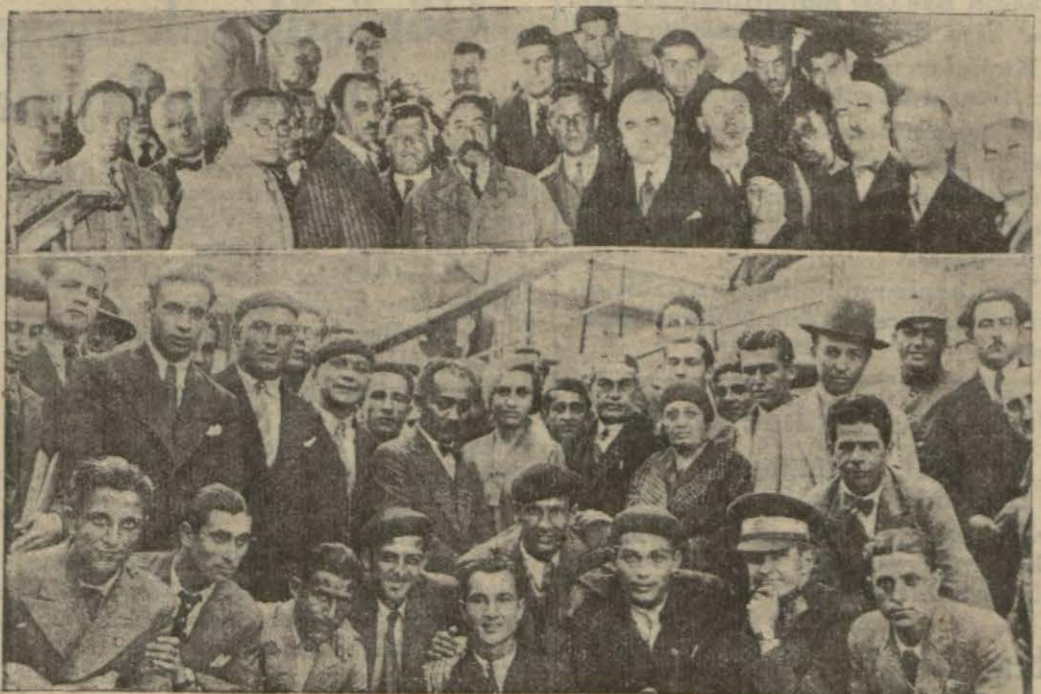
Rusyada Rus sporcuları ile temaslara yapacak olan güreşçilerimiz futbol takımı ile atlet heyeti dün hareket etti. — Yazısı iç sayfamızdadır —

mecburiyetindedirler. Bu itibarla ki Londra mukavelesi, bir kaç devlet arasında bir takım mütakabil taahhütleri istilzam eden hususi mukavele olmaktan çıkıyor da Cenevrede bütün