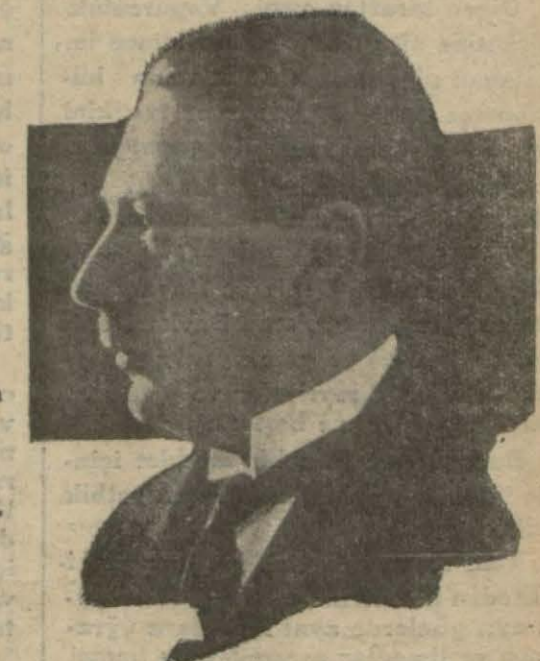
Maarif Vekili Dr. Reşit Galip B.

Ecnebi profesörlerle üçer sene müddetle mukavele yapılmıştır.