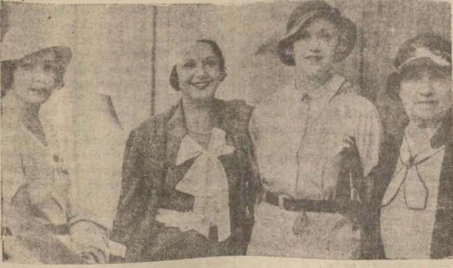
Sağdan sola doğru anneleri Madam Contance Talmadge, Norma ve Nathalie Talmadge

İşte size üç kız kardeş Talmadge'ler. Bunlar üçü de kocalarından boşanmış ve eylevm duldurlar..