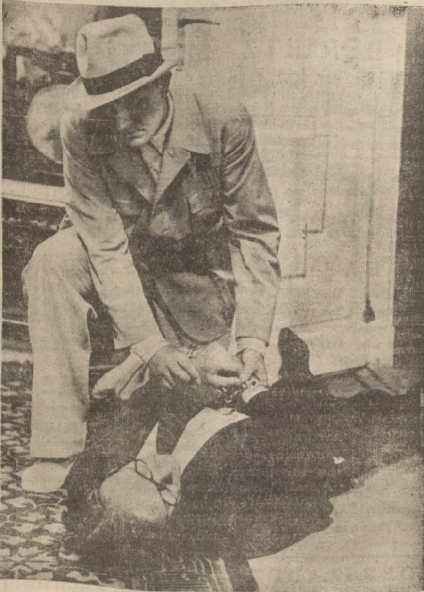
"Gizli teşkilât, filminden bir sahne"