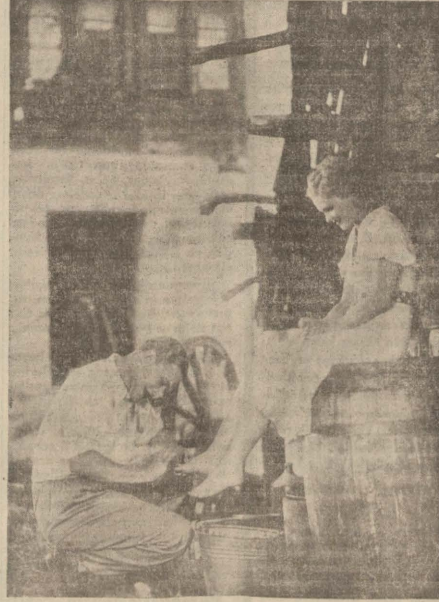
"Kim olduğunu bilmek istemiyorum," filminden bir sahne

Opera: Gizli teşkilât. Alemdar: İki yüzlü adam ve ayrıca Kongorilla.