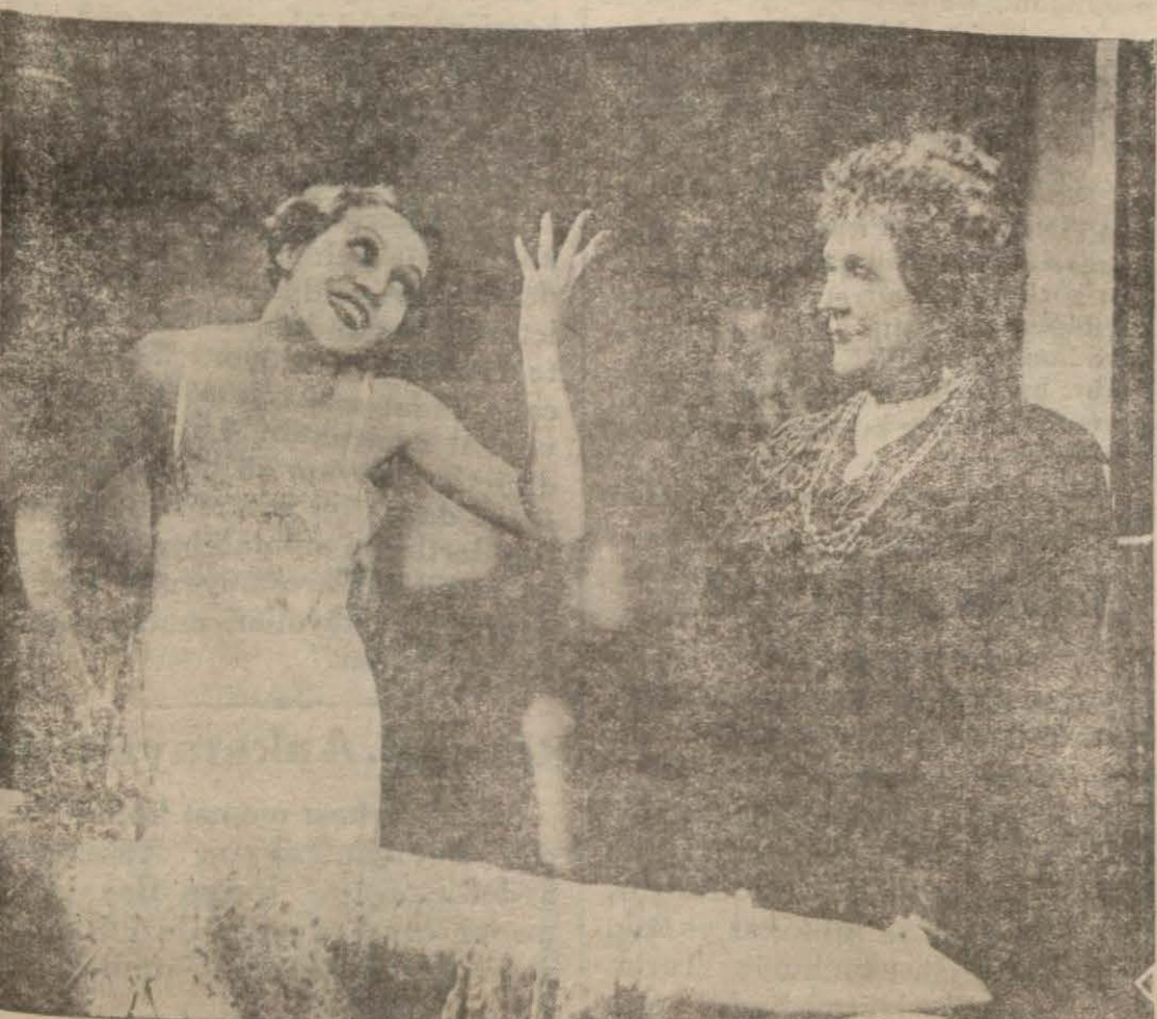
"Gündüz benim, Gece senin,, filminden bir sahne

İrma, Jerom'u romancı kadın ile görmüştür. Jerom Mariz ile evli olduğunu fakat uykuda gezdiği için ayrılacağını söyler. Müteessir olan Mariz, Andre'ye bir iftirak mektubu yazar. Mariz bir müessesede son "Hakiki roman" ından bahsederken Jerom İrma'yı kendisinin aktör olduğunu söyler. Şimdi evleneceklerdir. Ve Mariz ile Andre evleneceklerdir. Zira, romana, bu kadar canlı vak'alarından sonra güzel bir bitiş vermek lâzımdır.