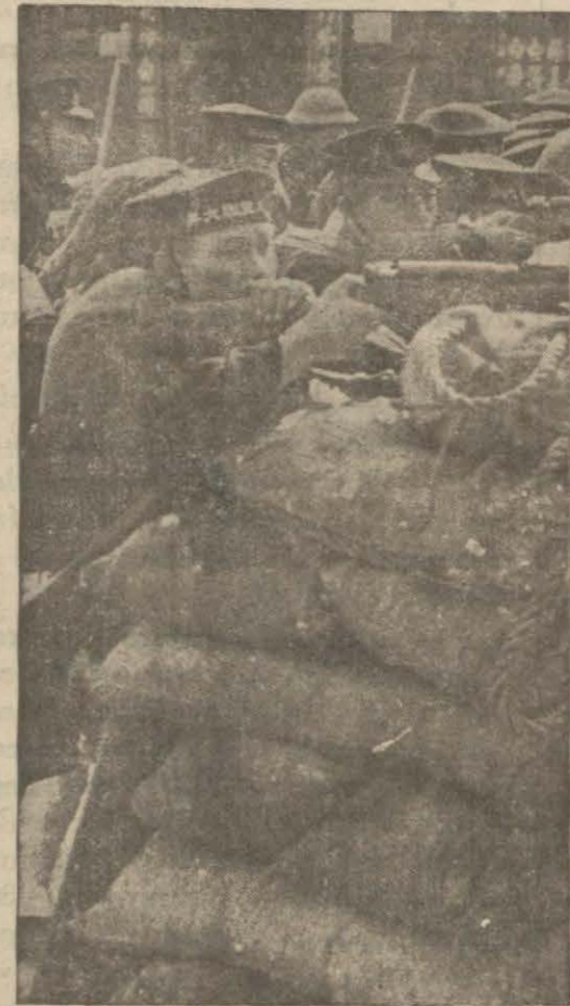
Çin şehirlerinde geçen muharebelerde Japon askerleri

Salı akşamı başlayan Japon taarruzu böyle bir mukavemet görecek