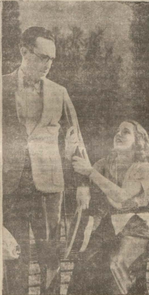
"Lul sinemacı,, filminden bir sahne

Operanın göstermekte olduğu film mevzuu şudur: Tim ve Pinki, tehlikeli dalgalık san'atini kendilerine meslek itihaz etmiş biri birinden ayrılmaz