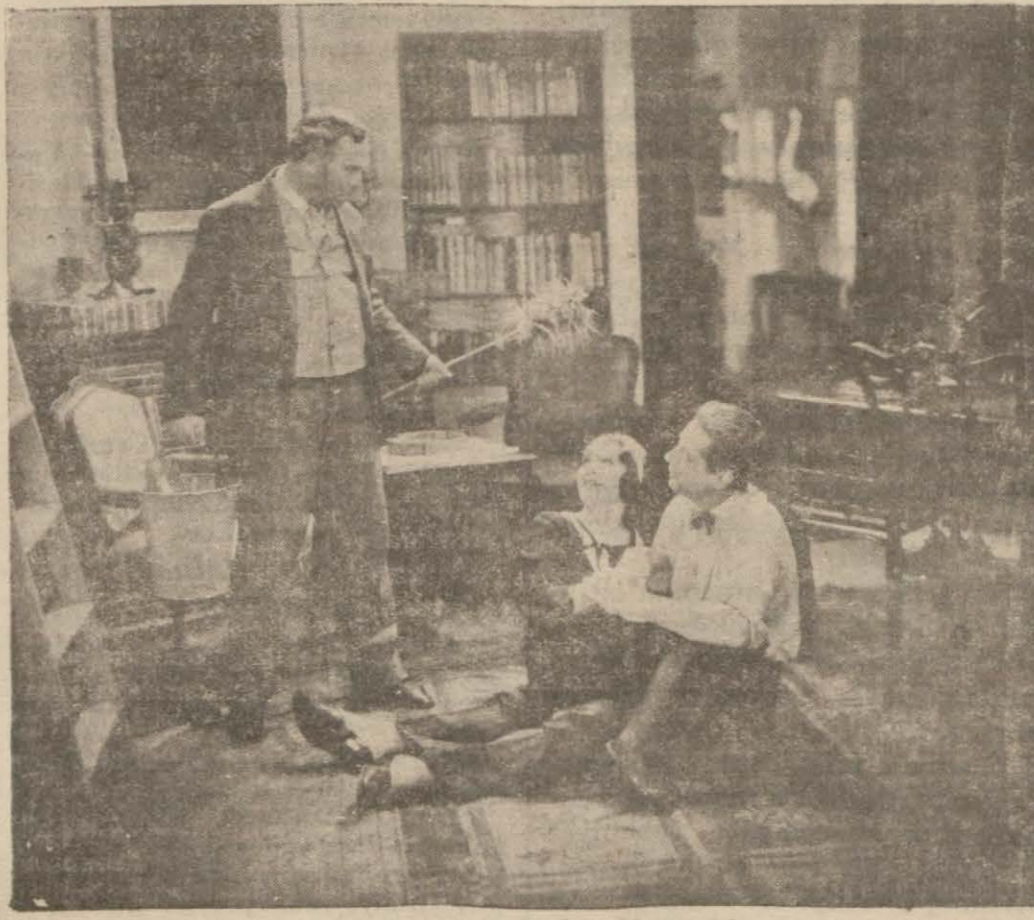
"Paprika,, filminden bir sahne

Tim karaya çıkar çıkmaz, eğlenmek üzere kendini bir bara atar. Orada güzel bir kızla tanışır. Ve geceyi birlikte geçirirler. Bu