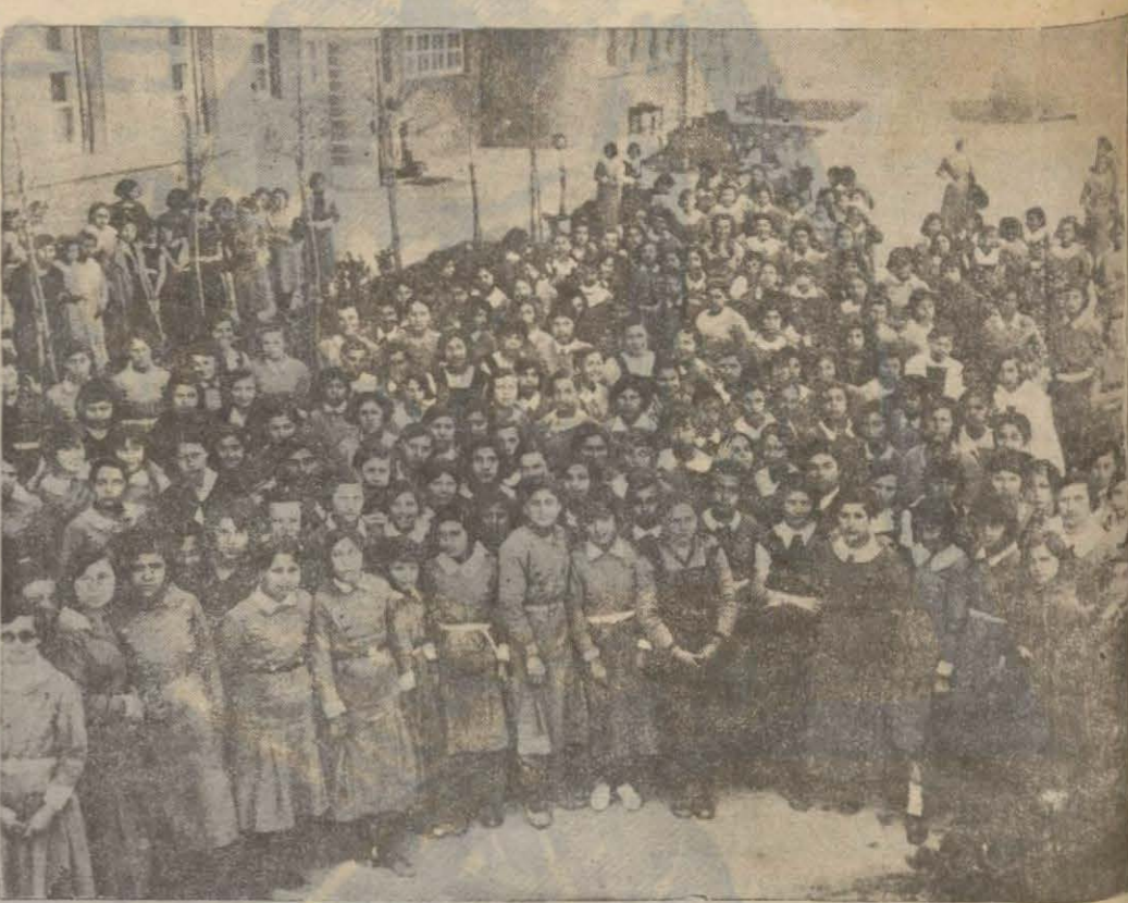
İsmet Paşa Kız Enstitüsü talebesinden bir grup