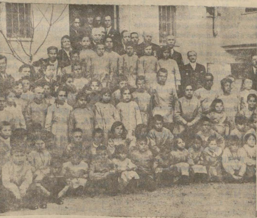
Dün Şişli nahiyesinde giydirilen şehit kız ve erkek çocukları.

yalnız o şube, ve tahakkuk şube teşkilâtı olmayan yerlerde kaza varidat idaresi, hududunun mükelleflerinin her senelik vergileri bu vergiler karşı tediyat ettikleri mebalîğ yazılacaktır. Vergi karnesi almış olan mükellefler tediyeleri bu karnelerde yazılı kayıtlarla da tevşik edecektir. Bu karneler beş senelik olacaktır. Şekli ve doldurma sureti Maliyece tayin olunacaktır. Karneler mal sandıklarından 50 kuruşa satılacak ve üzerinde yürünülecek kayıtlar damga resminden muaf olacaktır. Kanun neşri tarihinden dört ay sonra muteber olacaktır.