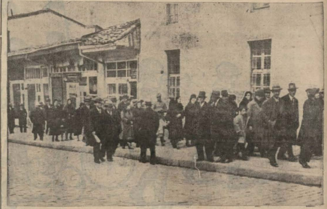
Kim der ki burası Hükümet Merkezinin ana caddesinden bir manzardır.