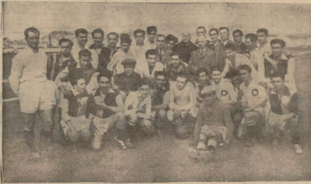
Ankarada Editör - Ankara üçü maç intibalarından.