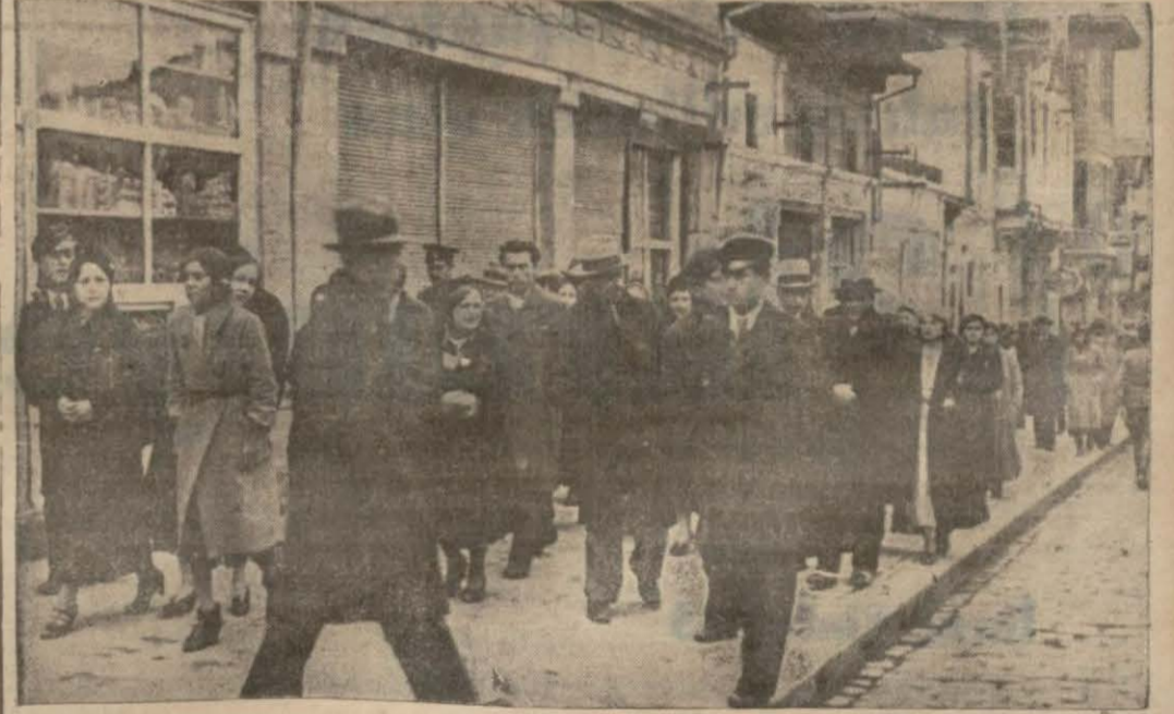
Bu da aynı caddeden bir hasin manzara!

Buraları şehrin methalidir. Amudu fikirleridir. Buraların vereceği fena intibalar yanında, şehrin diğer kısımlarında sarfedilen emeklerden doğan ümran ve intizam kaybolup gidiyor. İnce zevkine emin olduğumuz, Belediye Reisimiz Nevzat Beyden, — belediye fakir de olsa — onun enerjisine güvenerek Ankara ve Ankaralılar bunu istiyor!