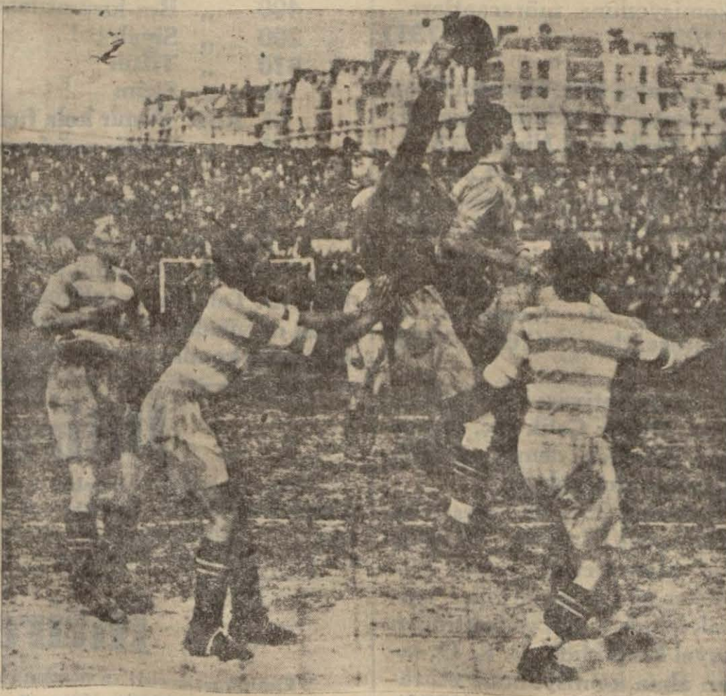
Fransa kupası dömi finali oynanırken Roubaix takımı kalesi sıkışmış vaziyette

Bir hafta evvel şehrimizde üç maç yapan Macar Boçkay takımı Almanyada yaptığı ilk maçta Lanprig karışık takımını 2-6 gibi çok mühim bir farkla mağlup etmiştir. Bu netice karşısında Türk futbolu namına memnun olmamak gayri kabildir.