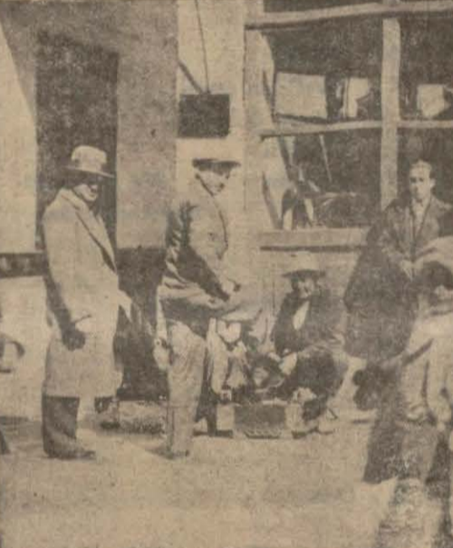
Ankarada bir cuma günü: Kapalı boyacı salonu önünde ayakta bekleyen boyacılar..

ANKARA, 19 (Telefonla) — Belediyenin seyfar satışları hakkında bazı tedbirler aldığını bildirmiştim. Bu tedbirler ilân edilmiştir. 25 nisanda tatbikına geçilecektir. Yeni vaziyete göre, seyfar satıcılar belediyeden behemahal ayrık ruhsatiye ve ateş girmeden yenecek mevât satanlar da sıhhat cüzdanı almaya mecbur tutulmuşlardır. Her ayın onuncu gününe kadar harcı yatıran izin almayanlardan ayın onuncu gününden itibaren bir misli fazla harç alınacaktır. Aynı karara göre de, ana caddelerin manzarasını çirkinleştiren kundura boyacıları da bu caddelerde durmaktan menedileceklerdir. Bu münasebetle Şehirde addedi zaten mahdud olan boyacı salonlarının cumaları açık kalabilmeleri için belediyenin bir karar vermesini temenni ederiz. Bu suretle cuma günleri Ankaralıların ara sokaklarında boyacı aramak derdinden kurtulmuş olacaklardır.