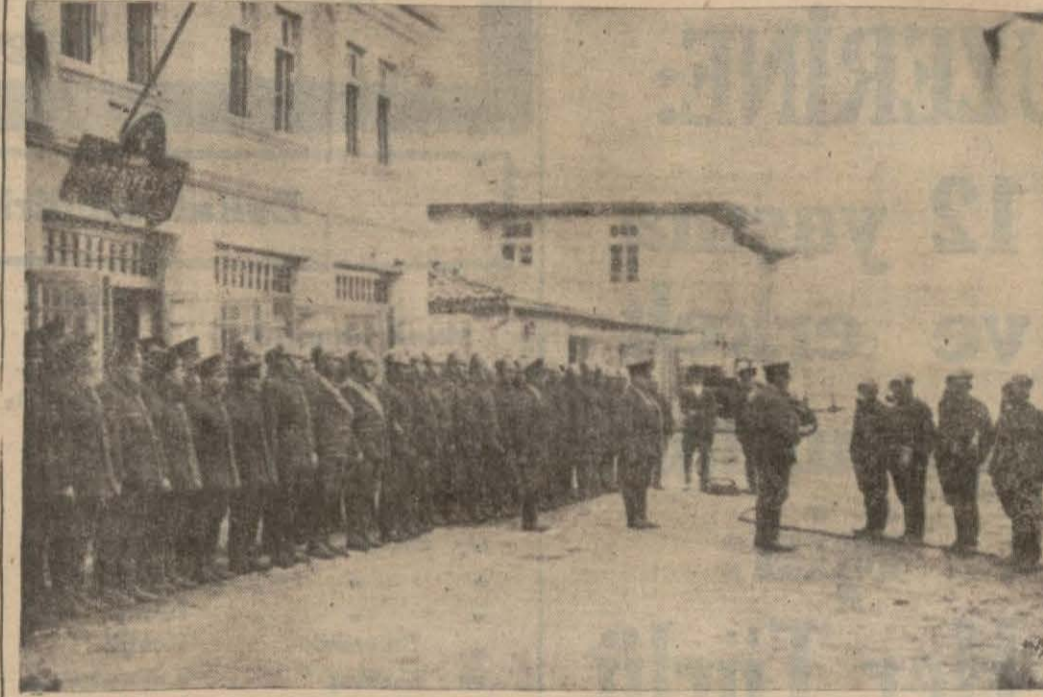
İtfaiye kıtaatı talim yapıyor..

ANKARA, 19 (Milliyet) — Ankara sahifemiz için, Ankaralıların alâkadar edecek mevzularını seçerken, ehemmiyet verdiklerimiz içinde itfaiyemiz de vardı. Şura ona geldi.