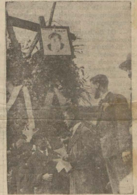
Sinan türbesine konan çelenkler

"Sinanın mezarı ölündeyiz. Hayır, biz bir mezar önünde değil, bir milletin eserleriyle sonsuz çağlara doğru hep parlayacak olan dehası ölündeyiz. Geçmişte Sinan ve Sinan gibi adları bilinen ve bilinmeyen bir çoklarını yetiştiren bu Türk milleti gelecekte de yeryüzünde insanlık ve bilgi yol göstericisi soylar yetiştirecektir. Bi-