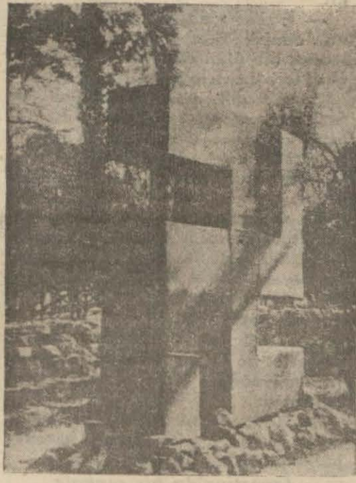
Solda Alman Yahudilerinin bir neyulâ gibi seyrettikleri bahçeye konulmuş gamalı haç, aşağıda şehrimizdeki Hitlercilerin toplandırları söylenen Tötönya klübü...