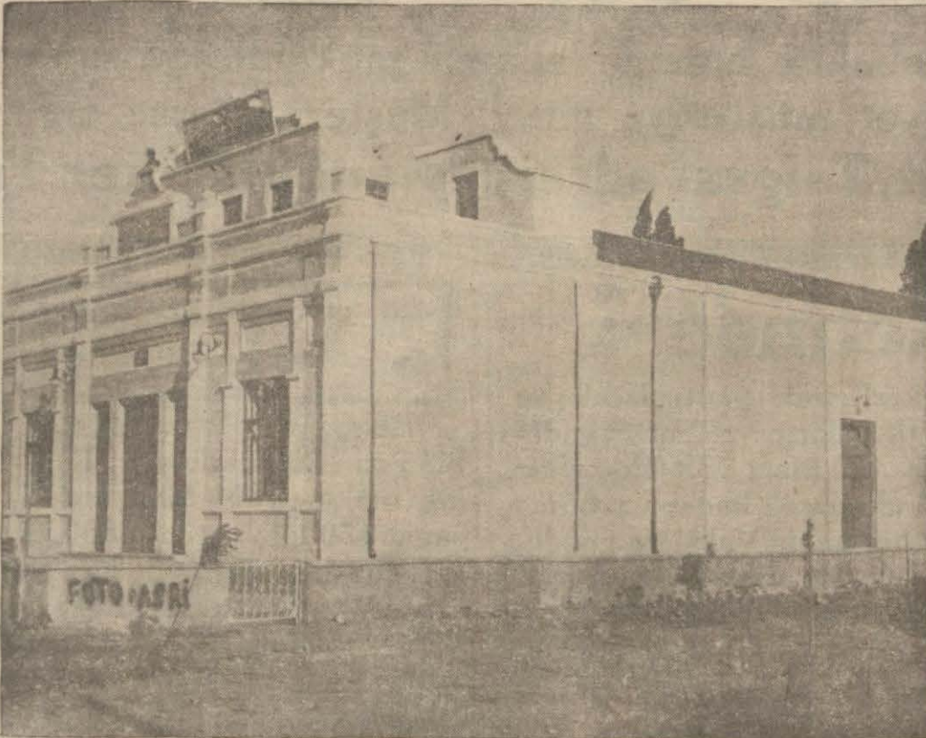
Akhisarda Tayyare sineması

Maarif faaliyetlerinde canlılık var - Yeni yollar yapıyor