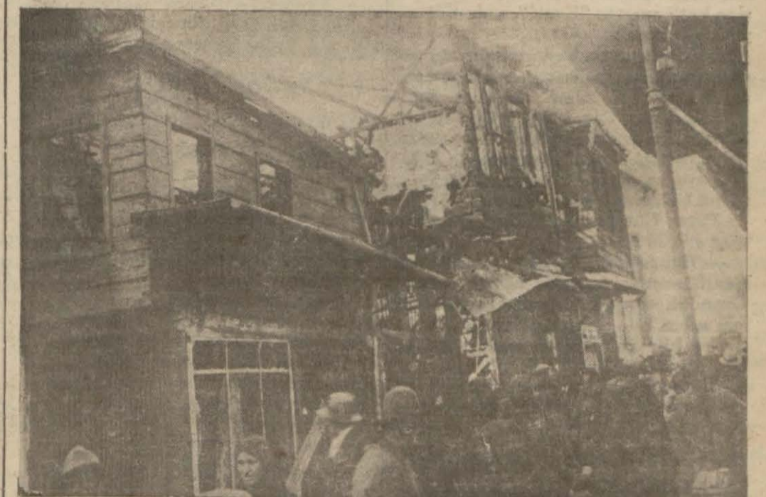
Dün Gedikpaşada yanan ev ve dükkânlar..