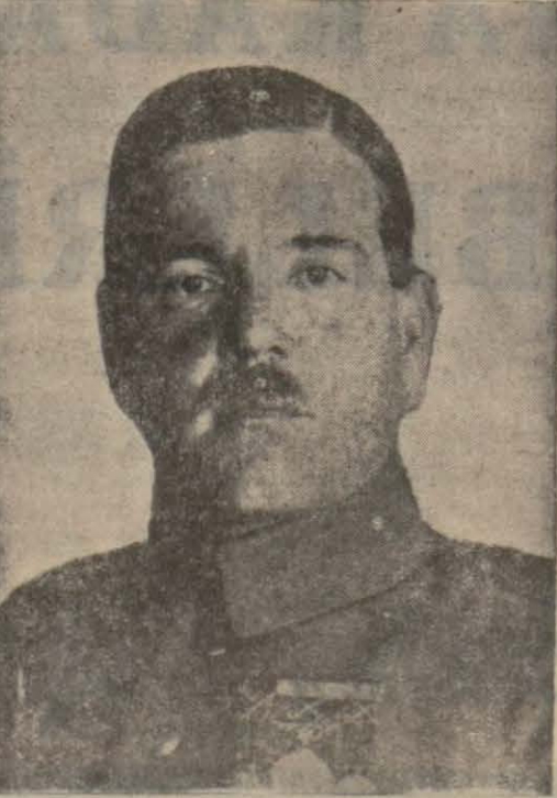
Ali Fuat Paşa

— "Kuvvet seyyare ne bir fırka, ne de muntazam bir kuvvet haline ifrağ edilemez. Bu serserilerin başına ne bir zabıt, ne de hesap