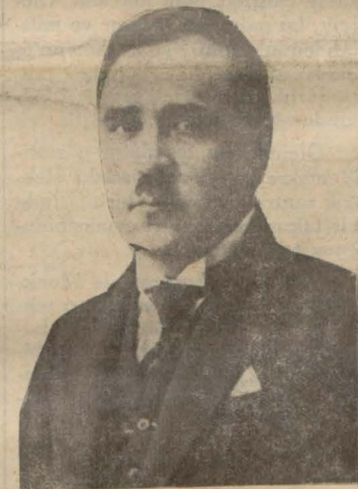
Maliye müsteşarı Ali Rıza Bey

"Ergani istikrazının dört milyon liralık ilk taksidine ait kayıt muamelesi bir ay zarfında kapanacaktır. Halkın bu istikrazı karşı alâkasının günden güne arttığı görülmektedir. Esasen Ergani tahvillâtı her türlü verilerden muaf tutulduğu için bugün de, yarın da hâmilleri için emin ve kârli bir iştir. Şayanı kayıt olan bir nokta da bu tahviller' teminat akçesi ve emlak alm satımında para gibi tediyebileceğidir. Bu hususiyet Ergani tahvillerine diğer eshamdan yüksek bir kıymet vermektedir. Bu, elbette bu tahvillâtın satın alındıkları kıymetini daha yüksek bir kıymet kazanması mucip olacak ve buna hiç şüphesiz hükümet te müzaheret edecektir. Ergani tahvillerinin, kıymetlerinden aşağı düşmesine katıyen ihtimal yoktur. İş Bankası, halkta taksitle tahvillât satın almak için kredi açmakla çok faydalı bir hareket yapmıştır; kendisine müteşekkirdir. Bu hareketi Osmanlı Bankası, Döğçe ve Döğçe Oryant Bank ta takibi muvafık görmüşlerdir. Birçok diğer mall müesseselerin bunu takip edeceklerine şüphesiz emiyoruz. Ergani hattının inşasına bu sene başlanacak; işçiler için yeni bir iş sahası açılacaktır. Ergani madeni işletmeye başladığı anda, bakır, ihracatı memleketle mühim bir servetin girmesini mucip olacak ve milyon larca tonluk nakliyat deniz ticaret