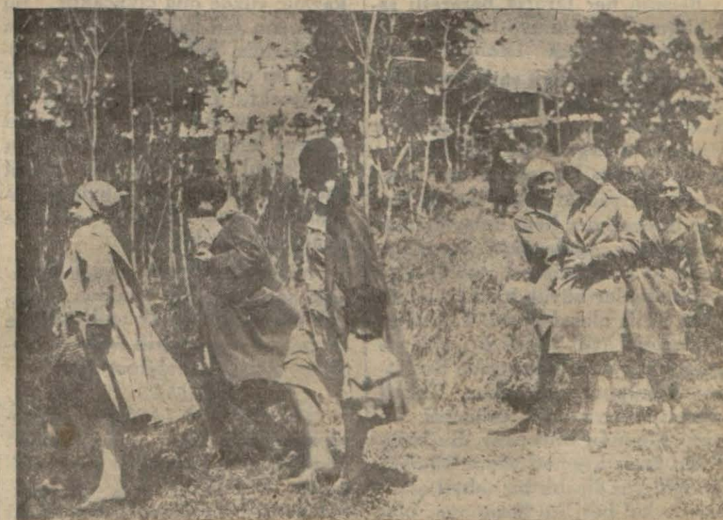
Paskalya iyi güne rast geldi ve dün kırlar gezenlerle doldu