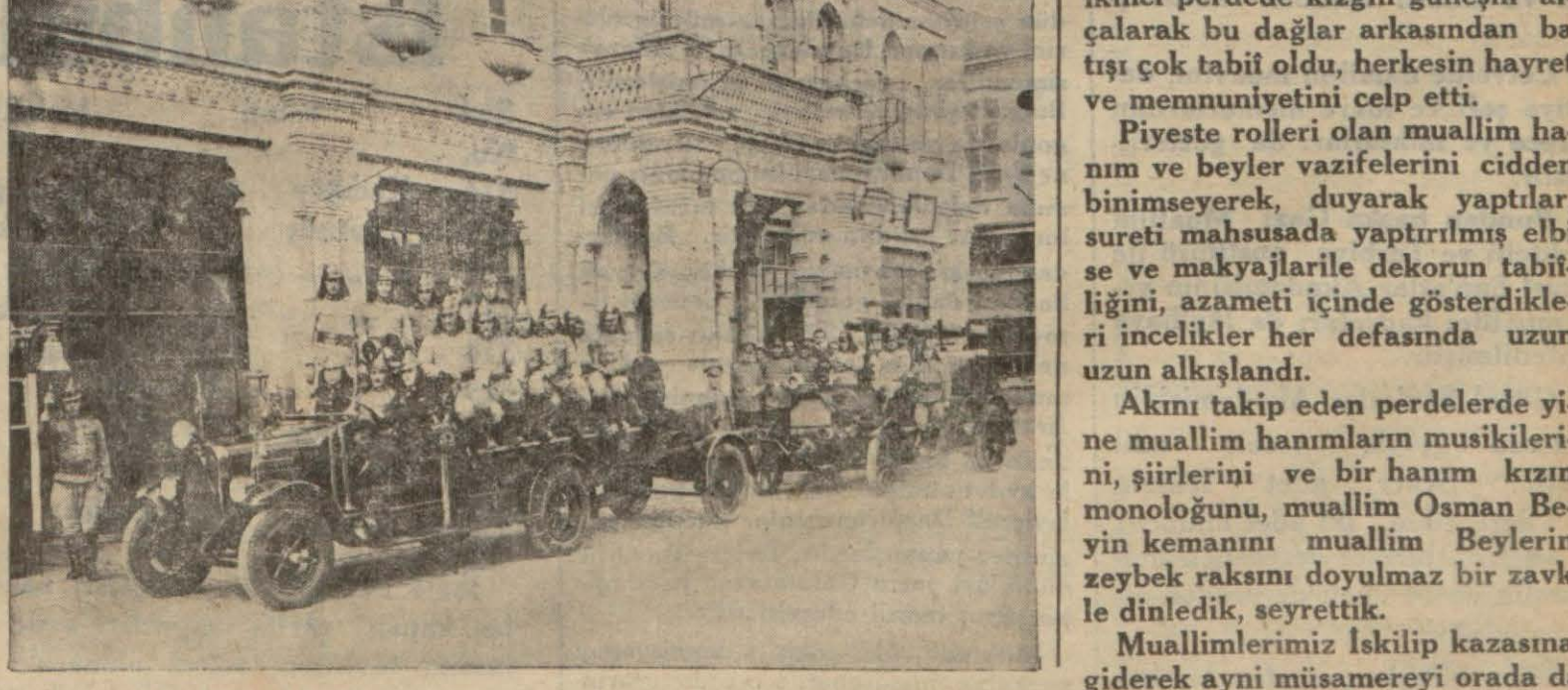
Samsunun muntazam teşkilâtı itfaiyesi

Çiçki ziraat aletlerini yapmak için lâzım olan keresteyi ve mahrukât ihtiyacını "Kurudağ" ormanından temin eder.