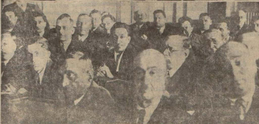
Yukarıda: Bulgar sefiri Reiscümhur Hz. ine itimatnamesini takdim ediyor. Aşağıda: Gümrük komisyoncuları birliğinin dünkü toplantısı..