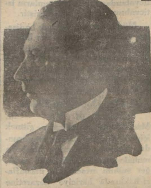
Maarif Vekili Reşit Galip Bey

ANKARA, 16 (Telefonla) — Maarif Vekâleti merkez teşkilâtı ve vazifeleri hakkında bir kanun lâyihası ile maarif müdür ve muavinleri ile liseler ve muallim mektepleri ve orta mektepler kad