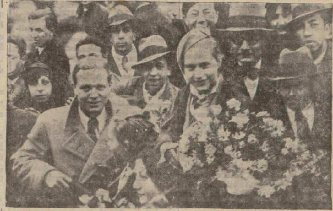
Gustave Frölich refikasile beraber Sirkeci'de istikbâl ediliyor