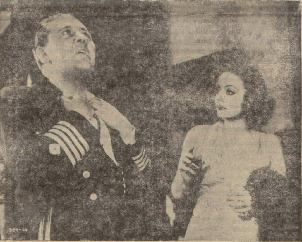
Şeytan ve Uçurum filminden bir sahne

İstanbul ilk defa olarak Meksikalı bir muğanniye dinlemekten derin bir haz duymuştur. Belki yol uğrağı olmadı için, bizler sık sık böyle sinema artistlerini karşımızda görüp dinlemiyoruz. Sonra itiraf etmeli ki, yüksek şöretlerin acayip bir sihri var, bu sihre tutulanlar da evvelki gece geniş geniş tatmin edildiler.