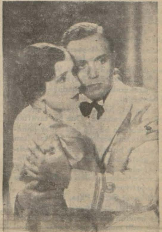
Gustave Frölich'in "Boğaziçi şarkısı" filminden bir sahne

Artistler dün şehri gezmişler ve alacakları manzaraları tetkik etmişlerdir. Alınacak manzaralar şunlardır: Karaköy köprüsü, Sultan Ahmet Meydanı, Galata kulesi (Devamı 6 ncı sahifede)