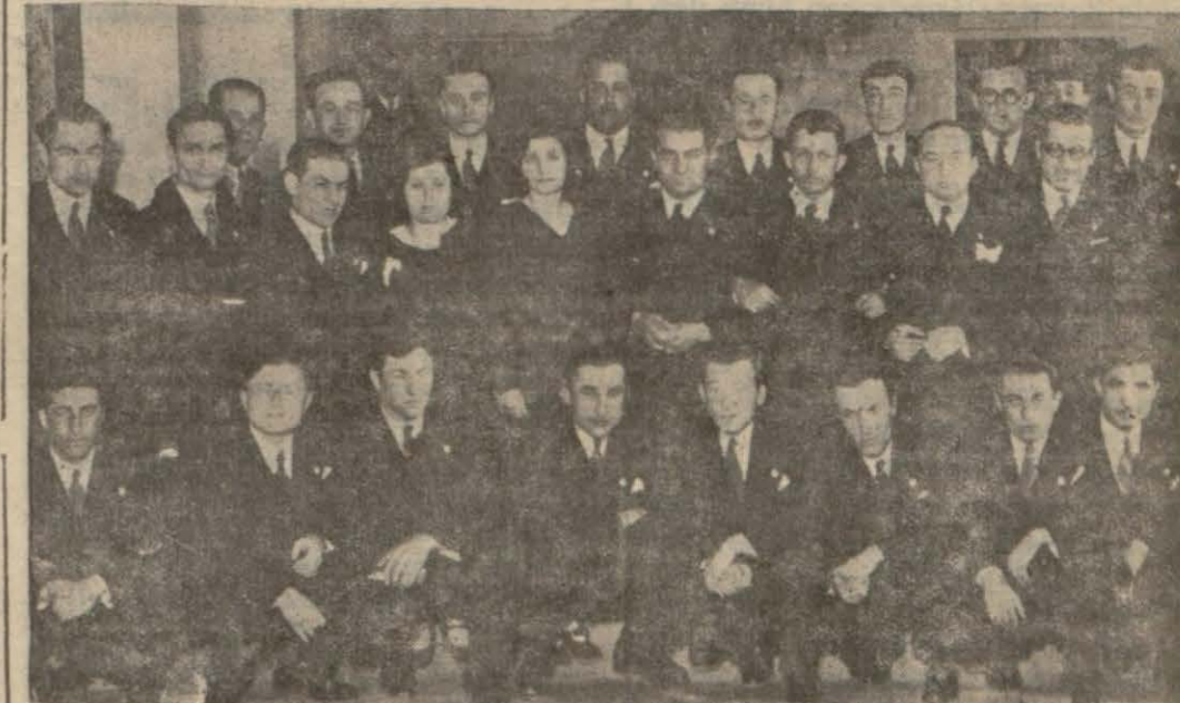
Mühendis Mektebini bitiren ve diplomalarını alan gençler ilk kadın iki hanım mühendisle beraber...