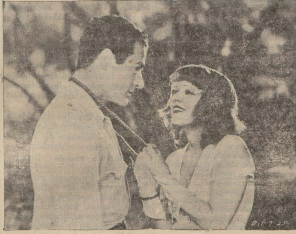
(Çılgın Kız) filminden bir sahne

Oynayan: (Pola Negri). (Pola Negri)'nin geçen hafta başlıyan bu filmi bu hafta da devam edecektir.