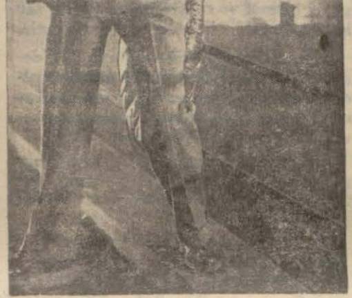
(Beyaz Şeytan) Eroin filminde Jean Murat

Oynayan: (Pola Negri). (Pola Negri)'nin geçen hafta başlıyan bu filmi bu hafta da devam edecektir.