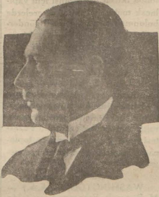
Maarif Vekili Reşit Galip Bey

ANKARA, 9 (Milliyet) — İdare-i hususiye gelirlerinin düşüklüğü dolayısıyla kısa hizmetle askere giden muallimlerin yerlerine vekil tayin edilmemesine ihtiyat zabiti mektep kadrosu kâfi gelemediği için yukarıda yazılı tertipte olmak üzere celp emirleri kolordulara tebliğ edilmiş olan 327 doğumlu muallim olmyan kısa hizmetlerinin İkinci Teşrine bırakılması ve 327 doğumlu muallimlerin de Mayıs 933 te askere alınmaları için bir karar verilmesi İcra Vekilleri heyetinden istenmiştir. Vekiller heyeti bu meseleyi görüşmüş ve 326 ile 329 doğumlu kıza hizmetlilerin 935 senesine kadar tesbit edilen askere alınma tedbiri muvafık görülmüş ve bu sebeple muallim olmyan 326 doğumluların İkinci Teşrine bırakılması ve muallim olmyan 327 doğumluların orta mektep tahsili.