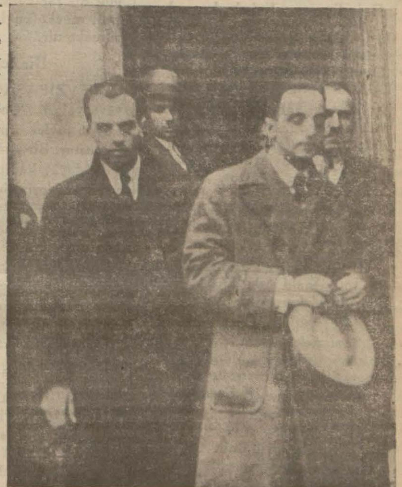
Mazanlardan ikisi Polis Müdüriyetinde

Eroin, kokain gibi gizli ve uyuşturucu maddeler üzerinde çalışan büyük ve müthiş bir şebekenin meydana çıkarıldığını dün haber vermiştik. Yapılan isticvat bat ve yaptığımız tahkikat şebekenin zannedildiğinden çok mühim ve beynelmilel şebekelerle alakadar bir faaliyet yuvası olduğunu göstermektedir. Bu hususta aldığımız yeni ve dikkate şayan malûmatı neşrediyorumuz: