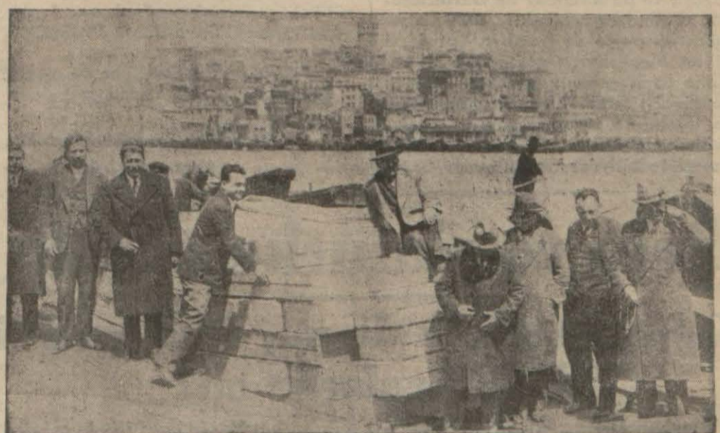
Yumurta tacirleri Sirkeci rıhtımında yumurta sandıklarının başında..

Yumurta tacirleri, dün aralarında bir toplantı yaparak ecnebi memleketlerine yumurta nakliyatı etrafında görüşmüşlerdir. Bu toplantıda, ecnebi vapur kumpanyalarının yumurtalarını yüksek ücretlerle naklettiklerinden ve bu hususta aralarında anlaşma hasıl ettiklerinden şikâyet edilmiştir. Yumurta tacirleri, bu vaziyet karşısında ecnebi vapur kumpanyalarına karşı kendi menfaatlarını korumaya karar vermişler ve yumur-