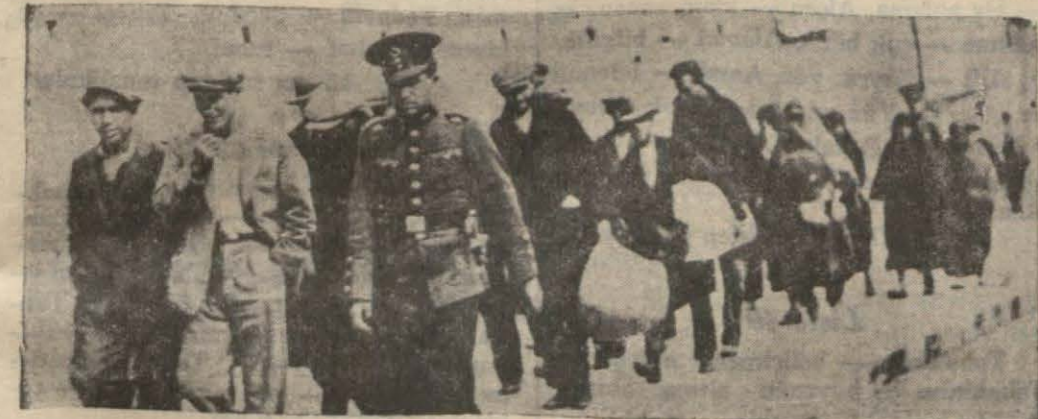
Komünistler Emniyet Müdürlüğünden Adliyyeye isticvaba sevk ediliyorlar.