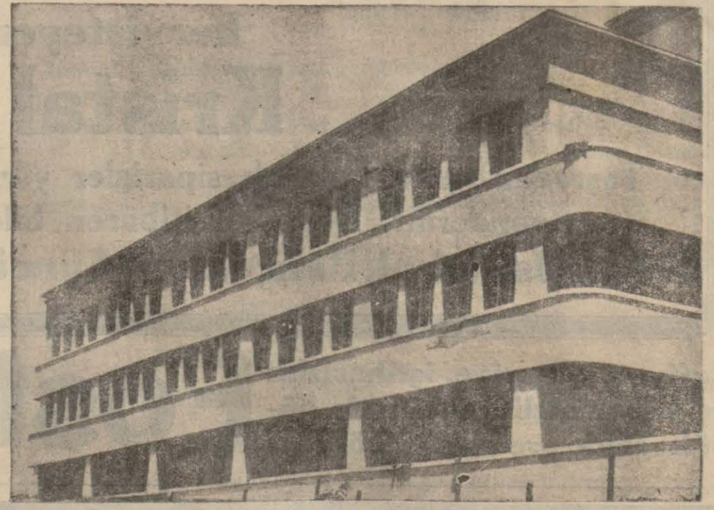
Leyli kısmı da ikmal ve inşa edilecek olan İsmet Paşa Kız Enstitüsü