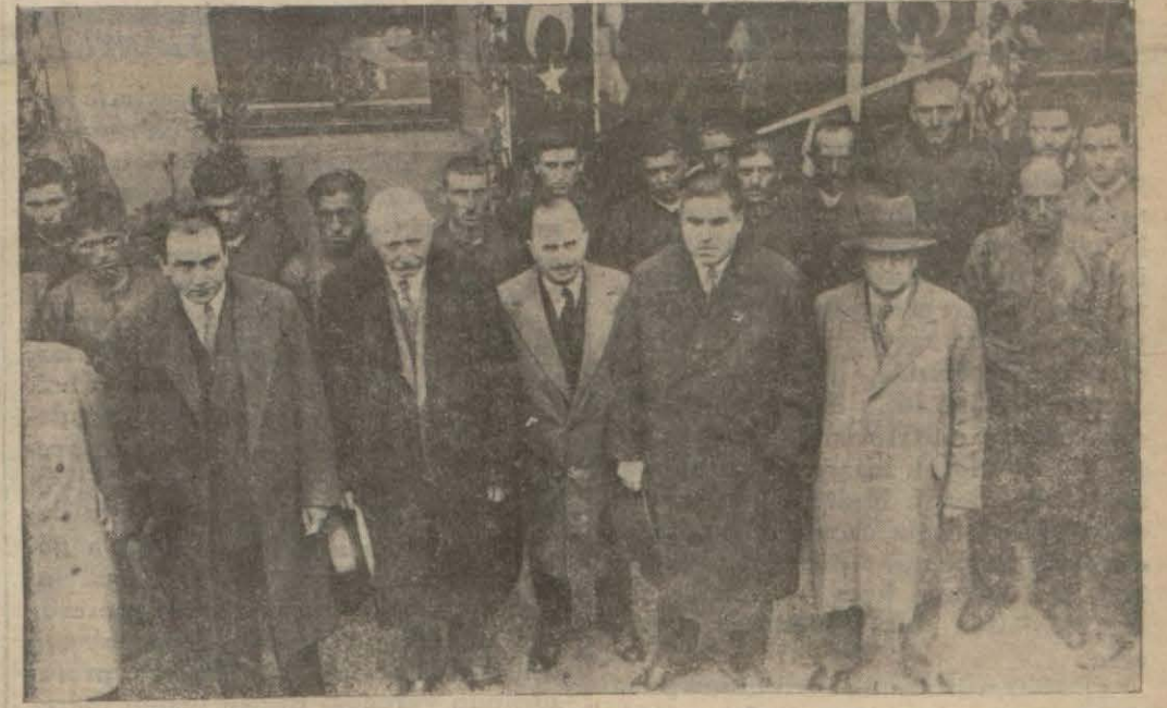
Balat atelyesinde küşat resmi yapılırken...

Müddei umumilik komünistleri yedinci istintak hâkimliğine tevdi etmiştir.