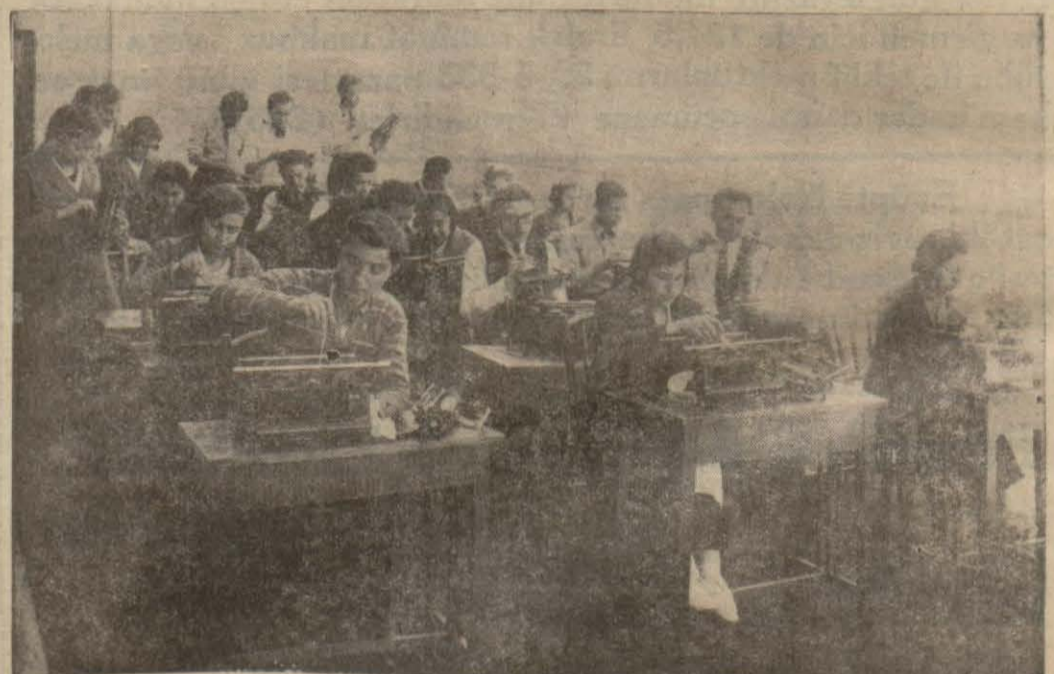
Talebe daktilo makine lerini temizlerken...

Mektebin söz derleme ocağının muntazam çalışan bir talebe kolu vardır. Her talebe dil inkişabine yakından alâkadardır. Derleme işlerinde uğraşır. Türkçe muallimle beraber çalışan derleme kolu uğraşmasının neticesini Türk dili tetkik cemiyetine göndermektedir.