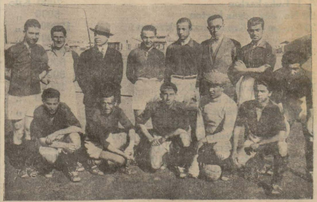
Ankara Ticaret mektebi futbol takımı

Bütçe 978,041 lira olarak mütevazıdır. Yol inşaatı için 63,443 lira tahsis olunmuştur.