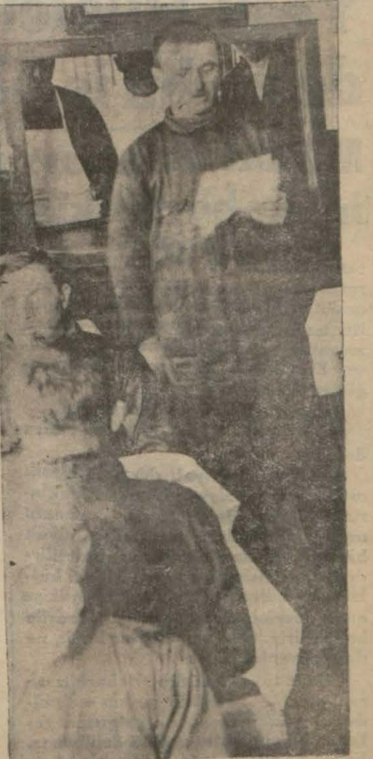
İşçi nutuk söylüyor