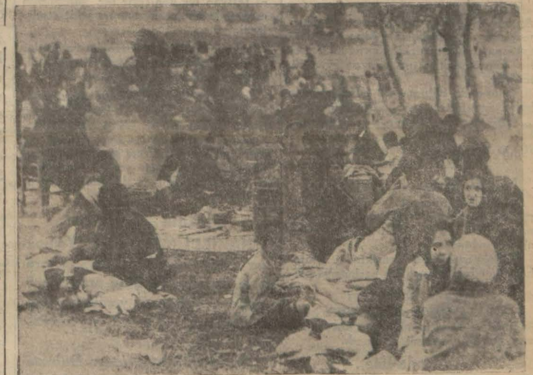
Kâhtanede eğlenenlerden bir grup..