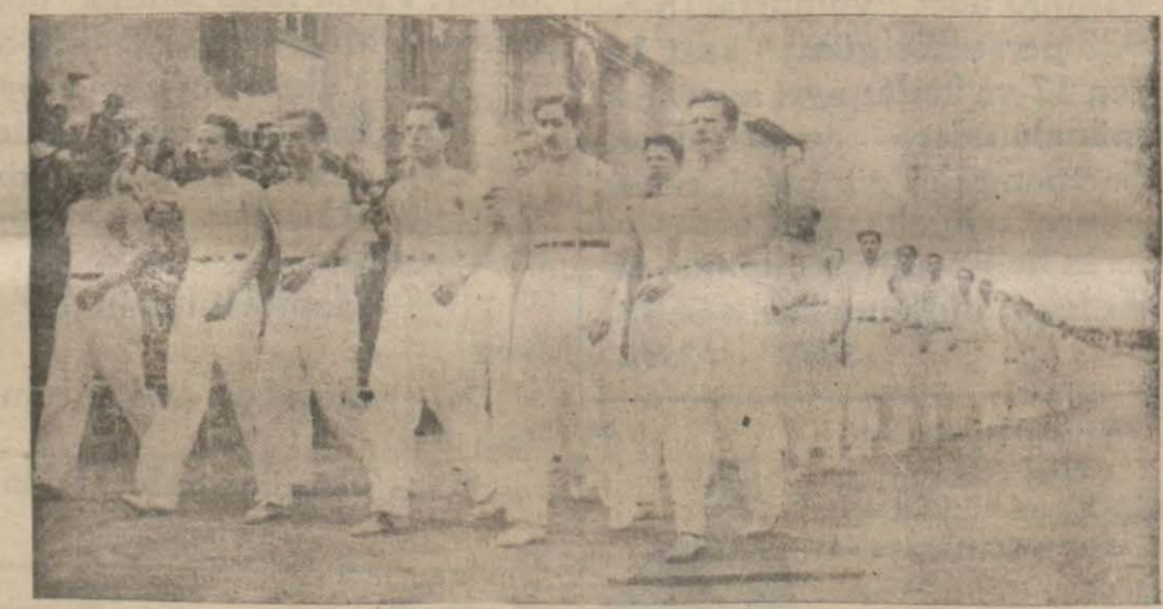
Ankarada Erkek lisesinin bir geçişi

Masaj ve Oltra - Viole sun'î güneş banyosunu tecrübe etmek isteyenlerden hiç bir ücret talep edilmeyecektir. Bütün bunlardan başka her akşam sergide havagazının nasıl idareli kullanılacağına dair faydalı konferanslar verilecektir.