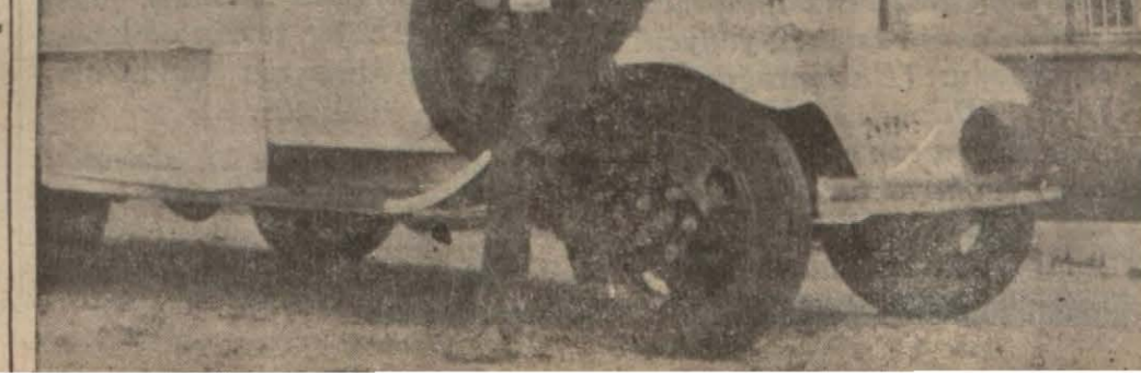
Mm Roosevelt'in seyahat etmekte olduğu arabaya zarif bir Ford kamyonu Buradan Ankara, Kayseri, Adana, Isparta, Şam, Bağdat'a uğradıktan sonra İstanbul'a geçecekler, oradan Singapur'a gideceklerdir.

Mm Roosevelt memleketimizde seyahat için gösterilen kolaylıklardan memnun olduğunu lâzım gelen vesikalarn Turing Klübü tarafından temin edildiğini beyan etmiştir.