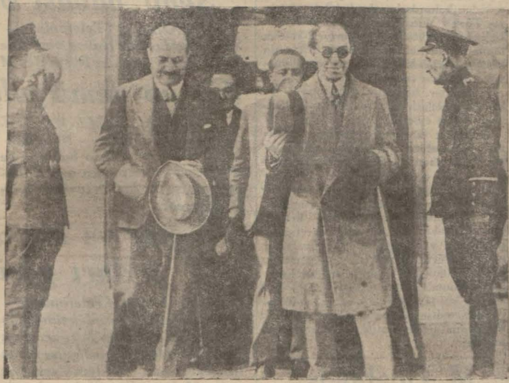
Tefik Rüşti Bey istasyondan çıkıyor..