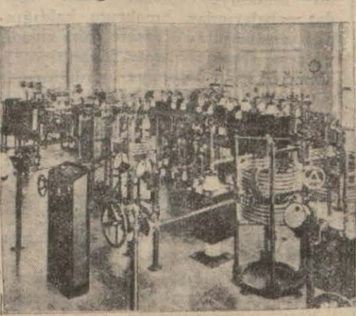
Yeni Viyana merkezinin içerisinde, bir manzara

Bir fırtınayı takip eden hava o akşam fazla şemşekli ve elektrikli olmasından bu yeni merkezi karanlıkla birlikte ve oldukça parazitli dinleyebildi. Bununla beraber bu dalgalar ve kendi ayarındaki istasyonlara nazaran yeni Viyana mükemmel idi. Musikisine doyum olmaz Viyana merkezi gerek sada yumuşaklığında ve gerek fadinge müsait olmamak hususunda noksanzıdır. Bilhassa ses temizliğinin derecesini Prag merkezile mukayese edenler nefeslerini kolayca takdir etmişlerdir.