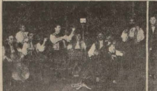
Bükreş radyosunda milli havalarını dinlediğimiz Fanikaluka Romen takımı

Bu nevi makineleri kullanmak ev kapılarındaki zilleri çalma kadar basit olduğu halde imali pek güç ve karışıktır. Meselâ bir istasyon fazla bulunabilmesi için imalde bir sürü aletin ilavesine ihtiyaç vardır. Pek pahalıya çıktığı için fazla rağbet bulacağını ümit etmiyoruz. Bu alet son Viyana sergisinde büyük merak uyandırmıştır.