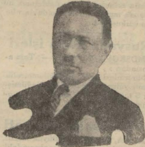
Reşit Galip Bey

31 Temmuzdan itibaren İstanbul Üniversitesi teşkiline başlanacak