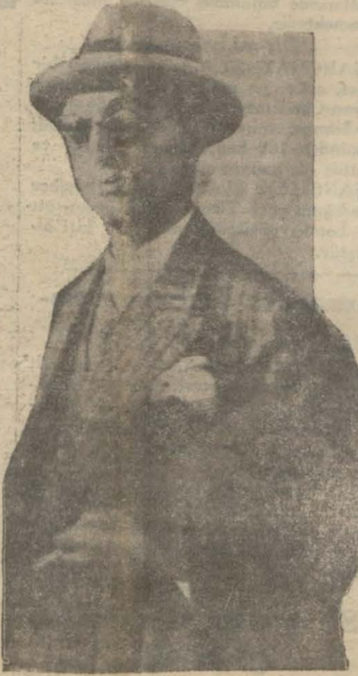
Hariciye Vekili Tevfik Rüşti Bey