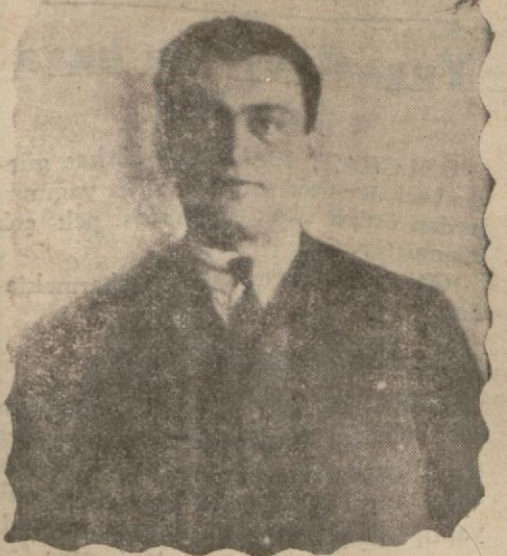
İstatistik Müdürü umumisi

ANKARA, 16 (Telefonla) — İstatistik umum müdürlüğü merkez teşkilâtı hakkındaki kanun lâiyhası ruza meye alınmıştır. Encümenlerde yapılan tadilattan sonra lâiyhann aldığı