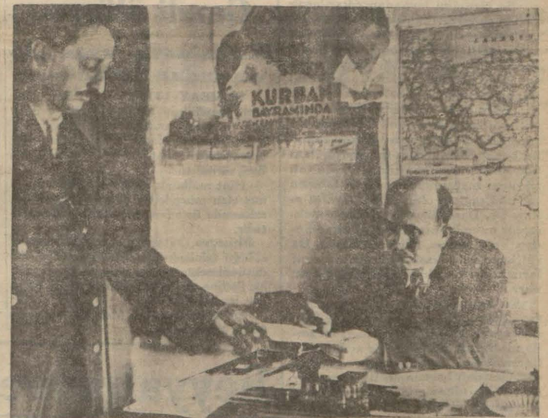
Mahalle aralarında dağıtık ve teşkilatsız iş gören şimdiki muhtarlar

Noterler muhtarlık işlerinin kendilerine devrinde isabet görüyorlar