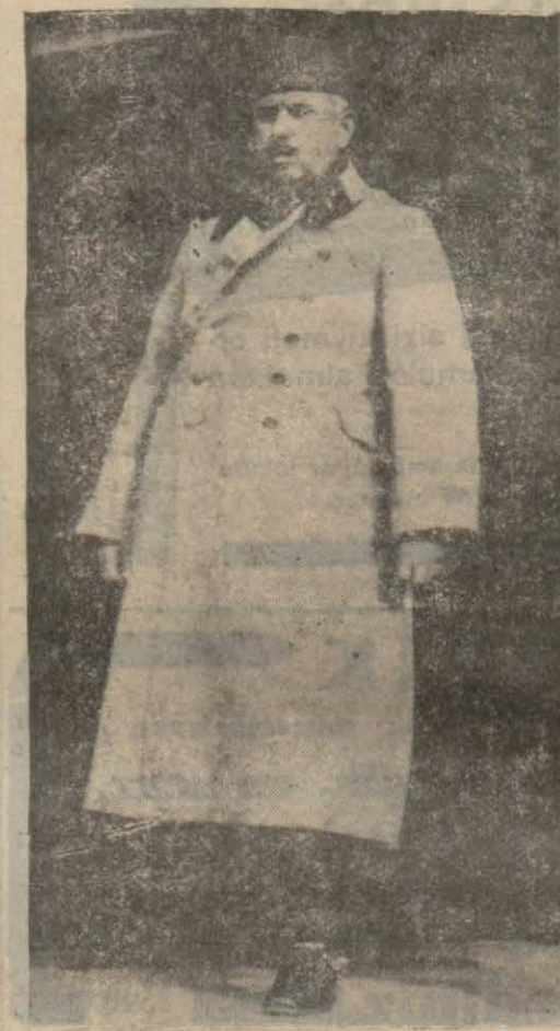
Kâzım Karabekir Paşanın eski resimlerinden

On beşinci kolordu kumandanı Kâzım Karabekir Paşa Hazretlerine; 11 Haziran 335 tarihte 1 numaralı