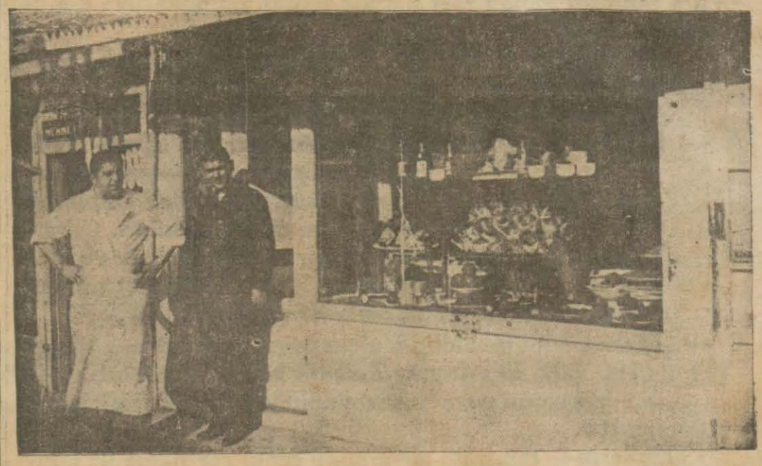
Tayfur ustann tavukçu dükkânı