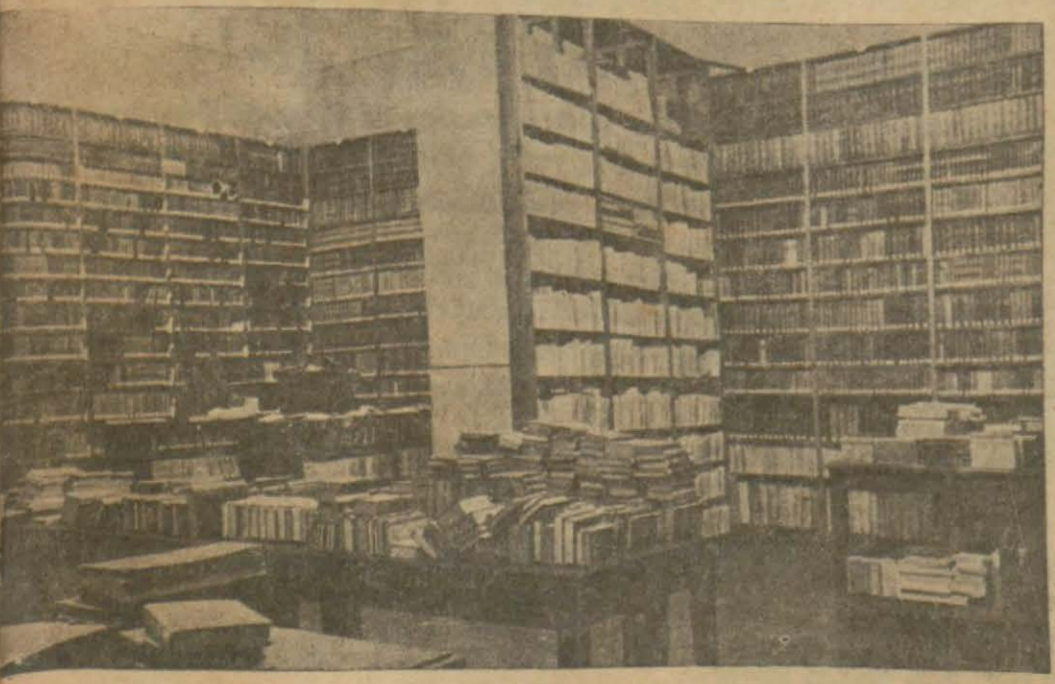
Halkevi okuma salonunda kitap dairesi hazırlanıyor