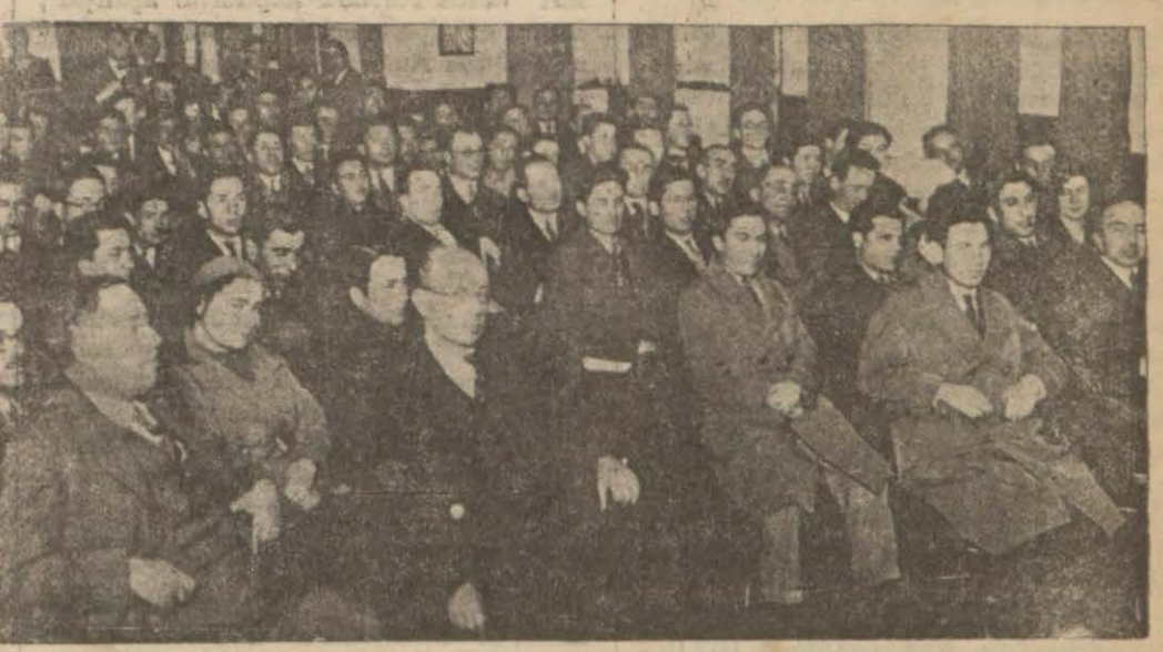
Halkevinde münakaşalı konferans esnasında

ANKARA, 30 (Telefonla) — Millet Meclisi cumartesi veya pazartesi toplantısında müteakkip içtima gününü, araya bayram girmesi hasebile, 10 nisan pazartesi olarak tesbit edecektir.