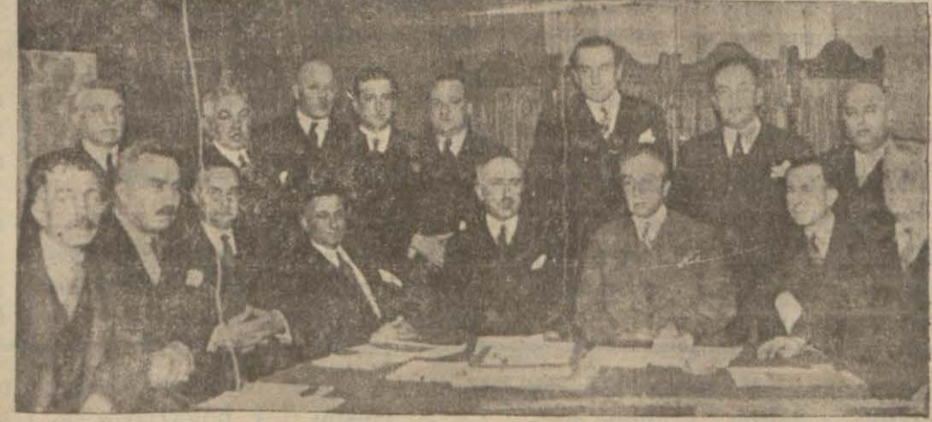
Liman Şirketinde umumî içtima yapıldı

Dünya bankalarına sahtekarlık bildirildi Zabta, muhtelif bankalara yüz lirallık sahte evrakı nakdiye sürmek teşebbüsünde bulunan gizli bir kalpazan kumpanyasının meydana çıkararak üzere bir kaç gündenberi ehemmiyetle meşgul olmaktadır. Geçen pazartesi günü ilk defa olarak Adapazarı Ticaret Bankasına Hendek'e gönderilmek üzere verilmiş istenen bir miktarda evrakı nakdiye meyanındaki bir yüz liralık banka veznedarının nazarı dikkatini celbetmiştir. Bu para tetkik edilmiş, piyasada sahte yüz liralık olmadığı bilinmesine rağmen bunun kalp olduğuna dair kuvvetli şüpheler uyanmış, neticede iş zabıtabaya aksetmiştir. Emniyet Müdürlüğü 2 inci şubesi derhal tahkikata başlamış, bu yüz liralığı bankaya götüren zatin ifadesine müraacaat etmiştir. Tahkikat henüz devam ederken Banco di Roma da buna benzer bir hâdisa olmuş, bunu diğer muhtelif bankalarda hemen aynı mahiyette müteaddit hâdiseler takip etmiştir. Bu suretle muhtelif bankalara tevdi edilmek istenirken ele geçen sahte yüz liralıkların adedi dün akşama kadar 12 yi bulmuştur. Bu iş cesaret edenler, her hangi bir bankaya bir kaç yüz lira yatırıp namalarına hesabı cari açtıyorlar, sonra (Devamı 4 üncü sahifede)