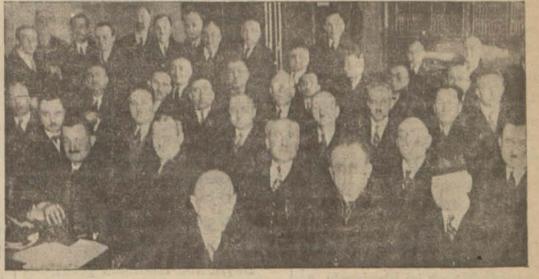
Baroda dünkü intihap toplantısı

Listelerde çıkan kelimelerden manaları birden fazla olanların her manası için ayrı karşılıklar ileri sürülebilir. Karşılık gönderen zatların gönderdikleri karşılıktan duyulmuş ve işitilmiş olmyanları hangi kaynaklardan aldıklarını göstermeleri rica olunur.