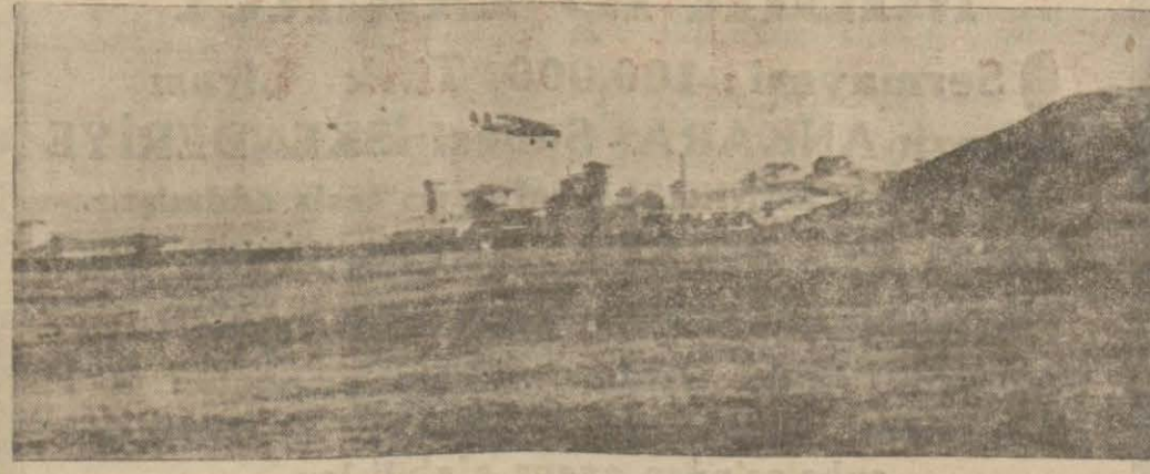
Ankara - İstanbul arasında işleyen uçaklardan biri hükümet merkezindeki meydana inerken.