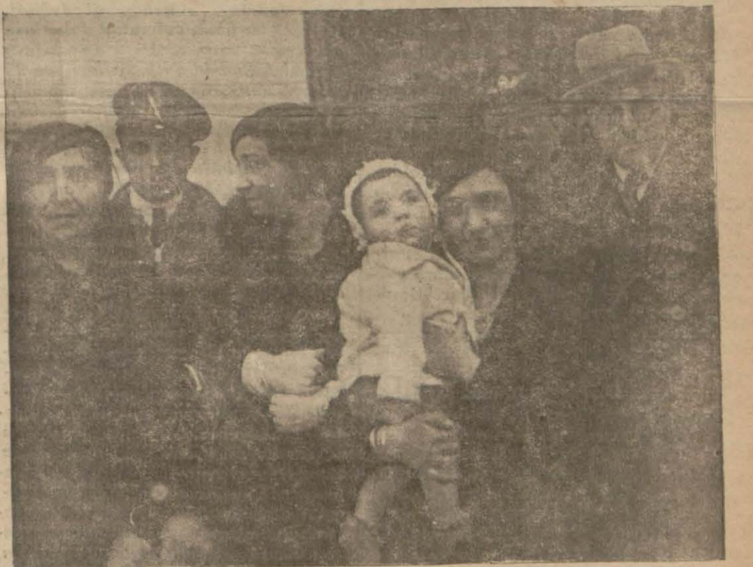
Dün Ankaradan tayyare ile gelen Hanımlar ve 6 aylık Ercan