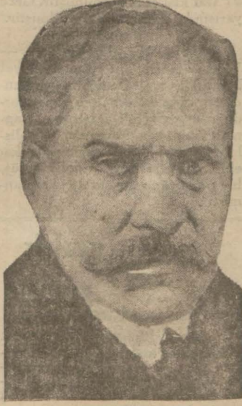
Silâhsızlanma konferansına mühim bir plân veren İngiliz Başvekilî M. Mac Donald

Ordu mevcudları askerlik vazifesinin ifa edildiği günler sayısının vasatına göre hesap edilecektir. Bununla beraber Avrupa kıtasındaki memleketlerin kara