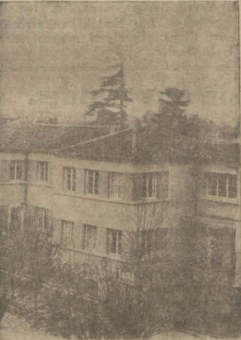
Haseki hastanesinin bir kısmı