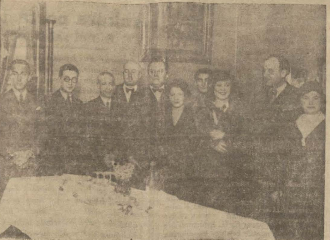
Smirnof'un dünkü davetinde gazeteciler

İki konser vermek üzere şehrimize gelmiş olan meşhur Rus tenoru M. Dimitri Smirnof ile refikası dün Londra otelinde İstanbul gazetecileri şerefine bir çay ziyafeti vermişler ve bir kaç şarkı söylemek nezaketini göstermişlerdir. M. Dimitri Smirnof 1920 senesindenberi Pariste yerleşmiştir. Bir ay evvel Avrupada bir turneye çıkmış olan M. Smirnof ve refikası Münir ve Suriyeye gitmişler ve oradan İstanbul'a gelmişlerdir.